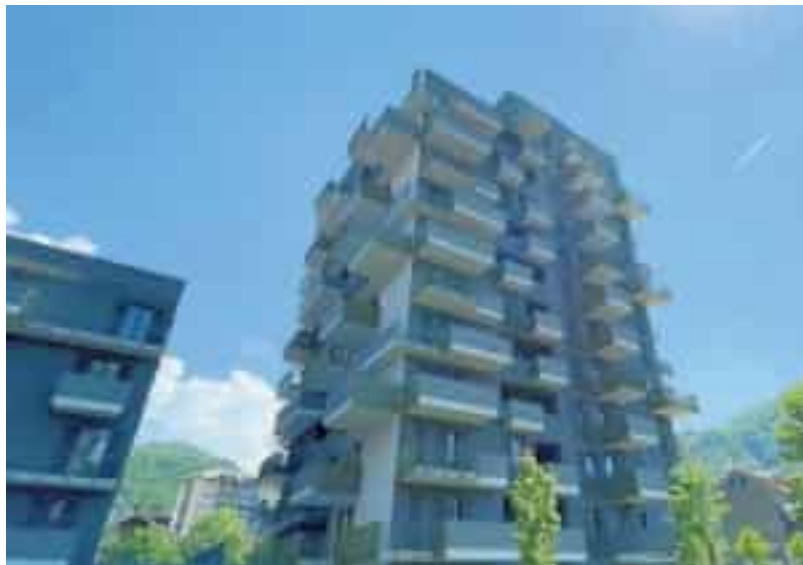
▲ L'area ex Boero

Il progetto è firmato dall'architetto Enrico De Carlo e il Comune lo descrive così: «La soluzione progettuale prevede la costruzione di un fabbricato a due piani fuori terra: al piano terra trovano posto ambulatori e studi odontoiatrici mentre al piano primo sono collocate attività connesse alla radiologia, ecografia, senologia diagnostica, ecografia pediatrica, TAC, MOC, radiodiagnostica digitale. In copertura sono previsti due locali tecnici nonché l'instal-