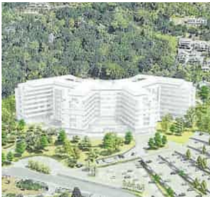
Come dovrebbe diventare l'ospedale del Felettino

sunto della lunga storia amara dei 119 milioni e 917 mila euro messi a disposizione dallo Stato nel 2013, per l'ospedale della Spezia. L'appalto del 2015 prevedeva un costo da 175 milioni. Si è arrivati purtroppo al 2024 con un nulla di fatto, con un costo salito a 264 milioni 373 mila euro, 97 milioni dei quali saranno anticipati da privati, in prestito. Per cui sarà la Asl 5 a doverli restituire con un canone annuale milionario.