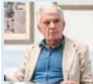
LUIGI BOTTARO DIRETTORE GENERALE ASL 3 GENOVA

Il 30% dei pazienti che arriva al pronto soccorso sono over 65 che il medico non riesce a gestire