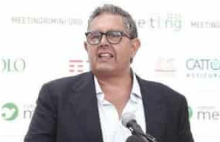
Il Governatore della Regione Liguria Giovanni Toti

Dopo il porto, tocca alla sanità: nel mirino anche l'ex capo di gabinetto Le opposizioni in consiglio regionale chiedono dimissioni e nuove elezioni