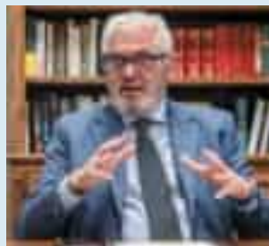
ANGELO GRATAROLA ASSESSORE SANITÀ REGIONE LIGURIA

Avremo ambulatori aperti dalle 8 alle 24. Serve una campagna per spiegare quando andare in pronto soccorso