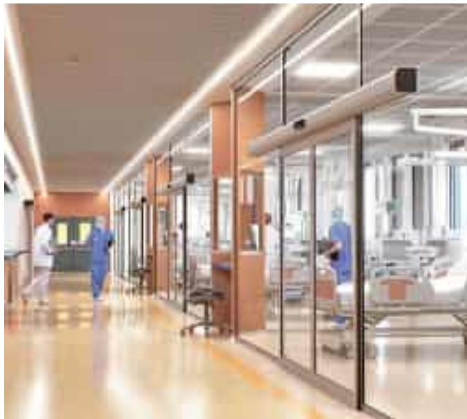
Ecco come dovrebbero diventare le nuove corsie dell'ospedale

I vertici dell'impresa di costruzioni, con sede a Rovigo ma rilevata al 51% da una società abruzzese, non si sono ancora presentati alla Spezia. Nell'aprile del 2023 hanno incontrato a Genova il presidente della Regione Giovanni Toti ed i vertici della giunta regionale. Il 2 novem-