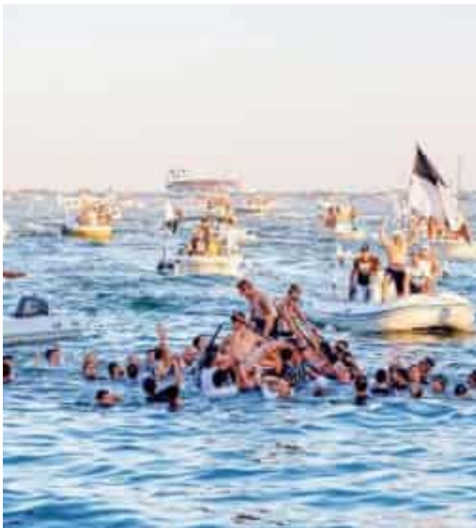
Cadimare festeggia il trionfo al Palio del Golfo 2021

L'allora capo di gabinetto, figura centrale della maxi-inchiesta delle procure di Genova e La Spezia, traccia un percorso netto per risolvere la