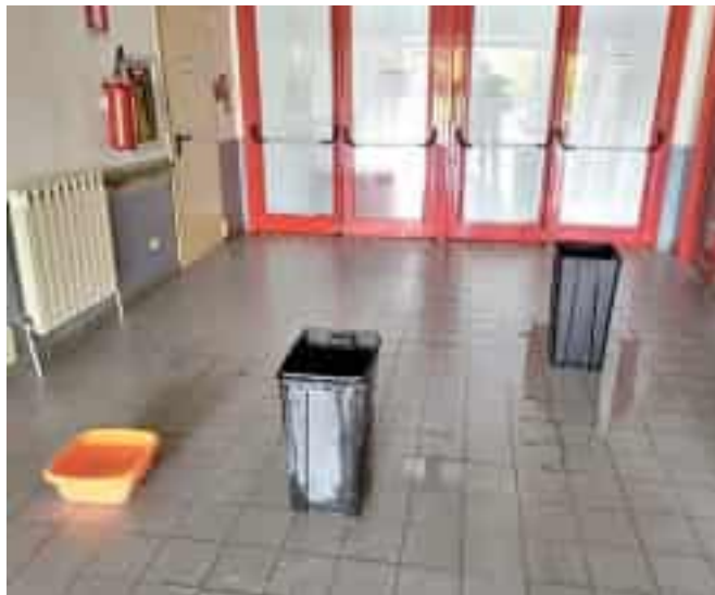
Cestini e bacinelle utilizzati d'urgenza per la raccolta dell'acqua

A raccogliere le gocce alle 10,30 ancora quattro cestoni normalmente utilizzati