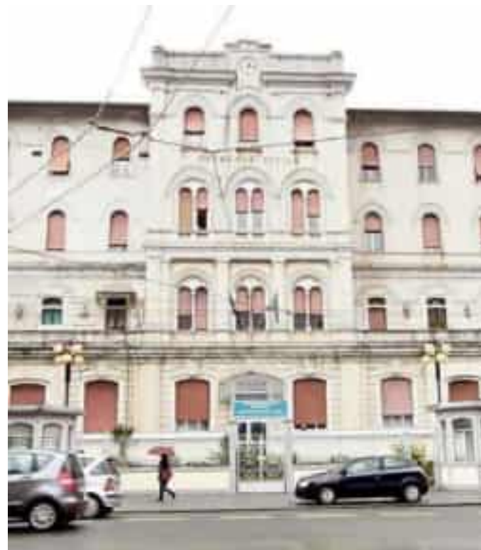
L'ospedale Sant'Andrea, l'Asl punta anche su Centrali Territoriali

«Con la delibera di giunta 471 del 2024, abbiamo avviato il percorso di certificazione delle Cot così come previsto dall'obiettivo Pnrr con scadenza al 30 giugno 2024 - ha dichiarato l'assessore regionale