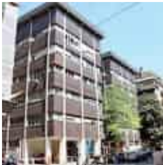
La sede del consultorio Asl 5

Il tema delle associazioni pro life all'interno dei consultori è stato dibattuto durante l'ultimo consiglio comunale, partendo dalla mozione presentata dal Partito Democratico e dalle consigliere di minoranza per chiedere a sindaco e giunta "di esprimere al Presidente della Regione Liguria e alla