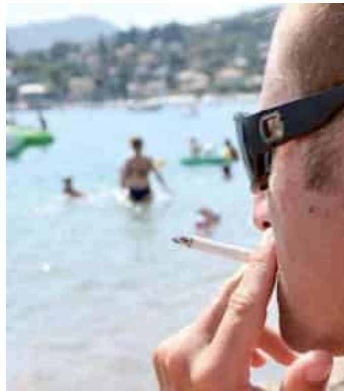
Non calano i fumatori nella fascia di età tra i 50 e i 69 anni

Dall'indagine emerge per l'Asl5 una buona notizia: la percentuale di fumatori è in calo sia tra i maschi che tra le donne e in tutte le fasce d'età ad eccezione di quella tra i 50-69 anni. L'indagine effettuata dimostra anche che il 44% dei fumatori ha tentato di smettere almeno una volta, ma oltre il 75% fallisce l'obiettivo di rimanere astinente dal fumo per più di sei mesi, la motivazione è il sostegno nel percorso di disassuefazione sono fattori cruciali per raggiungere l'obiettivo. "Proteggere i bambini dalle interferenze dell'industria del tabacco" è lo slogan scelto per la Giornata mondiale di quest'anno. Il fumo, infatti, è dannoso ad ogni età, ma il ri-