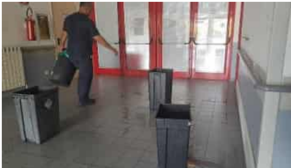
Il pavimento allagato nell'area antistante dialisi al San Bartolomeo: il problema causato dalla rottura di un tubo dell'osmosi

« Il problema si è verificato questa mattina alle 5.30 circa e, grazie all'intervento tempestivo di un tecnico specializzato, alle 7.30 era già stato risolto – ha specificato la direzione di Asl 5 – Abbiamo comunque iniziato la dialisi con 15 minuti di ritardo per permettere ai pavimenti di asciugarsi, in modo da garantire la massima sicurezza a pazienti e operatori. Sempre in quest'ottica è stato interdetto il passaggio degli utenti nel corridoio che conduce all'oncologia, comunque raggiungibile attraverso un percorso alternativo che si è provveduto a segnalare». Nel pomeriggio invece l'unico disagio rimasto sarebbe stato il blocco di entrambi gli ascensori pedonali, quindi non adibiti al trasporto di barelle «che si aprono nei locali che so-