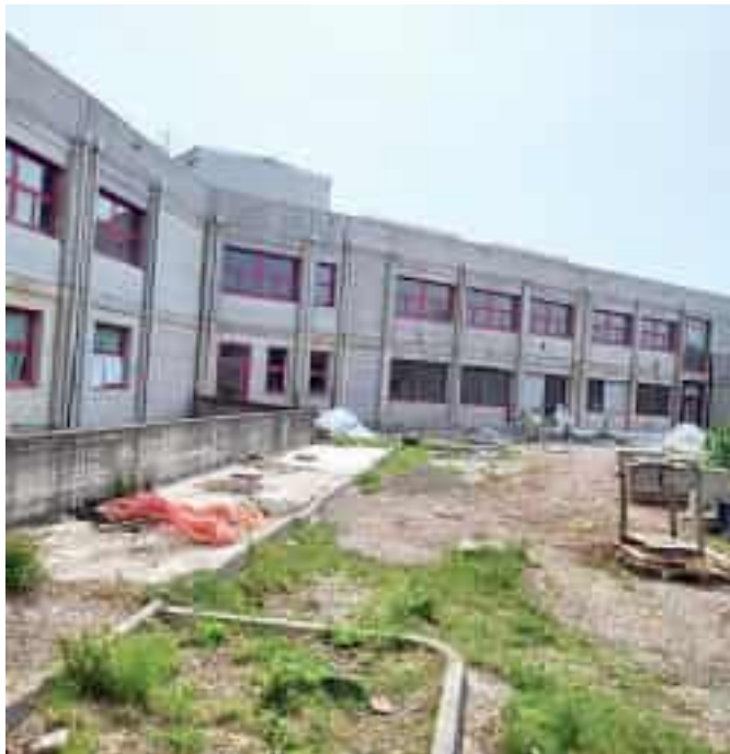
Una delle zone esterne dell'ospedale di Sarzana

L'area che era stata utilizzata ad hub vaccinale ai tempi del Covid è in totale dismissione calcinacci e detriti un po' dappertutto, porte aperte, nessuna possibilità di immaginare cosa possa essere ricavato nel grande stanzone utilizzato per i famosi 15 minuti di attesa, subito dopo la somministrazione della dose di vaccino. Ci sono due operai che lavorano. Ma tutto intorno c'è grande caos. A proposito di pensiline. Quella dell'Atc della fermata ospedale (c'è una corsa che si chiama proprio La Spezia-Lerici-Ospedale San Bartolomeo) è impresentabile. «Guardi le erbacce – dice una signora appe-