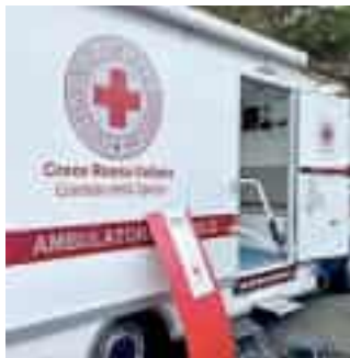
L'ambulatorio mobile della Cri

Per questo le Infermiere Volontarie della Cri spezzina hanno voluto dedicare la nuova iniziativa proprio a lei, che del sostegno ai più