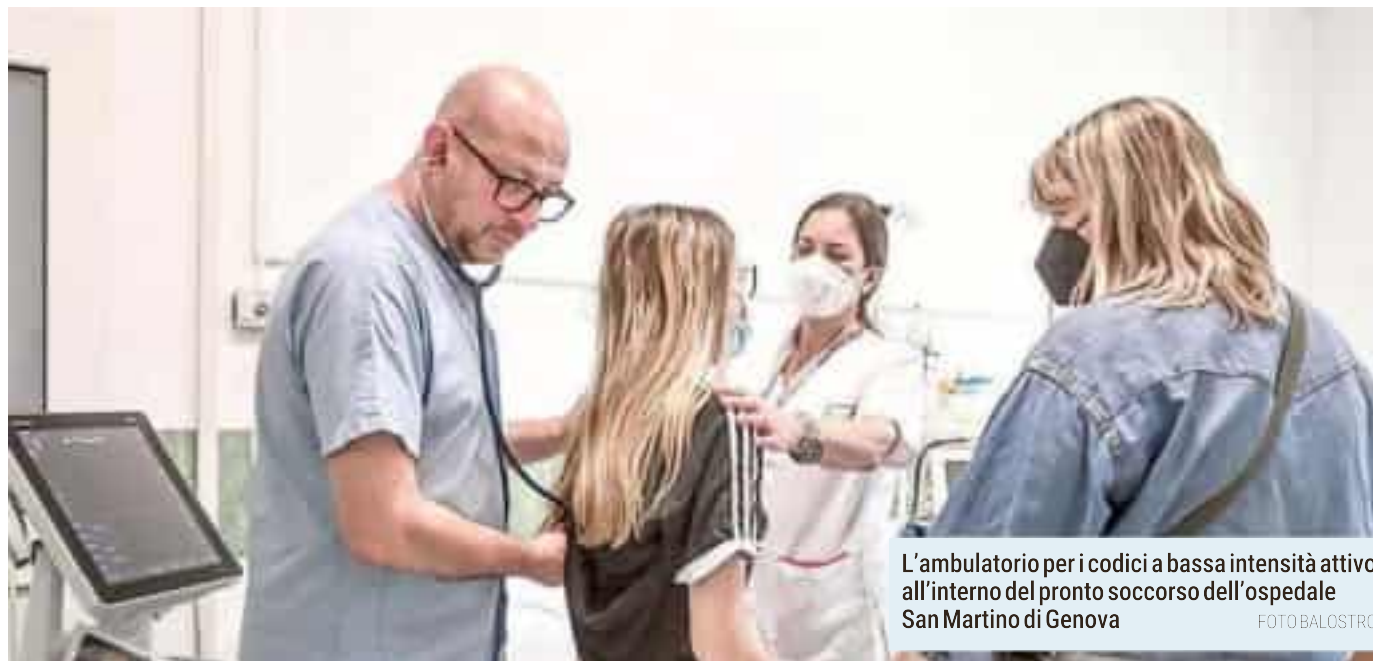
L'ambulatorio per i codici a bassa intensità attivo all'interno del pronto soccorso dell'ospedale San Martino di Genova