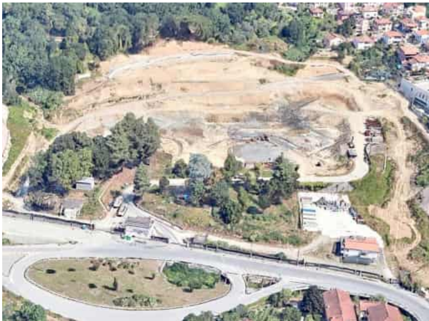
Una veduta dall'alto dell'area cantiere del nuovo Felettino

«Come prima ottimizzazione è stato riprogettato completamente il parcheggio generale a sud dell'area, a servizio dei dipendenti e dei visitatori». Prevede ora due livelli e un aumento del numero di posti auto. La prima ipotesi di parcheggio è stata modificata dalla Guerato «a causa dell'elevata distanza, 150 metri». In sostituzione, «come espediente migliorativo, è stato pensato un parcheggio multi-piano che ha portato i posti auto complessivi da 760 a 906, inglobando gli 86 posti auto del parcheggio Anas». Sono stati razionalizzati anche gli ingressi, al fine di evitare la formazione di possibili code. La forma è triangolare