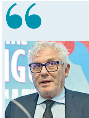
ANGELO GRATAROLA ASSESSORE REGIONALE ALLA SANITÀ

Tra quattro anni il trasferimento dei primi pazienti nella struttura che verrà realizzata alla Spezia