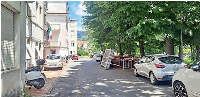
Il cortile del San Nicolò con i ponteggi per l'avvio del cantiere