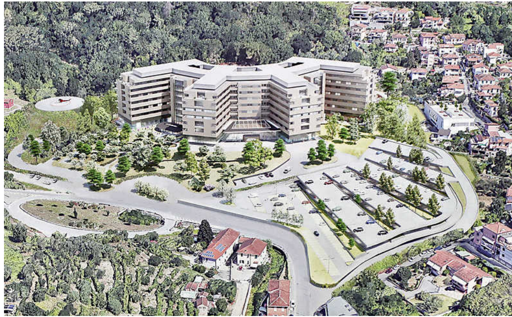
Un rendering del nuovo ospedale del Felettino

L'atto è ufficiale, è stato allegato dagli uffici regionali al bando di gara per la direzione lavori e il collaudo. Gli 850 giorni nei quali la società di Rovigo si è impegnata a realizzare l'ospedale del Felettino sarebbero dovuti partire da mercoledì 28 giugno 2023. Se partiranno nel settembre del