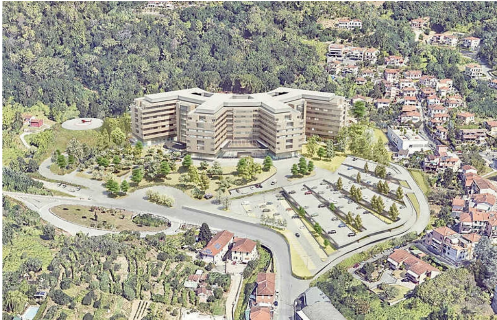
Un rendering del nuovo ospedale del Felettino

Il 13 novembre 2023 viene firmato il contratto fra Ire, Asl 5 e la Guerrato, che intanto ha costituito una società di progetto chiamata Felettino Hospital Service. Rina ha messo nero su bianco una sfilza di osservazioni sul definitivo. Ora si passa