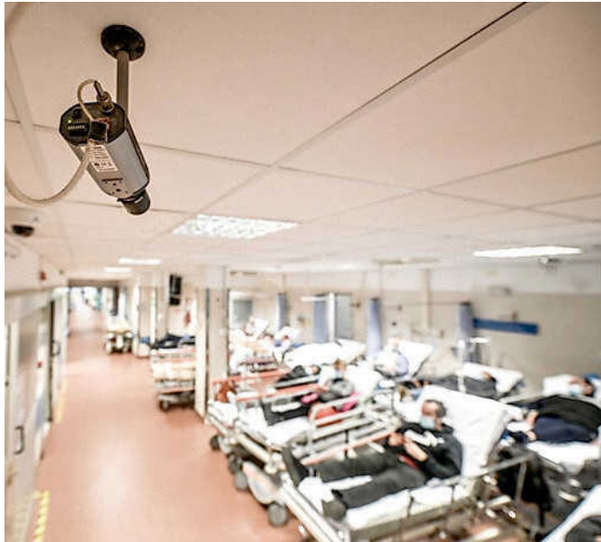
La sanità è uno dei temi più caldi dell'Autonomia

L'iter legislativo è comunque lungo: il governo, in accordo con le Regioni, ha un anno per definire i Lep, i Livelli essenziali di prestazione che devono essere garantiti su tutto il territorio nazionale. La Liguria ha elencato, già nel 2019, i propri obiettivi: le materie sono nove, dalla sanità alla scuola, fino ai trasporti e al demanio marittimo. Non a caso, a livello nazionale e locale si sono scatenate le opposizioni, dalla leader Pd Elly Schlein («Avete deciso di dare il colpo di grazia alla sanità pubblica») al variegato Comitato Provinciale Referendario genovese per respingere l'autonomia differenziata composto da Acli Liguria, Anpi, Arci Genova e Liguria, Auser Genova e Liguria, Camera del Lavoro Metropolitana di Genova, Comitato Dossetti per la Costituzione, Comitato ligure scuola e Costituzione, Comunità di San Benedetto al Porto, Coordinamento per democrazia costituzionale Genova, Europa Verde Liguria, Federconsumatori, Giuristi De-