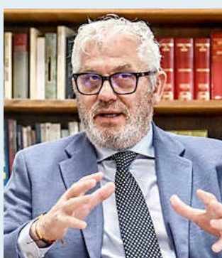
ANGELO GRATAROLA ASSESSORE ALLA SANITÀ REGIONE LIGURIA

Per Gratarola, l'autonomia differenziata in sanità è uno strumento di semplificazione e, soprattutto, una opportunità per garantire servizi più mirati. «E questo vale sia in termini ospedalieri sia in termini di medicina territoriale, che deve tenere conto delle peculiarità non solo oro-