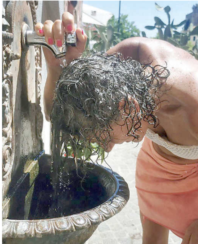
Una donna si rinfresca in città sotto una fontana

Il questionario ha indagato tre aspetti: ambiente, stile di vita e stato di salute, per individuare eventuali criticità e proponendo semplici indicazioni del Ministero della Salute per migliorare le abitudini. Attualmente le persone monitorate sono oltre 300, più del doppio rispetto all'anno scorso: «Per ciascuno di loro, se l'Ifec lo ritiene opportuno, viene attivato un accesso domiciliare, in accordo con il medico di Medicina generale, così da assicurare, se necessario, la continuità di percorso, attraverso la scelta del miglior setting assistenziale». Per tutti, non solo per i