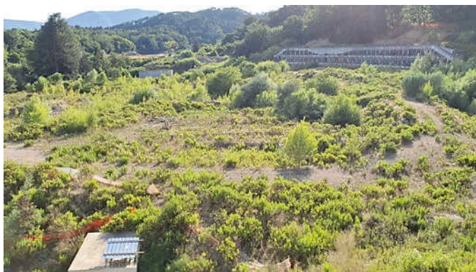
Nessuna traccia di cantiere nell'area dove dovrà sorgere l'ospedale

Il tema era già stato discusso a metà luglio in consiglio regionale, ma Raffaelli, presentando l'interrogazione firmata dal gruppo Pd- Articolo Uno, si è rivolto all'amministrazione: «Chiediamo un nuovo aggiornamento: sono passati cinquanta giorni dall'ultimo confronto con