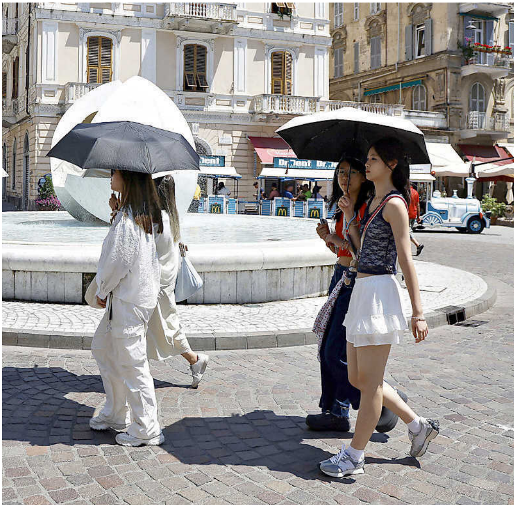
Turisti in piazza Garibaldi si riparano dal sole usando degli ombrelli

I medici di base consigliano di non svolgere attività fisica all'aperto e di adottare tutti quei comportamenti utili ad evitare gli effetti delle ondate di calore. Gli stessi esperti della Regione Liguria, di concerto con Alisa, invitano i cittadini a indossare abiti adeguati di cotone e lino con colori chiari e di coprire il capo. Regione Liguria e Alisa in una nota inviata a tutte le Asl liguri e quindi anche all'Asl 5 hanno sottolineato tutte le misure da osservare: il pericolo concreto per la salute sussiste non solo per giovani e anziani, ma anche e soprattutto per quelle persone alle prese con patologie croniche e per tutti coloro che svolgono attività lavorative all'aperto. La grande ondata di calore è monito-