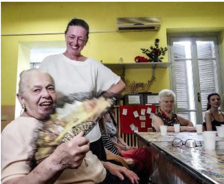
Gli anziani sono i soggetti esposti a maggior rischio