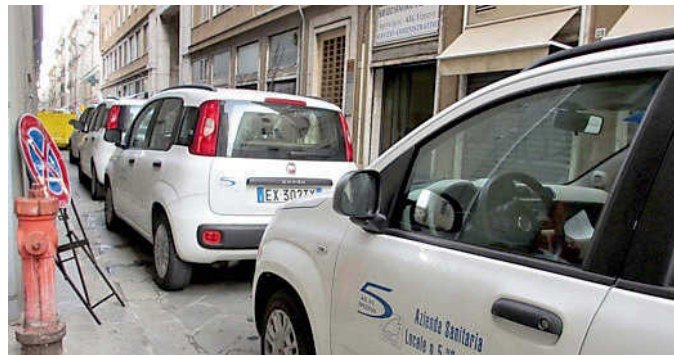
L'ingresso della direzione sanitaria in via Fazio

A partire da luglio 2022 è scattata la nuova organizzazione, ma i costi del personale sono rimasti a bilancio, con una apposita voce di rimborso «in linea con le definizioni dei budget per l'eserci-