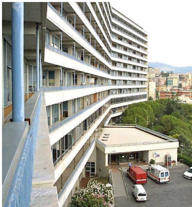
Il Monoblocco dell'ospedale San Martino

L'operazione che ha pochi precedenti in Europa, è stata prima studiata all'interno del San Martino e poi raccon-