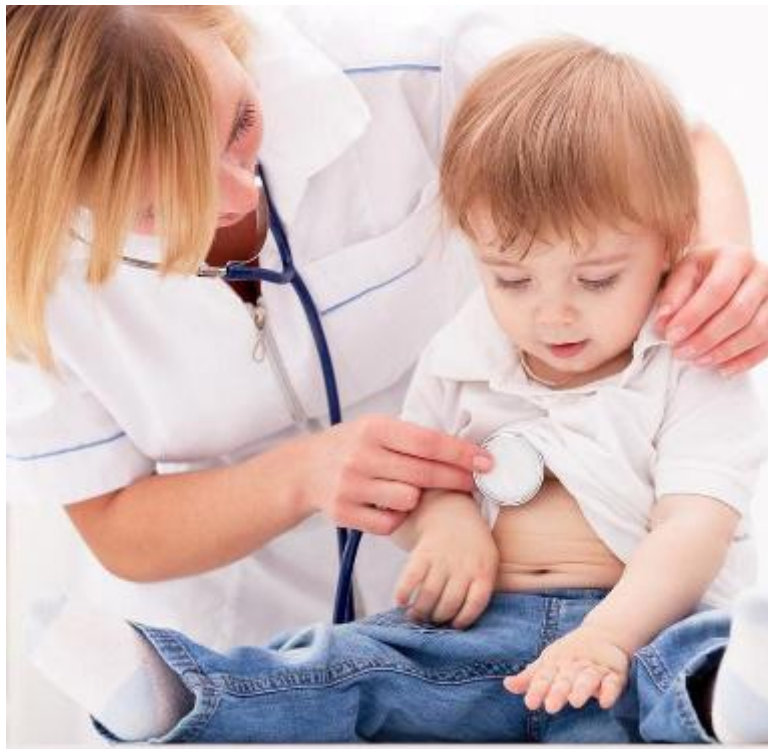
Una pediatra visita un bambino (foto d'archivio)

I camici bianchi lasciano la bassa Val di Vara, e scatta la protesta delle famiglie. Dal 1° settembre un medico di medicina generale e un pediatra che operano nei Comuni di Riccò del Golfo, Beverino e Pignone lasceranno il Distretto sociosanitario 17 per trasferirsi altrove, creando un vuoto sul quale Asl5 non è ancora intervenuta. Una situazione che sta preoccupando molto le famiglie, costrette a lunghi spostamenti per recarsi dal pediatra più 'vicino' in caso di necessità di visita dei propri bambini. A fine luglio, l'ufficializzazione del trasferimento di un medico di famiglia dal territorio della bassa Valle alla Spezia, aveva già provocato le prime dimostrazioni dei cittadini. Un disagio solo parzialmente alleviato dalla disponibilità, mostrata da