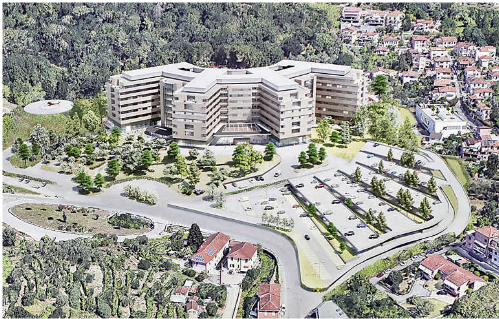
Un rendering del Nuovo Felettino

Sotto esame i crediti delle aziende sanitarie della Liguria