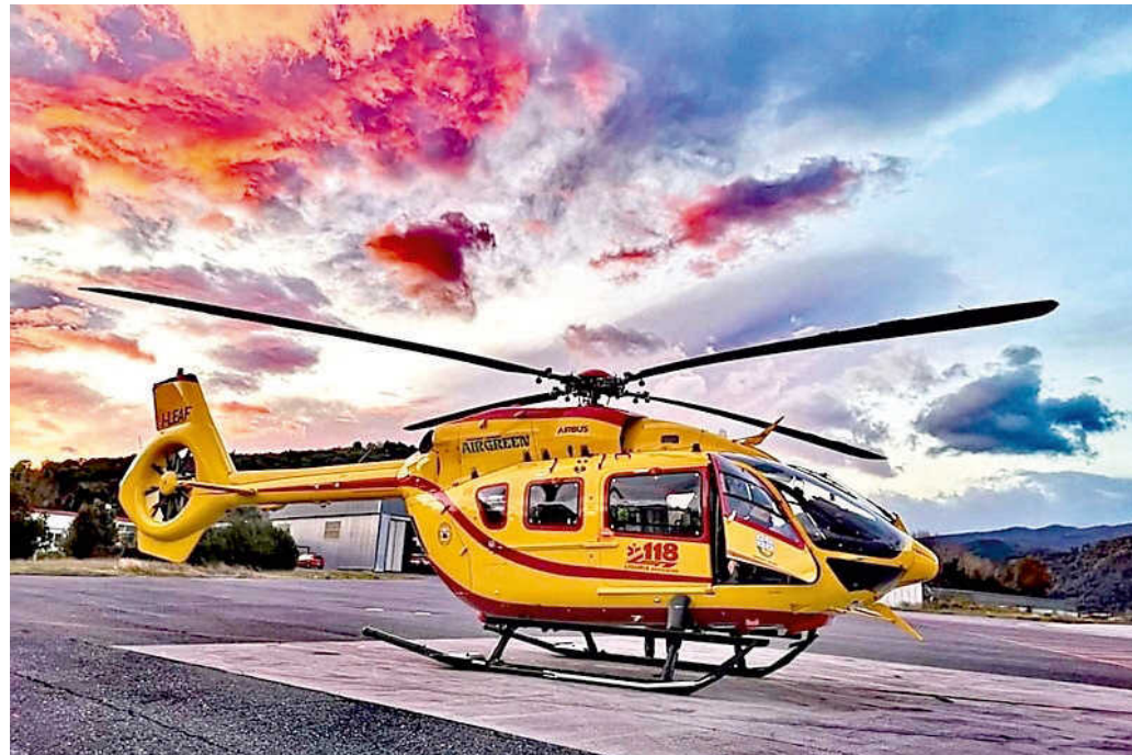
L'elicottero del 118