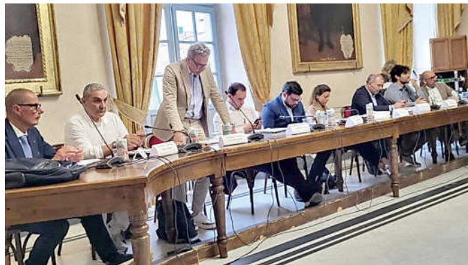
La maggioranza del Consiglio comunale di Sarzana