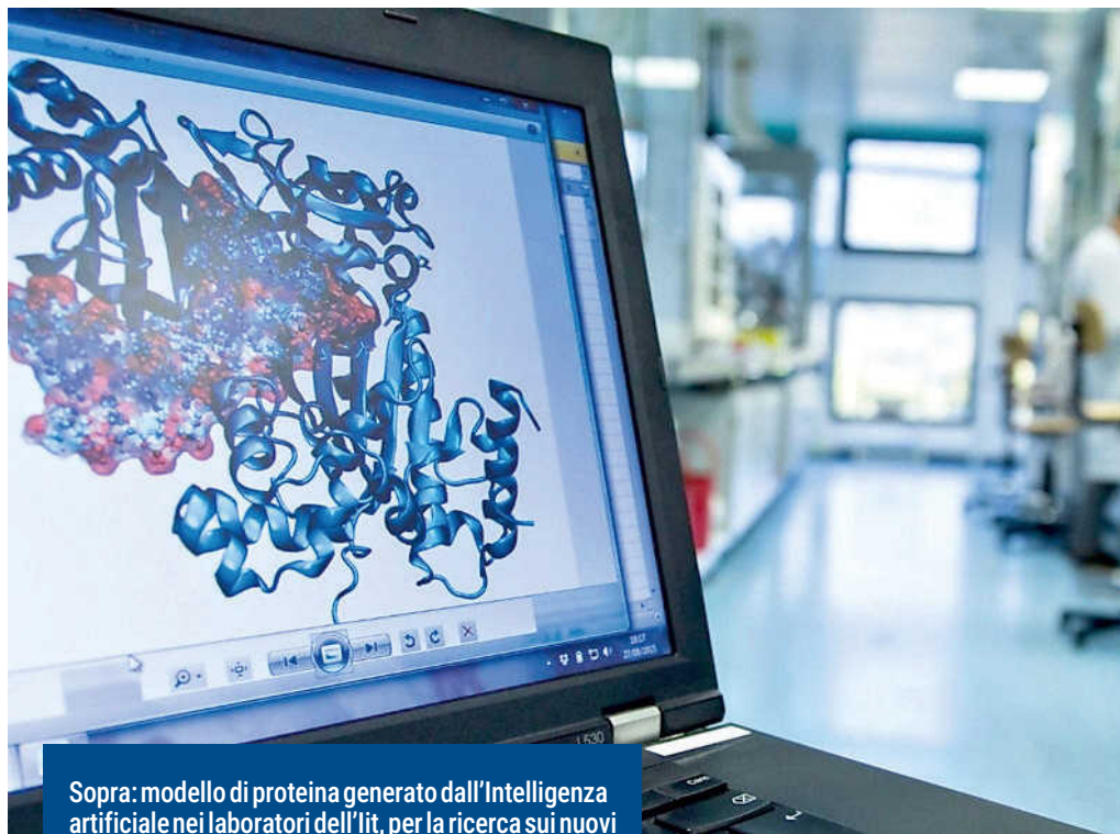
Sopra: modello di proteina generato dall'Intelligenza artificiale nei laboratori dell'Iit, per la ricerca sui nuovi farmaci. Sotto: la nuova risonanza magnetica al San Martino, che sfrutta l'AI. L'utilizzo dei dati raccolti da queste macchine è al centro del dibattito

Più soggetti in campo per sviluppare con le startup, gli ospedali genovesi e il supercomputer degli Erzelli un modo innovativo per realizzare le medicine per la cura delle malattie