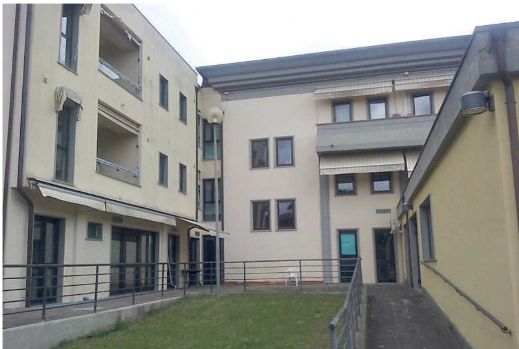
L'esterno della casa di riposo Sabbadini

Un altro problema è l'acqua potabile. Ogni ospite ha a disposizione una bottiglietta da 50 centilitri al giorno, che quando termina – ed in questa estate afosissima è accaduto sempre –, viene nuovamente riempito, ma con l'acqua di rubinetto. Che non è propriamente la stessa cosa.