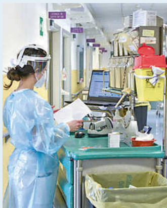
Un reparto del San Martino

Le fughe dei liguri in altre regioni costano fino a 70 milioni di euro l'anno ma spesso sono una scelta forzata: i tempi di attesa infiniti anche per interventi chirurgici banali in Ortopedia e Oculistica costringono a farsi operare in Lombardia, Piemonte, Toscana ed Emilia.