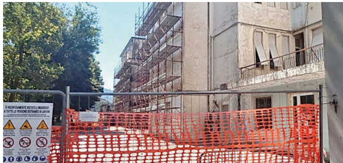
Il cantiere all'ospedale San Nicolò di Levanto