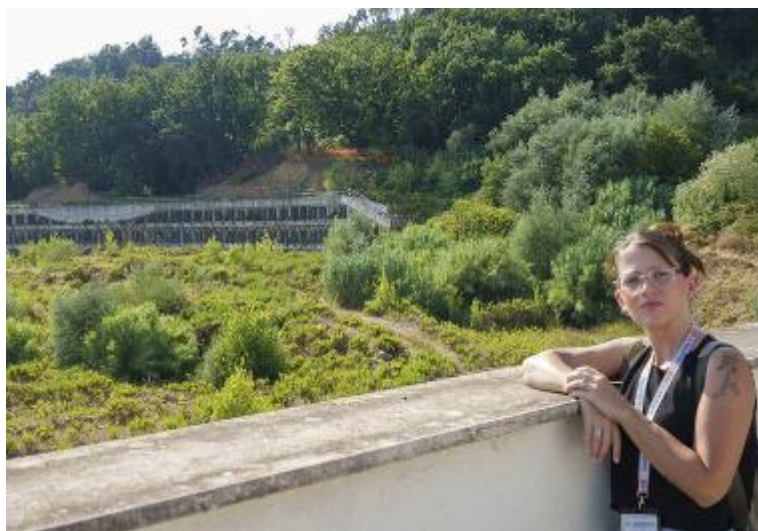
L'area del Felettino in cui sorgerà il nuovo ospedale della Spezia

Due riunioni negli ultimi tre giorni. Una corsa a ostacoli per rispettare l'ultimo cronoprogramma e vedere nuovamente ruspe e maestranze muoversi all'interno di quell'area abbandonata da anni. Prosegue serrato il cammino del nuovo ospedale al Felettino. Tra martedì e ieri, la cabina di regia per la realizzazione del nosocomio che comprende le strutture degli assessorati regionali alle Infrastrutture e alla Sanità, la partecipata Ire, e Asl5, ha incontrato due volte i progettisti e i tecnici della Felettino Hospital Service, società della Guerrato che ha vinto l'appalto per la costruzione del nuovo presidio sanitario. Una corsa contro il tempo per limare le ultime tavole del progetto esecutivo - secondo indiscrezioni, i maggiori correttivi riguarderebbero gli interventi legati alla sistemazione delle aree esterne alla mega palazzina - e consegnare tutti gli incartamen-