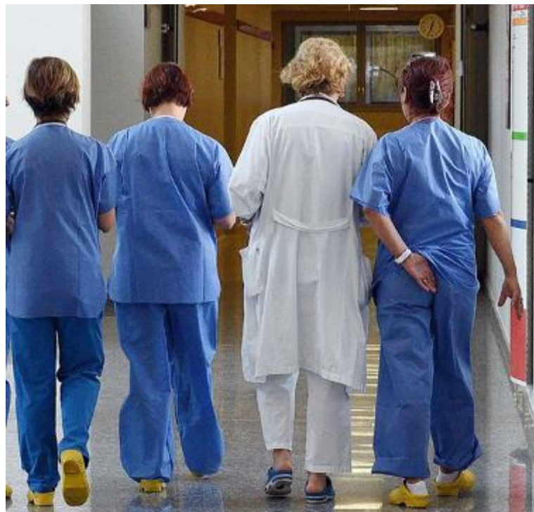
Personale medico e infermieristico nella corsia di un reparto (foto di repertorio)

Un comportamento che è valso alla donna anche l'indebita percezione delle indennità e dei contributi erogati da Asl5 e conseguenti al riconoscimento del beneficio da parte della stessa azienda sanitaria, quantificati dalla Procura in 13.168,45 euro. Per la donna, non solo l'accusa di truffa, ma anche di falso, per-