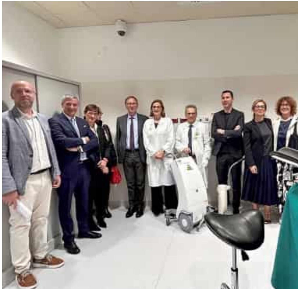
Il momento della consegna del macchinario donato da Fondazione Carispezia