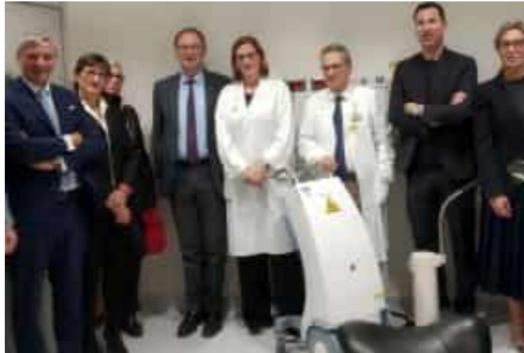
La presentazione dell'apparecchio per la brachiterapia donato da Fondazione Carispezia alla Struttura complessa di radiologia dell'Asl 5 spezzina

La struttura complessa di radioterapia del dipartimento oncologico della Spezia può contare su un apparecchio importante: una macchina per la brachiterapia, particolare branca della radioterapia che permette di porre la sorgente radioattiva a diretto contatto con il tumore da trattare, esponendo alle radiazioni solo le zone affette e risparmiando così i tessuti sani circostanti. 'Flexitron HDR' (della ditta Elekta) è la donazione di Fondazione Carispezia all'Asl 5, che aggiorna il vecchio sistema 'Microselecction HDR V2' e «completa l'aspetto qualitativo del reparto - quello diretto dal professor Tindaro Scolaro - e la tipologia del trattamento offerto». La macchina utilizza lo stesso tipo di sorgente radioattiva già in uso, l'iridio 192, ma ha migliore accuratezza che garantisce una maggior sicurezza per i pazienti: la sorgente radioattiva è infatti veicolata all'interno di organi cavi per il tempo necessario a erogare la dose di radiazioni ritenuta