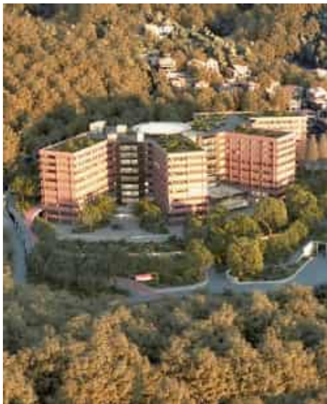
Il progetto dell'ospedale del Felettino

Tuttavia i tempi di verifica di Rina Check si sono allungati in modo inaspettato, con ripetute richieste di integrazione delle carte progettuali. Ad agosto, in quella sola comunicazione, la Guerrato ha fatto presente che «la complessità dell'opera» esige tempo. E ha spiegato di aver prodotto «oltre 2 mila elaborati, 350 mila oggetti tridimensionali, 3,6 milioni di valori sulla modellistica progettuale». Ancora, ha sottolineato «i numerosi in-