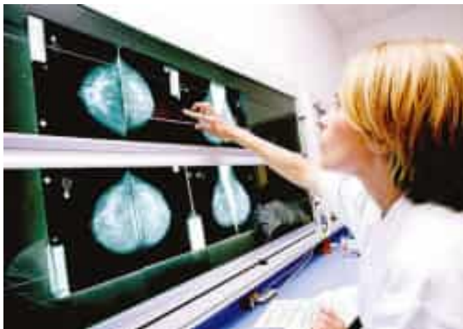
Un medico osserva l'esito di una mammografia

La Breast unit del Levante Ligure, sezione di Asl5 effettua mercoledì 23 ottobre presso il Centro di coordinamento della Breast unit in via XXIV Maggio, 139 alla Spezia, negli ambulatori di chirurgia senologica (IV piano) visite senologiche gratuite dedicate all'autopalpazione e all'importanza della