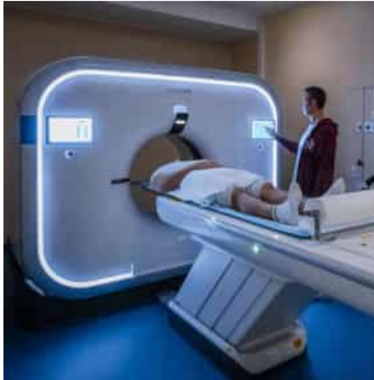
La prima struttura a essere interessata dal progetto di recall automatico delle prenotazioni avviato da Asl5 sarà quella di Medicina nucleare (foto di repertorio)

Il primo approccio, sperimentale, riguarderà la struttura complessa di Medicina nucleare, laddove la mancata esecuzione degli esami diagnostici da parte di chi prenota le prestazioni senza poi fruirne può causare non solo l'allungamento delle liste d'attesa, ma anche lo spreco di costose sostanze utilizzate come mezzi di contrasto che, una volta preparate e non utilizzate, devono essere necessariamente smaltite. Poi, se la risposta sarà soddisfacente, non è escluso che il sistema possa essere esteso a tutto il Dipartimento dei Servizi. Asl5 vara il progetto di recall automatico delle prestazioni sanitarie, con l'invio ai pazienti di promemoria per appuntamenti legati alle prestazioni ambulatoriali, che potranno avvenire tramite messaggi vocali e sms. Un sistema, quello di avvisare i cittadini nell'imminenza della data in cui devono soste-