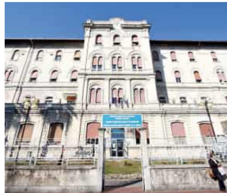
Il vaccino può essere somministrato dai medici di famiglia e in ospedale