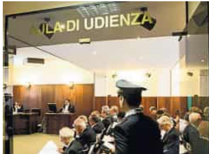
La Procura contabile ha presentato ricorso alle Sezioni Riunite

Per i pm contabili, la legge regionale del 2006 che prevede l'uso di questa fonte di finanziamento per l'attività dell'agenzia è incostituzionale. Perché quei milioni non andrebbero a sostenere i livelli essenziali di assistenza (Lea). Cioè quelle prestazioni che il Sistema sanitario nazionale deve offrire ai cittadini gratuitamente o tramite il pagamento del ticket. La Procura regionale lo ha ribadito a luglio, chiedendo alla sezione controllo della Corte dei Conti ligure di non avallare il bilancio della