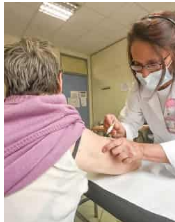
L'influenza è arrivata anche in Liguria: isolati tre ceppi