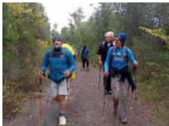
Il gruppo degli escursionisti a Ponzano e un momento della camminata con il Pellegrino della salute