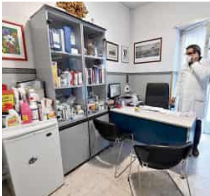
Un ambulatorio medico

Nell'ambulatorio gestito da Asl5, prestano servizio i medici di medicina generale e i medici di continuità assistenziale affiancati dagli Infermieri di famiglia e comunità. I cittadini che devono recarsi in ambulatorio possono farlo dopo aver acquisito dal proprio medico precedente la documentazione sanitaria personale. Il progetto è nato per rispondere alla carenza di medici di famiglia conseguente al pensionamento di alcuni professionisti e offrire un supporto ai residenti in attesa dell'assegnazione di nuo-