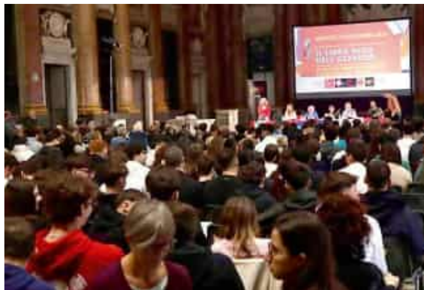
Sopra, da sinistra: la presentazione del Libro nero dell'azzardo durante l'incontro organizzato a Palazzo Ducale ieri mattina dalla Camera del Lavoro di Genova e da Federconsumatori e un giocatore d'azzardo online dinanzi al proprio schermo