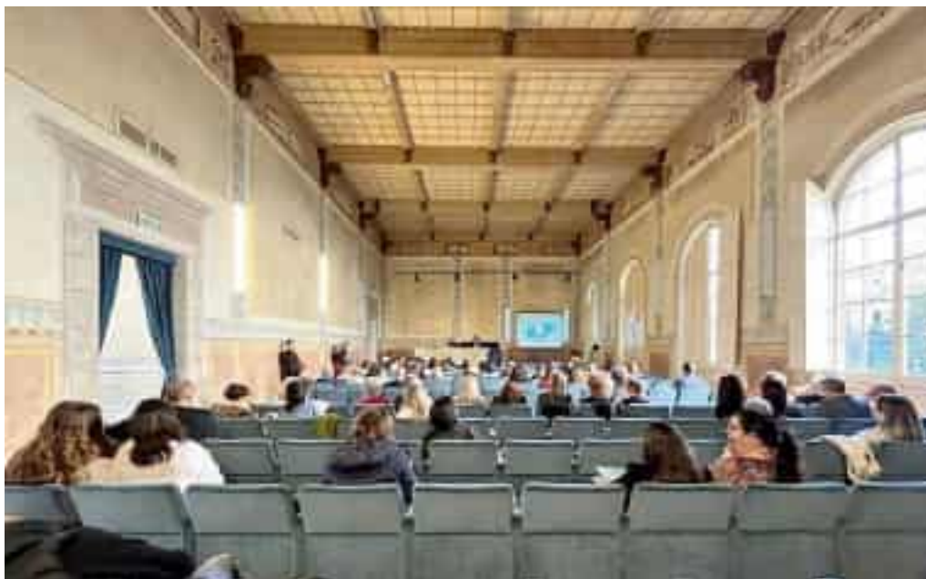
Il convegno che si è svolto giovedì nella Sala Dante di via Ugo Bassi

Quello della demenza è un argomento che coinvolge tutti, dagli amministratori ai cittadini passando per i professionisti della salute: «Spesso non riusciamo ad aiutare tutti- ha detto il sindaco in apertura del convegno- Su questo dobbiamo riflettere, perché questo problema va affrontato necessariamente con una rete di sostegno fornita dalle istituzioni. La nostra città è aperta a forme di sperimentazione che come Aip riter-