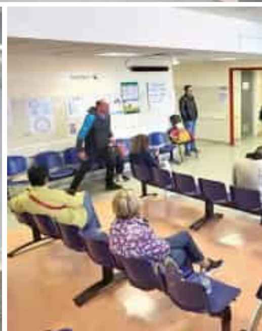
Dall'alto in senso orario: un intervento alla cataratta nella sala operatoria ristrutturata all'ospedale San Bartolomeo di Sarzana; sotto la sala d'attesa del Pronto soccorso; una nuova lampada nella sala operatoria del nosocomio della Val di Magra