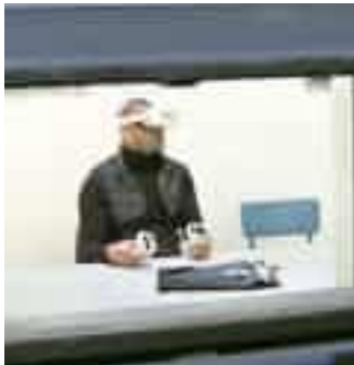
In carcere visite col visore

L'evoluzione della telemedicina, in carcere a Chiavari, sarà nel metaverso. Dove detenuti e dottori, muniti di visore Vr (come quelli utilizzati da piattaforme di gioco), potranno incontrarsi e interagire, sottoporsi a sedute o visite specialistiche. Sarà presentata nei prossimi giorni al Forum Sistema Salute di Firenze la nuo-