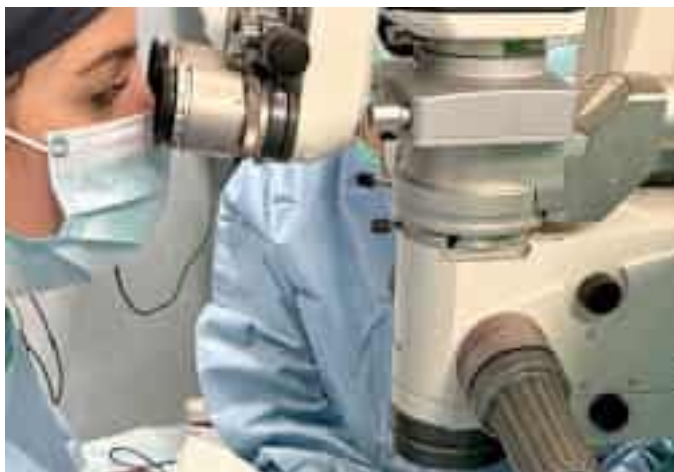
Una specializzanda di Catania nel reparto di Sarzana