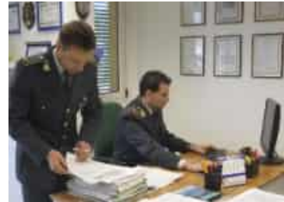
Gli investigatori della Guardia di Finanza impegnati nelle attività di indagine (foto d'archivio)