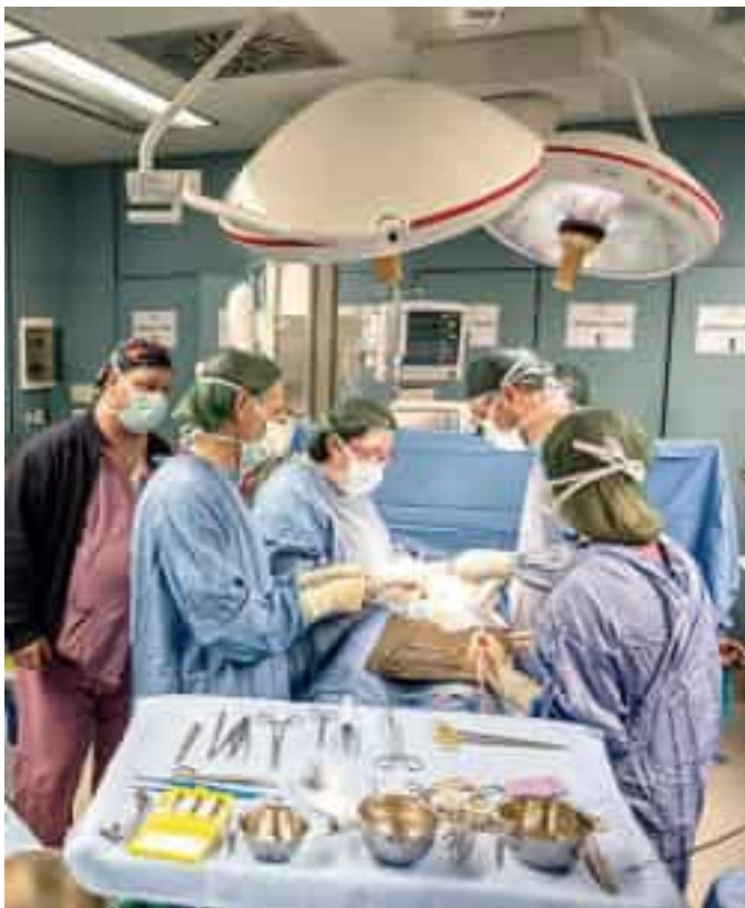
La sanità ligure deve rimettere i conti a posto

to dei conti 2024» . Bucci giungerà in Regione la mattina di martedì 26 quando si insedierà il Consiglio regionale e vengono votati il presidente, il vicepresidente e il segretario.