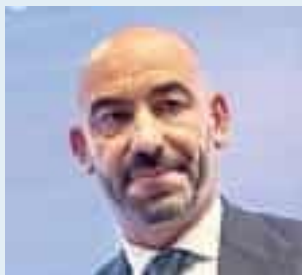
MATTEO BASSETTI INFETTIVOLOGO

Le liste di attesa? C'è anche il problema dell'appropriatezza delle prescrizioni spesso inutili