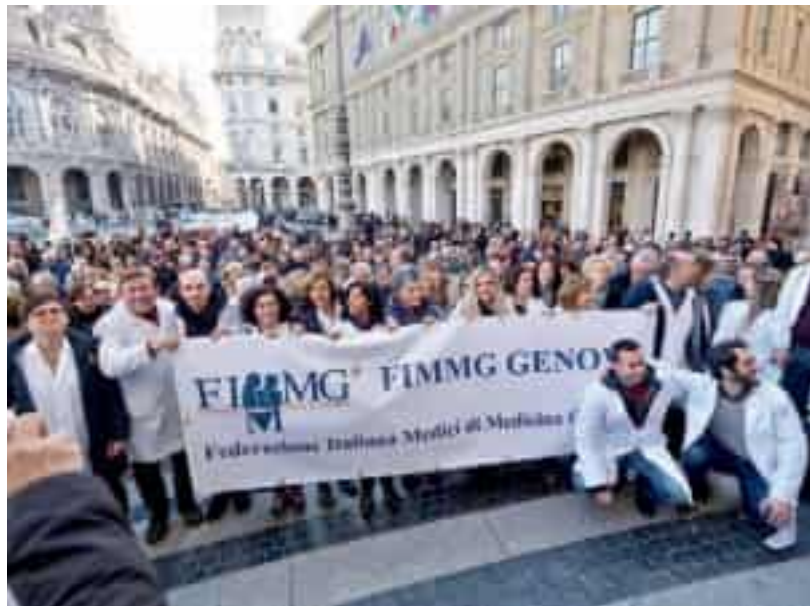
Camici bianchi in piazza a De Ferrari