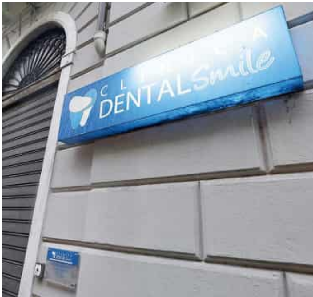
L’insegna della clinica Dental Smile e la serranda abbassata

Ancora: «A tal riguardo – prosegue la nota della curatela – poiché il suo nominativo risulta inserito nell’elenco dei clienti della società alla data della dichiarazione