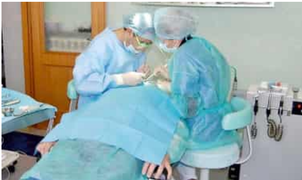
Un dentista al lavoro

Google (su Internet) invece indica la dicitura «chiuso definitivamente», ma sul sito ufficiale della clinica e sulle pagine social non è pubblicata nessuna avvisaglia rispetto ad una cessazione dell'attività specialistica. Altra stranezza: la linea fissa del telefono è ancora attiva, anzi le linee perché su Facebook ne risulta una diversa, ma componendo