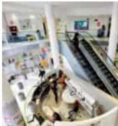
▲ L'ospedale L'istituto Gaslini, al centro della causa

La donna ha vinto la causa con Gaslini e San Martino, che hanno fatto ricorso E intanto il suo presente è insostenibile