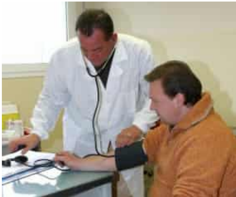
Nello Spezzino i medici di famiglia sono sempre di meno (foto d'archivio)

Grazie alla disponibilità dei medici di base, tante situazioni sono state tamponate, «come quella di Santo Stefano Magra, dove i colleghi hanno saputo sopperire all'assenza. Stessa cosa a Castelnuovo Magra» ricor-