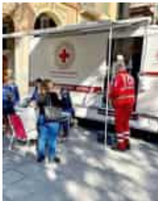
Un camper della Croce Rossa

Il bilancio conclusivo del tour sanitario organizzato