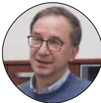
Paolo Cavagnaro Direttore generale Asl5

La delibera firmata dal direttore generale di Asl5 consente a undici medici di base (cinque di Sarzana, due di Castelnuovo Magra, uno di Arcola, Borghetto Vara, Brugnato e Santo Stefano Magra) di incrementare il massimale di scelte fino a 1800 pazienti, così da sopperire alle cessazioni dal servizio