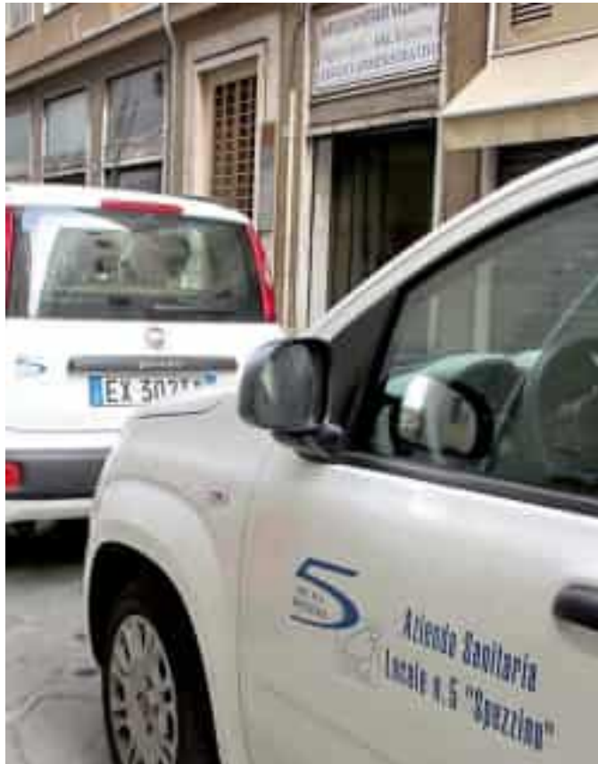
L'ingresso della sede Asl in via Fazio

Il concorso di Asl5, scaduto il 5 dicembre scorso , prevede ora che i candidati che risulteranno ufficialmente ammessi nel rispetto dei requisiti previsti dal bando e che hanno presentato tutta la regolare documentazione, possano affrontare un test di preselezione, possibilità prevista dal bando e che sembra realistica dato l'alto numero dei candi-