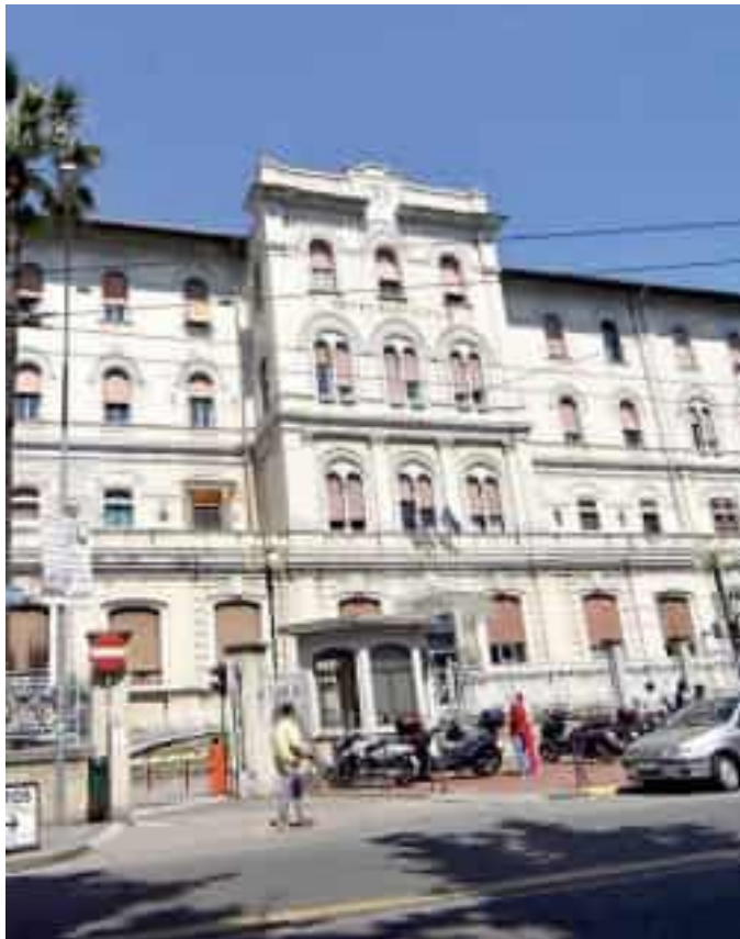
L'ospedale Sant'Andrea in centro città