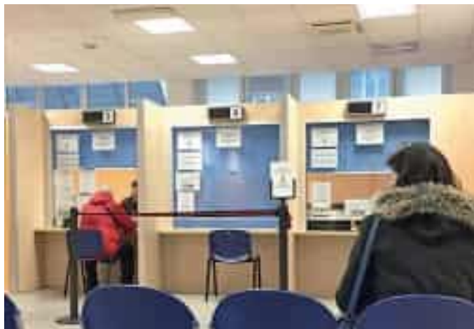
Un Centro Unico di Prenotazione di visite e analisi dell'Asl

All'interno ci sono i dati del titolare registrati nell'Anagrafe sanitaria regionale e documenti medici , come esami e referti, amministrativi e prescrizioni farmaceutiche. È disponibile in ogni momento su Internet, ma essendo strettamente personale, i è consultabile solo attraverso l'utilizzo di credenziali in forma protetta e riservata. La facile reperibilità ne permette