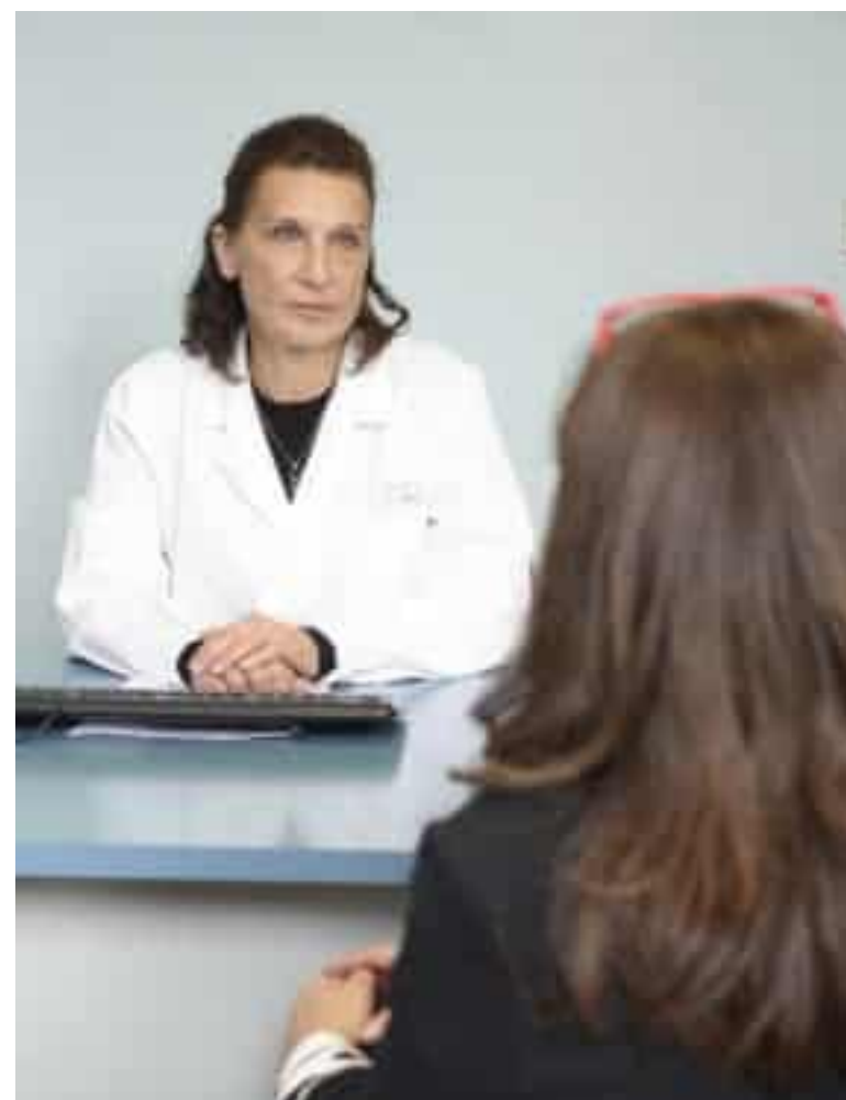
Asl5 ha permesso a undici medici di aumentare la soglia di assistiti

La delibera firmata dal direttore generale di Asl5 consente a undici medici di base (cinque di Sarzana, due di Castelnuovo Magra, uno di Arcola, Borghetto Vara, Brugnato e Santo Stefano Magra) di incrementare il massimale di scelte fino a 1800 pazienti, così da sopperire alle cessazioni dal servizio