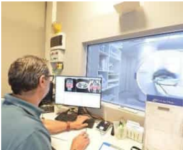
Tempi lunghi per ottenere una prestazione specialistica (foto d'archivio)