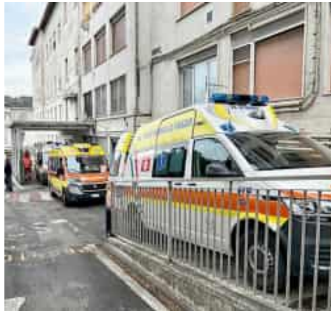
L'ingresso al Pronto soccorso con le ambulanze in attesa