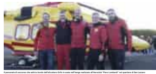
Il personale di soccorso che salirà a bordo dell'elicottero Grifo in sosta nell'hangar realizzato all'Aeroclub "Piero Lombardi" nel quartiere di San Lazzaro

Il comitato della Croce Rossa della Spezia riceverà circa 24 mila euro da Regione Liguria come contributo per il rifornimento delle ambulanze, grazie ai fondi residui del "bonus carburante", lo strumento da 2,2 milioni di euro con cui la Regione ha riconosciuto un indennizzo ai 4.331 nuclei familiari residenti nel paese dell'insediamento di Panigaglia. I 74 mila euro residui del fondo verranno ripartiti alle associazioni che svolgono i servizi sanitari in ambulanza nel Comune di Portovenere e nella Circoscrizione I del Comune della Spezia, tra cui appunto la sede centrale della Croce Rossa spezzina e quella di Ricazzo.