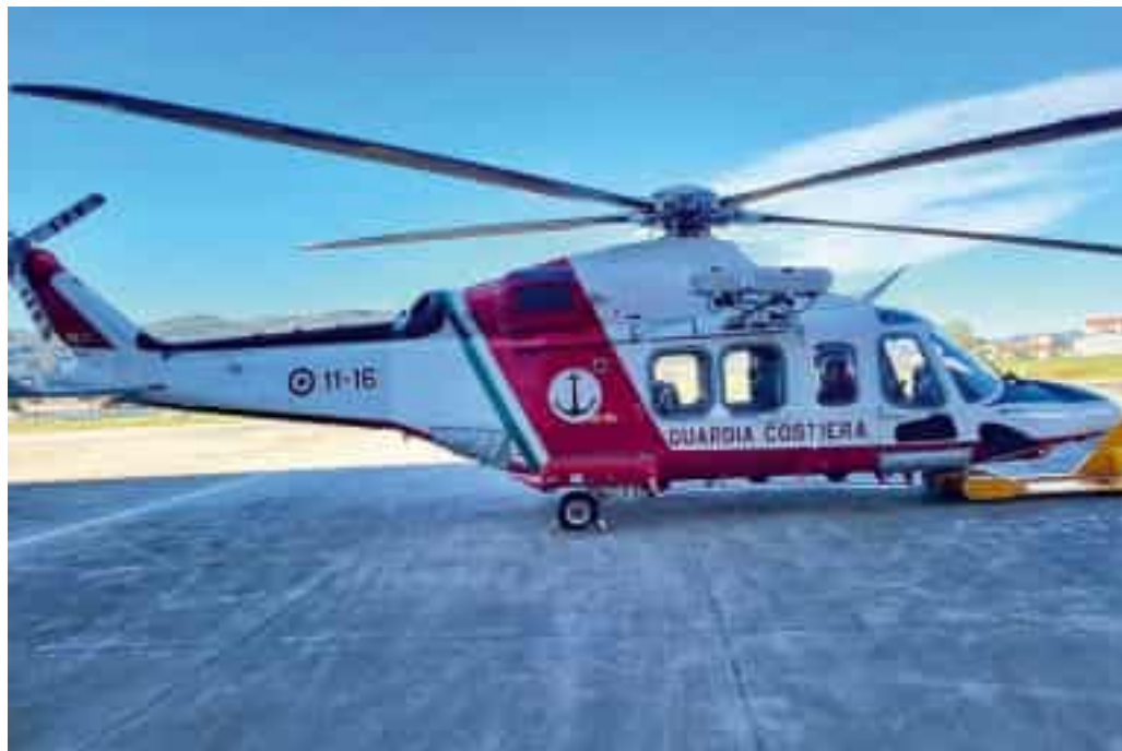
Un elicottero della Guardia costiera

Nella stessa occasione erano state fissate nero su bianco come per l'attività svolta, Regione corrisponderà al Corpo nazionale del Soccorso Alpino ligure un contributo pari a 770 mila euro per la gestione organizzativa, per l'effettuazione del servizio (più altre ci-