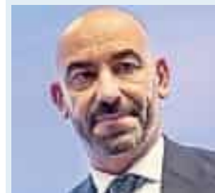
MATTEO BASSETTI INFETTIVOLOGO E PORTAVOCE CONSIGLIO SUPERIORE SANITÀ LIGURE

L'influenza colpisce tutti e può fare da apripista per infezioni più gravi, tutti dovrebbero vaccinarsi