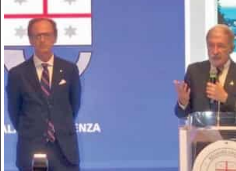
▲ La coppia al comando L'assessore regionale alla Sanità Massimo Nicolò con il presidente Marco Bucci

Tutte voci di finanziamento, cambio previsione o risparmio risorse per le quali, secondo la giunta, la previsione del disavanzo di gestione per l'anno 2024 si è attestato «ben più in basso di quanto fatto emergere in questi mesi». Circa 66 milioni, in virtù dei quali sarebbe «scongiurato» il commissariamento, che con le «consuete operazioni di chiusura dell'esercizio: la valorizzazione delle rimanenze, la rivalutazione delle partite debitorie, la quantificazione dei fondi rischi e oneri», e prossime «azioni di efficientamento del servizio sanitario pubblico e conseguente risparmio a parità di prestazioni rese, che generate dalle misure introdotte nel corso del 2024 e continueranno a generare effetti positivi nel 2025» - si legge nella nota regionale - scenderebbe a 49 milioni. «I risparmi si fanno con la produttività e tutti i manager