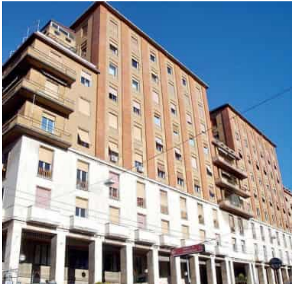
La sede della direzione generale dell'Asl 5 della Spezia a palazzo Doria, nel centro storico della Spezia