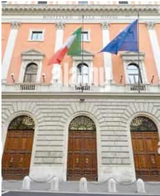
Il ministero della Difesa chiamato in causa dall'ex militare

Si parla ancora una volta di mesotelioma pleurico, un cancro che aggredisce i polmoni. È una patologia che deriva esclusivamente dall'amianto. Il mesotelioma è di fatto incurabile. Il militare aveva prestato servizio in Marina dal 18 gennaio del 1966 al 30 gennaio del 2000. Era entrato come allievo motorista navale, diventando poi sottocapo, ser-