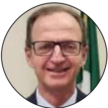
Massimo Nicolò Assessore regionale alla Sanità

«Recentemente c'è stato un incontro con i rappresentanti di Difesa, Aeronautica militare, Marina militare, Capitaneria di porto. Ho convocato una riunione con il ministero della Difesa per andare a valutare la definizione precisa di un'area adeguata, logisticamente utile per tutti»