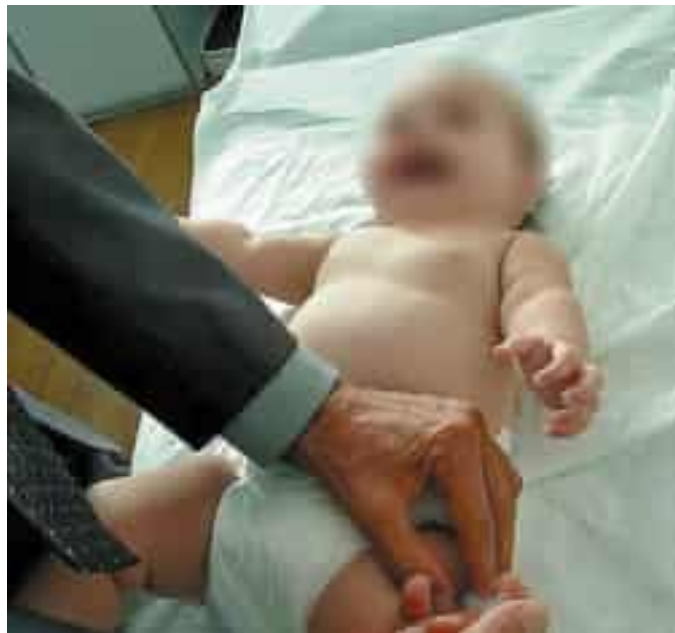
Neonato durante il vaccino

Il virus respiratorio sinciziale è un virus che può determinare gravi infezioni delle vie respiratorie, tra cui polmonite e bronchiolite; può presentarsi a tutte le età, ma è molto più grave nei bambini sotto l'anno di vita. La tra-