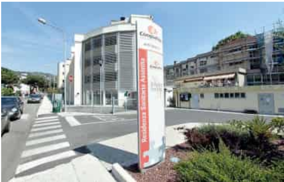
La residenza sanitaria della Spezia gestita da Coopselios

I sindacati dichiarano lo stato di agitazione del personale