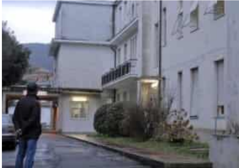
L'ospedale San Nicolò di Levanto (foto d'archivio)