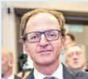
MASSIMO NICOLÒ ASSESSORE ALLA SALUTE REGIONE LIGURIA

Bisogna intervenire al più presto e non dovete porre resistenza al progetto di ridurre le liste d'attesa