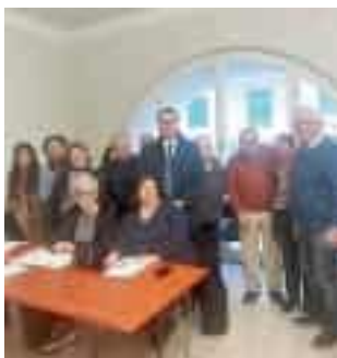
I volontari Avo con Guerri

Al nuovo corso, partito nelle scorse settimane, hanno aderito cinque nuovi volontari, ma in passato l'associazione spezzina è arrivata a contare anche 180 volonta-