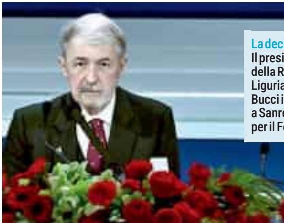
La decisione Il presidente della Regione Liguria Marco Bucci ieri a Sanremo per il Festival

tore: «Non serve agire a livello regionale, sul fine vita serve una legge nazionale. Non penso sia compito delle regioni fare leggi di questo tipo, altrimenti avremmo leggi diverse in ogni territorio d'Italia», ha detto il presidente, «La Corte costituzionale - ha proseguito Bucci - ha invitato il Parlamento a fare una legge su questo tema, quindi che si muovano, così risolviamo il problema. I sindaci e i governatori non possono fare ciò che vogliono, devono attenersi alle leggi. Quando ero sindaco di Genova mi chiedevano spesso di registrare i figli delle coppie omosessuali , cosa che in Italia è proibita. Personalmente l'avrei anche fatto, ma non si fanno cose illegali». Una analogia che