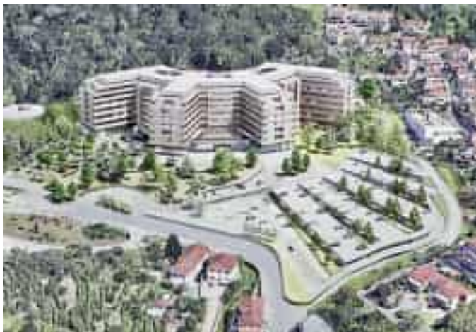
Il rendering del nuovo ospedale

In totale il Cipess ha stanziato oltre ai 3,3 miliardi del riparto del fondo nazionale e ha anche dato il via libera alla programmazione prevista dall'accordo siglato un anno e mezzo fa, a valere sulle risorse del Fondo sviluppo e coesione (Fsc) pari ad oltre