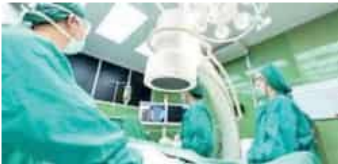
Una sala operatoria dell'Ospedale Sant'Andrea della Spezia

Fughe per un'operazione ma non solo: è in continua crescita anche la spesa per l'attività ambulatoriale, soprattutto la diagnostica dove in alcuni casi i tempi di attesa superano i dodici mesi per una Riso-