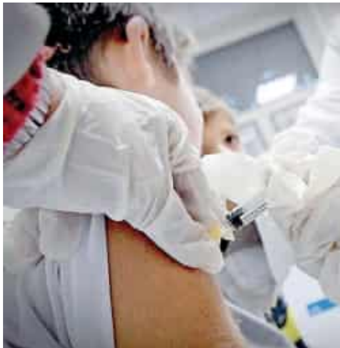
L'iniezione di un vaccino (repertorio)