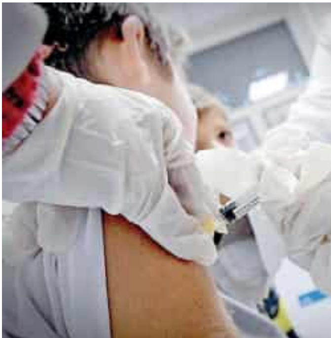
L'iniezione di un vaccino (repertorio)