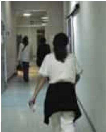
Il caso della Asl (foto d'archivio)

Una pediatra in servizio a Lucca all'Asl Toscana Nord Ovest è indagata dalla Procura di Lucca per truffa ai danni della stessa azienda sanitaria. Si tratta di un medico cinquantenne, originaria della Spezia che all'epoca dei fatti, nell'estate 2022, lavorava appunto nella città toscana. Secondo quanto contestato dagli inquirenti, la pediatra avrebbe usufruito di un permesso retribuito di quattro settimane dall'Asl per assistere il genitore disabile in base alla Legge 104, ma in realtà in quello stesso periodo si era messa a lavorare per conto di una cooperativa pediatrica in Piemonte. Il tutto senza prestare affatto le cure al genitore come previsto dalla normativa. I fatti contestati dall'inchiesta della Procura si riferiscono a un periodo a cavallo tra il mese di giugno e quello di luglio 2022. In quelle quattro settimane, la pediatra risulta infatti impegnata