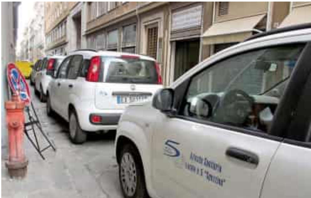
L'ingresso della sede di Asl5 in via Fazio

Il documento dell'azienda sanitaria locale