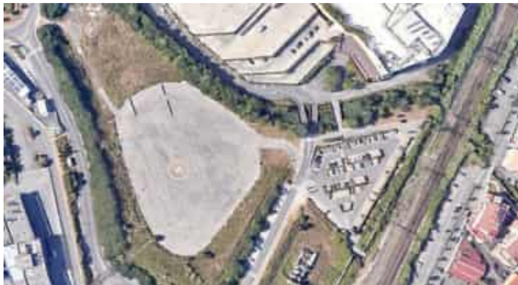
L'elicottero Pegaso che ha base al Cinquale di Massa Carrara. Sotto, una veduta dall'alto del piazzale occupato dai mezzi del Luna Park