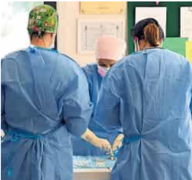
Sanitari al lavoro

In merito all'accertamento del grado di invalidità civile ha dichiarato il ricorso «inammissibile perché la controversia appartiene alla giurisdizione della Corte dei Conti, davanti alla quale la ri-