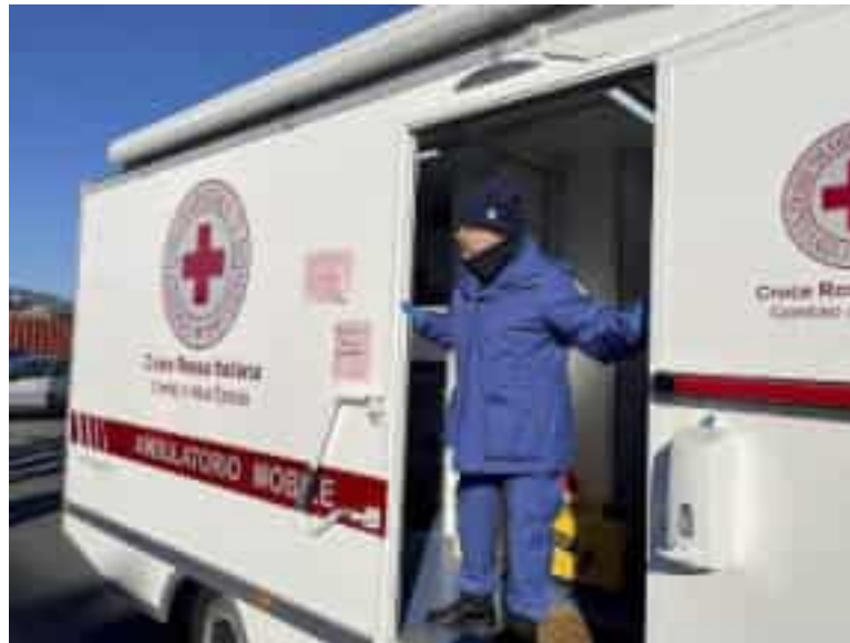
La Cri metterà a disposizione di Asl5 un ambulatorio mobile (foto di repertorio)