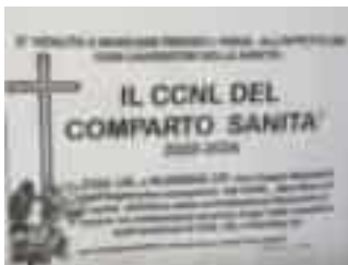
Il manifesto contro i sindacati

Nessuno al momento si è accorto di nulla, e così per tutto il resto della giornata. Ma immediata già dalla mattinata di ieri è stata la reazione di coloro che sono stati chiamati in causa. «Noi facciamo sindacato. Chi scrive certe cose squalifica le or-