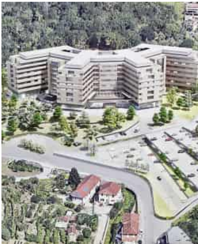
Il rendering del nuovo ospedale Felettino

«Il progetto esecutivo di un'opera deve essere corredata dal cronoprogramma, ma quando ho chiesto di prenderne visione, con un accesso agli atti, a gennaio, mi è stato risposto dalla direzione generale di Area salute e servizi sociali che il documento non era disponibile. Una grave mancanza, perché questo strumento è