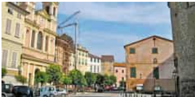
La piazza di Varese Ligure