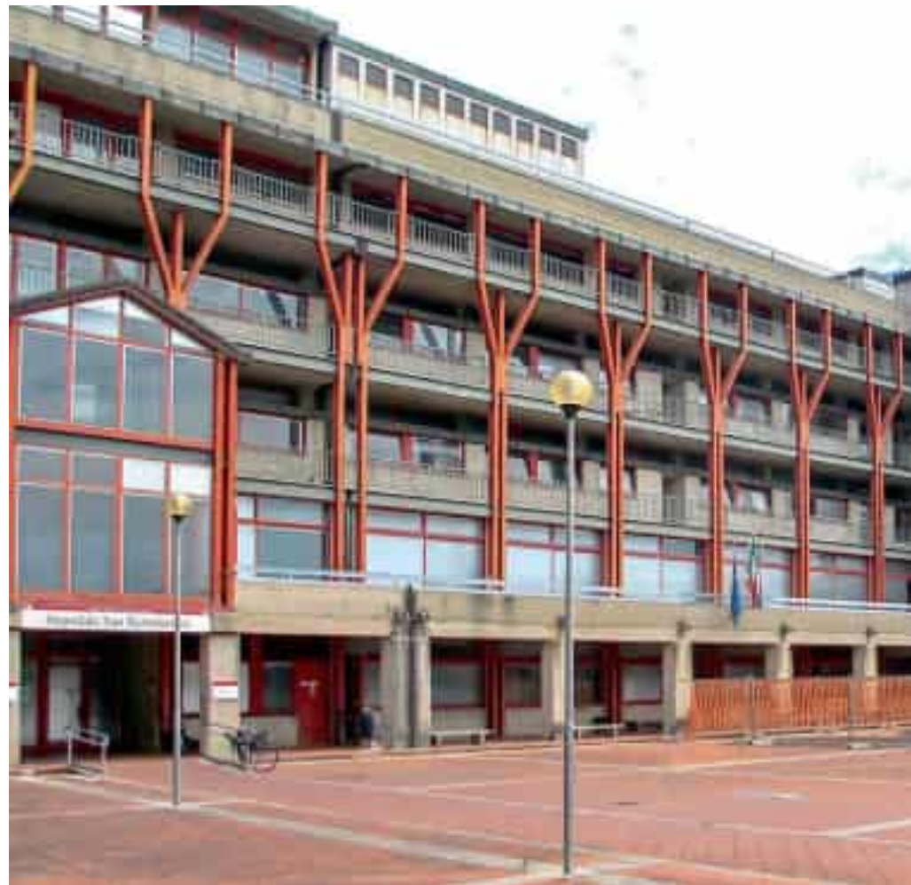
L'ingresso dell'ospedale San Bartolomeo di Sarzana