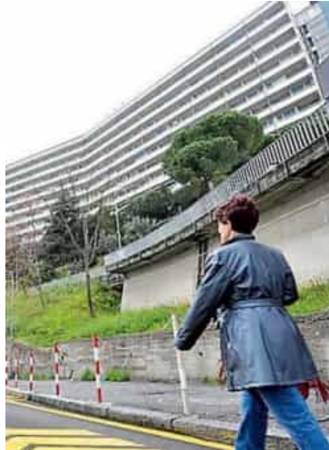
L'ingresso del policlinico San Martino di via Mosso a Genova

Secondo quanto ricostruito dalle volanti intervenute sul posto, l'operaio si era lanciato nel vuoto da un terra-