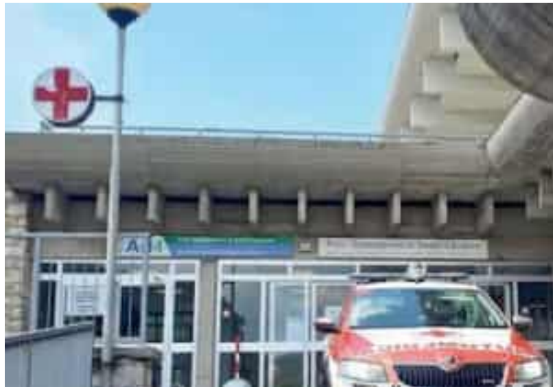
▲ La Asl Quattro È una delle aziende sanitarie che ha sperimentato il servizio. In Liguria è attivo a Sestri Levante, Levante e Millesimo

sarà estesa in altre zone della Liguria - spiega l’assessore alla Sanità Massimo Nicolò -. Si tratta di un segnale di grande attenzione soprattutto verso le aree interne della nostra regione, su cui stiamo focalizzando la nostra attenzione. Ricordo che questi mezzi non sostituiscono le auto mediche, che resteranno invariate, ma svolgeranno un ruolo di affiancamento che sarà utile a potenziare ancora di più la risposta. In questo mezzo di soccorso l’infermiere resta una figura opportunamente formata ed è sempre in collegamento col medico della centrale o, in altri casi, anche con il sanitario dell’automedica più vicina. L’utilità del mezzo infermierizzato permette anche di alleggerire il carico di interventi delle automediche, garantendone