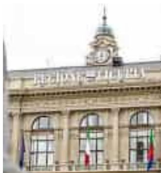
In alto: una visita oculistica; sopra, da sinistra: il centro unico di prenotazione della Fiumara e il palazzo della Regione, a De Ferrari

che ed esami e può avvenire via sms o con chiamata. Ma sinora non era mai stato accompagnato dalla minaccia del pagamento del ticket in caso di mancata presentazione. È chiaro che per rendere possibile questa sanzione si deve intervenire anche sui sistemi di prenotazione e rendere più semplice la possibilità di disdire l'appuntamento