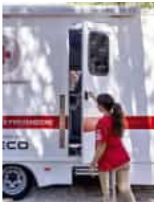
Croce Rossa e lo screening

Al via la seconda edizione di "Itinerari della salute", il progetto della Croce Rossa per aumentare la conoscenza delle malattie cardiovascolari. La prima tappa si svolgerà alla Spezia, domani, in piazza Beverini dalle 9 alle 13 e dalle 14 alle 19. Chi lo vorrà potrà richiedere uno screening gratuito con un cardiologo per la valutazione del proprio rischio cardiovascolare, ricevendo consigli per prevenire la comparsa