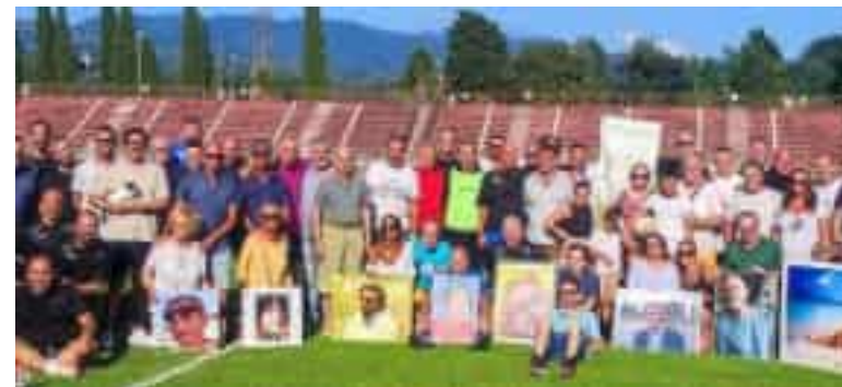
Il gruppo che ha partecipato all'edizione dello scorso anno