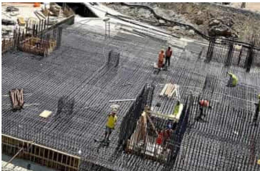
Ecco lo stato dei lavori nel cantiere allestito per la realizzazione dell'ospedale del Felettino