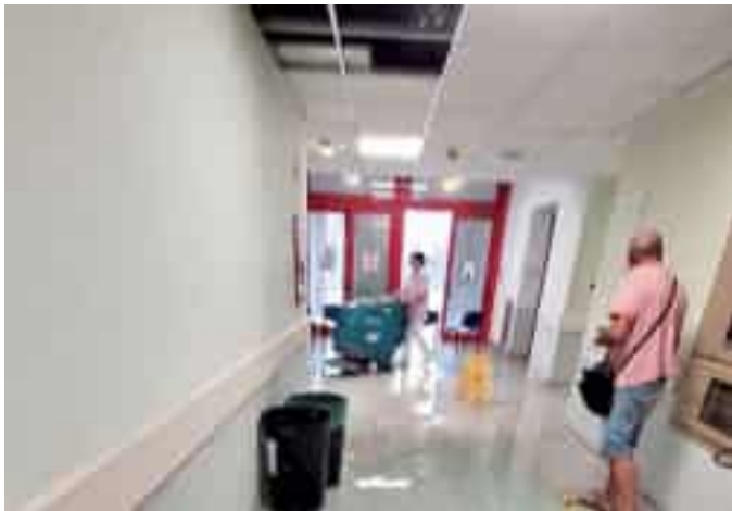
Situazione critica in un'area dell'ospedale di Sarzana

La direzione di Asl 5 ha fatto sapere che «si è verificata la rottura di un tubo dell'acqua fredda intorno alle 7.30 di ieri mattina. La gestione tecnica è intervenuta prontamente e il guasto alle 8.30 e dunque soltanto un'ora dopo era già stato riparato e l'acqua asciugata. Nessun disagio per pazienti e operatori,