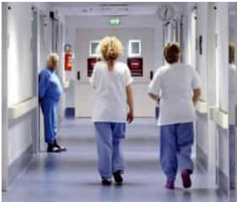
Due infermiere nella corsia dell'ospedale (foto di repertorio)

«I ricorrenti non danno la prova che disposizioni aziendali o esigenze ineludibili del servizio impongano loro di effettuare la vestizione e svestizione fuori dell'arco temporale che costituisce il loro debito orario, siano essi diurnisti o turnisti. Non è quindi integrato il presupposto per poter ritenere che i ricorrenti abbiano maturato il diritto alla percezione di un compenso aggiuntivo per una quota di minuti ulteriore rispetto all'orario di servizio». Con questa motivazione il giudice del tribunale civile Giampiero Panico ha rigettato il ricorso collettivo presentato da 191 infermieri di Asl5 - diurnisti e turnisti presenti negli ospedali e nelle strutture sanitarie della provincia - che avevano chiesto il riconoscimento economico legato al cosiddetto "tempo tuta", ovvero le operazioni di vestizione e svestizione di inizio e fine turno. Una battaglia iniziata nell'autunno del 2023, con la richiesta al tribunale cittadino di accertare e dichiarare il diritto a vedersi incluso nell'orario di la-