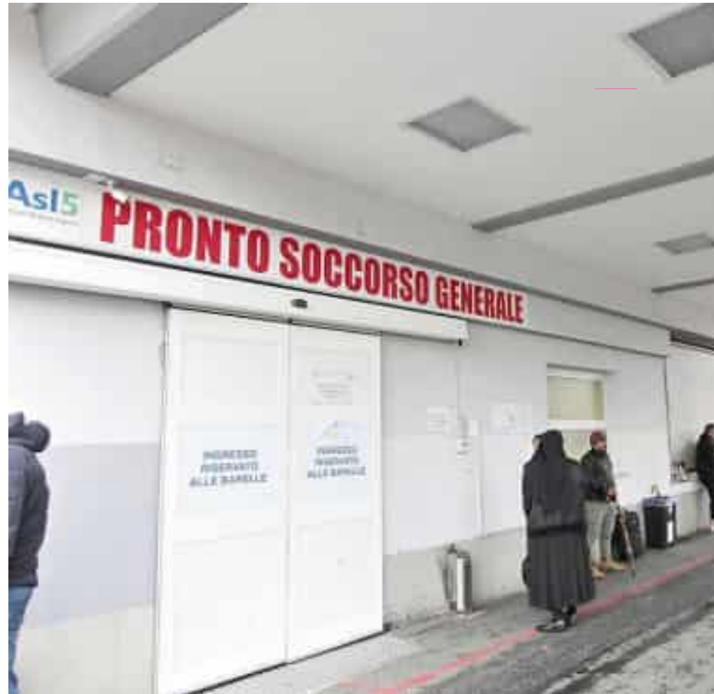
L'entrata del Pronto Soccorso dell'ospedale della Spezia Sant'Andrea