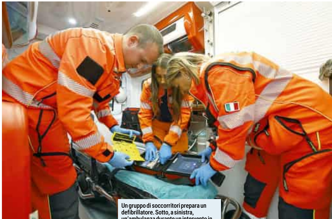
Un gruppo di soccorritori prepara un defibrillatore. Sotto, a sinistra, un'ambulanza durante un intervento in passeggiata Morin e uno dei dispositivi salvavita collocati in città