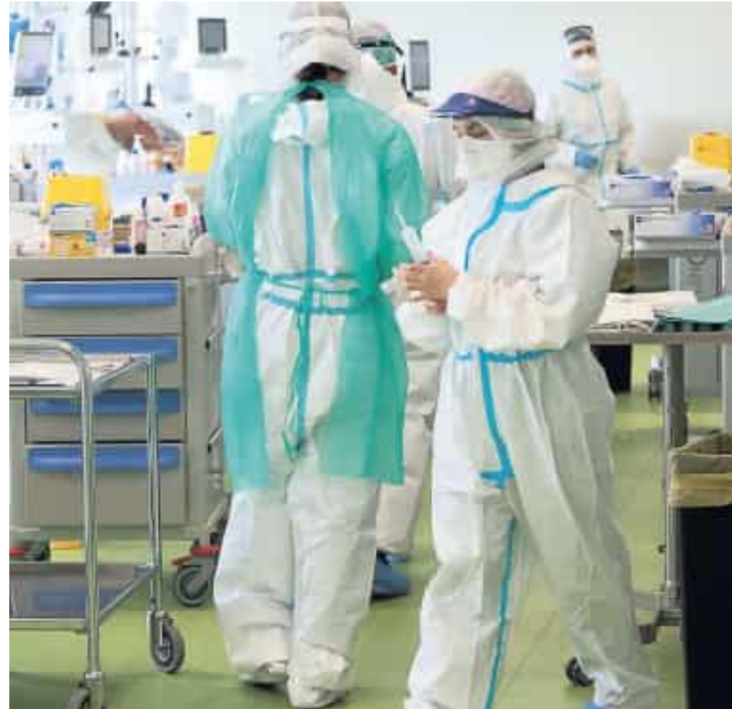
Il concorso pubblico di Asl5 per infermieri rischia di svuotare del personale le strutture private

È il numero complessivo degli infermieri ad essere insufficiente e chiaramente «non possono moltiplicarsi: che lavorino nel pubblico o nel privato, la coperta resta corta». Per invertire la rotta, quindi, servirebbe più di un bando e nemmeno si può sperare che siano le singole aziende sanitarie locali a risolvere i problemi: come l'Opi denuncia da tempo, servono investimenti strutturali, politiche di formazione e assunzione, e soprattutto un ripensamento dell'intero modello assistenziale. Altrimenti, anche la buona volontà rischia di trasformarsi in un boomerang.—