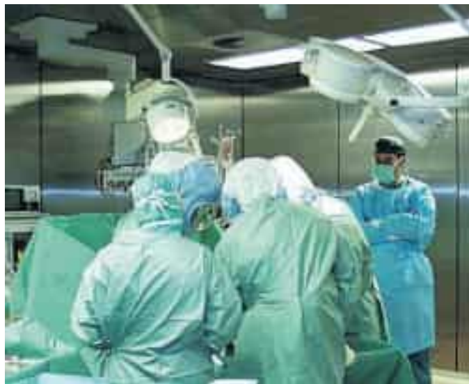
Un intervento chirurgico. La Corte dei Conti indaga sui contratti

carte di credito dell'ente. La Guardia di finanza si è già mossa: ha raccolto documenti sulle consulenze contestate e nelle prossime settimane acquisirà, negli uffici di Alisa, i contratti che sono stati stipulati negli ultimi tre anni: da quel poco che filtra sono almeno una quindicina le consulenze di dirigenti amministrativi e medici. Alcuni sono camici