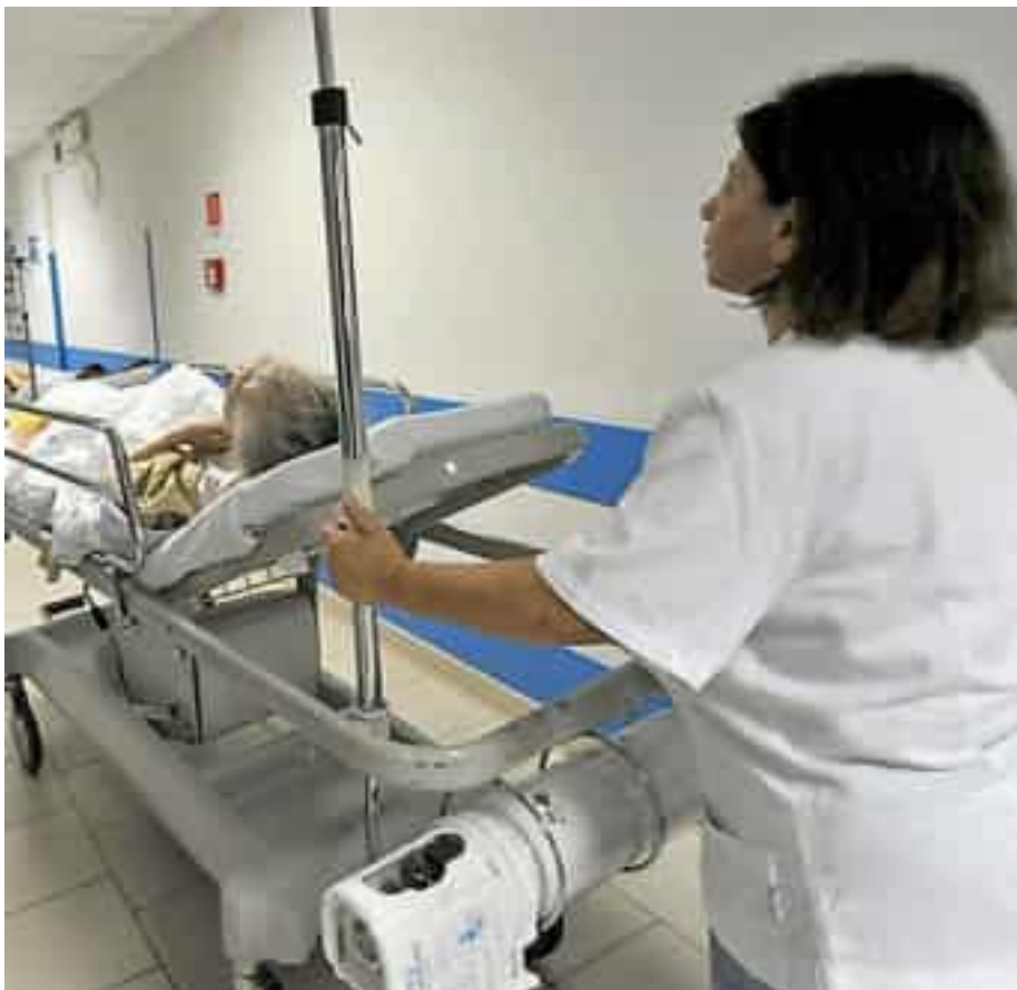
Un'operatrice del settore sanitario al lavoro in corsia