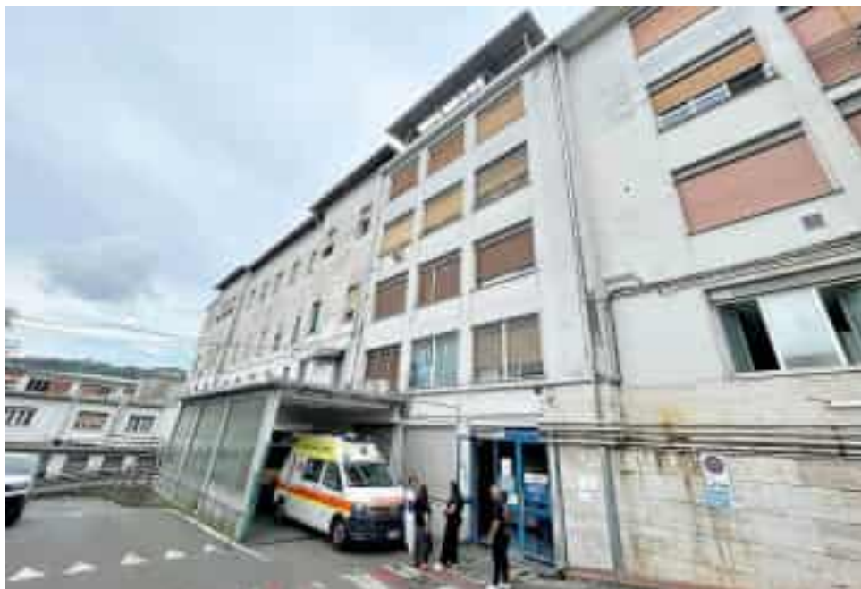
La struttura del Pronto soccorso del Sant'Andrea necessita di un restyling in attesa della realizzazione dell'ospedale del Felettino