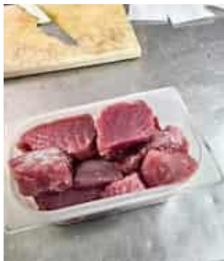
Tranci di tonno

Immediatamente, il servizio Asl 5 di Igiene della Produzione, Commercializzazione, Conservazione e Trasporto degli Alimenti di origine animale e loro derivati del Dipartimento di Prevenzione diretto da Mino Orlandi, con i suoi operatori si è recato nel locale nella stessa serata. E la prontezza dell'intervento ha permesso di rinvenire nel frigorifero l'alimento sospettato di aver causato il malore nei commensali. Le successive analisi di laboratorio, tuttora in corso, potrebbero fornire la prova della presenza nel pesce di istamina, che, se ingerita ad alta concentrazione, si manifesta rapidamente nel consumatore con bruciore delle fauci, forte lacrimazione, arrossamenti cutanei, mal di testa, disturbi gastrointestinali e palpitazioni. I sintomi, seppur di breve durata, possono causare reazioni si-