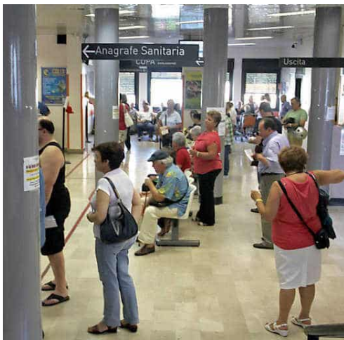
Code agli sportelli dell'Asl di Savona

Torna il balletto dei numeri sui conti della sanità ligure, forse in ritardo di qualche mese rispetto allo scorso anno. Le cifre si avvicinano a quelle di fine estate 2024: oltre 200 milioni di euro di disavanzo, più vicino al tetto dei 250 milioni, come proiezioni di fine anno anche se non contengono alcune entrate che potrebbero portare il rosso conclusivo della Liguria appena sotto i 200 milioni. Quello che, però, preoccupa gli uffici della Regione è il quadro generale e la situazione di alcune Asl che, secondo i conti economici inviati all'assessorato alla Sanità e al commercialista-consulente Santiago Vacca, hanno sfiorato nel budget e non hanno rispettato le indicazioni di contenere la spesa anche perché, come sottolinea un direttore generale che chiede di restare anonimo, «ci è stato chiesto di aumentare la produzione per ridurre le liste d'attesa e di conseguenza sono aumentati i costi tra