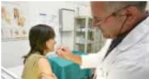
Un medico vaccina una paziente

logiche ci dicono che l'influenza colpirà duro, quest'autunno. Per questo abbiamo già dato forma a una task force: non vogliamo arrivare in ritardo». L'assessore regionale alla Sanità Massimo Nicolò spiega - al primo Congresso ligure della Medicina Generale - che fra gli obiettivi di queste settimane c'è quello di rifornire i medici di famiglia in modo tempestivo.