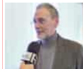
● Studenti specializzandi in Medicina e Chirurgia Foto sopra, Massimo Minerva presidente nazionale dell'Als

be anche il mancato riposo giornaliero, ovvero il mancato rispetto delle 11 ore consecutive di riposo post-turno, con impegni di lavoro che avrebbero portato gli specializzandi a fare il turno di mattina e poi la notte. Sembra emergere anche un superamento dei limiti settimanali: oltre le 48 ore medie, dieci più del previsto, le 38 ore indicate nel con-