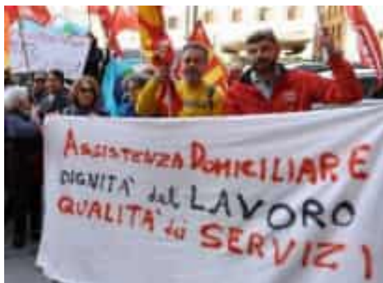
Un sit-in di operatori impegnati nel campo dell'assistenza domiciliare

«I tempi (da settembre a dicembre) con i quali Asl ha deciso e comunicato la propria scelta di non affidare nuovamente l'assistenza domiciliare e utilizzare dunque personale interno all'azienda per gestire il servizio, ci mettono di fronte a un film drammatico già visto e al rischio concreto di una ennesima bomba sociale sul territorio spezzino che mette a repentaglio 74 posti di lavoro tra infermieri, oss, fisioterapisti, logopedisti e amministrativi» denunciano le sigle sindacali. Il personale attualmente in servizio alla Elleuno non potrà essere assorbito dall'Asl in maniera diretta, ma solo tramite eventuale vittoria di concorso pubblico, aperto a tutti. «Dopo il caso Coopservice (facciamo presente che alcuni degli Oss coinvolti in quella vicenda non hanno ancora oggi un posto di lavoro stabile), l'Asl decide di nuovo di procedere con una internalizzazione fatta a danno di lavoratrici e lavoratori e lo fa con tempi e mo-