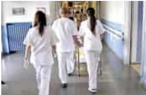
Operatori sanitari al lavoro in una corsia d'ospedale

«Siamo di fronte al rischio concreto di una ennesima bomba sociale sul territorio spezzino»: l'allarme di una nuova emergenza occupazionale è lanciato da Fp Cgil, Fisascat Cisl e Uil Fpl, che hanno proclamato lo stato di agitazione delle lavoratrici e dei lavoratori di Elleuno scs, cooperativa che da oltre dieci anni gestisce per conto di Asl5 il servizio di assistenza domiciliare integrata. In gioco ci sono 74 posti di lavoro,