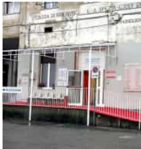
L'ingresso di Psichiatria nel complesso dell'ospedale Sant' Andrea