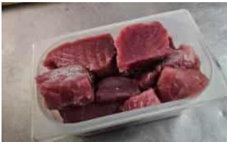
Il tonno sequestrato da Asl5 nel ristorante sarzanese

E così il servizio di igiene del Dipartimento di prevenzione di Asl 5 diretto da Mino Orlandi durante il weekend, è stato immediatamente allertato dai medici del pronto soccorso spezzino per i due casi di sospetta Sindrome Sgombroide. I controllori ufficiali del servizio veterinario si sono immediatamente presentati nel ristorante del centro storico sarzanese indicato dalle due persone. Per il locale è scattata la sospensione dell'attività e il proprietario è stato sanzionato