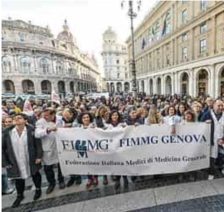
Una manifestazione dei medici di famiglia di fronte alla Regione

460 sono i medici di famiglia in servizio a Genova. In Liguria sono oltre mille