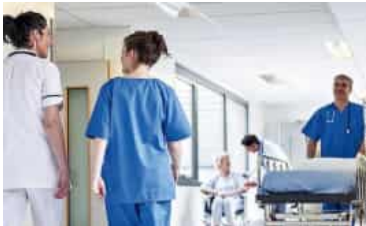
Operatori sanitari al lavoro in una corsia di ospedale

La sicurezza, sottolinea Asl5, non è responsabilità esclusiva dei professionisti, ma nasce dal coinvolgimento e dalla consapevolezza di tutta la comunità. Il progetto si collega alle esperienze già attive con il Gaslini Diffuso: tra queste, le visite congiunte tra pediatri e gastroenterologi per i