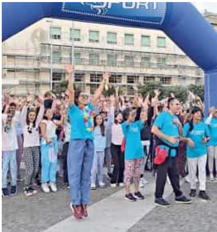
Il "Pigiama Run" in piazza Europa della scorsa edizione

La città si rimette il pigiama per una serata che unisce divertimento e solidarietà. Domani piazza Europa tornerà a colorarsi con la Pigiama Run, l'evento benefico promosso dalla Lilt (Lega italiana per la lotta contro i tumori) che coinvolgerà centinaia di partecipanti pronti a correre o camminare per sostenere i bambini malati di tumore. La manifestazione, organizzata in contemporanea in numerose città italiane, invita tutti a presentarsi in pigiama. Un outfit insolito per un evento carico di significato, con lo scopo di ricordare i piccoli pazienti che ogni giorno sono costretti a indossarlo durante le cure. Dopo l'esordio dello scorso anno, con oltre 400 iscritti e una raccolta di circa seimila euro destinata a