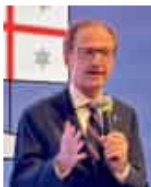
L'assessore alla Sanità Massimo Nicolò

La Regione Liguria dal 30 settembre nelle Aziende Sanitarie Locali 3 e 4 di Genova e Chiavari avvierà una sperimentazione per garantire ai cittadini in condizioni di disabilità un percorso unitario di cura e assistenza basato sui principi di autodeterminazione e inclusione, che consenta di superare le frammentazioni attuali e di rendere più accessibili e omogenei i servizi. Lo spiega l'assessore regionale alla Sanità Massimo Nicolò, illustrando le prime linee operative del "Progetto di vita". La sperimentazione introdurrà strumenti innovativi per la presa in carico e l'integrazione socio-sanitaria dei pazienti tra cui: la valutazione di base in capo all'Inps, il procedimento unitario e multidisciplinare volto ad accertare la condizione di disabilità e l'intensità dei sostegni necessari, una 'Centrale unica per la condizione di disabilità' individuata nella finanziaria Filse, che raccoglierà e farà una prima verifica delle domande pervenute tramite la sezione del suo sito denominata 'bandi online' e successivamente segnalerà al punto unico di accesso le domande pervenute per la presa in carico.