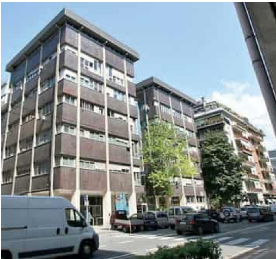
La sede di Asl 5 in via XXIV Maggio

L'azienda parla della «necessità di sopperire alla carenza di personale», un problema definito «cronico» e che rischia di compromettere la possibilità di «garantire all'utenza l'assistenza necessaria». Quattro nuove assunzioni riguardano i tecnici del-