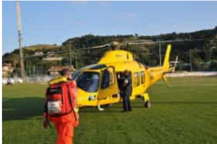
La base dell'elisoccorso del Levante Ligure, a Sarzana, è attesa ormai da anni

« Dopo anni di attesa la convenzione adesso è pronta e la concessione dell'area è gratuita »