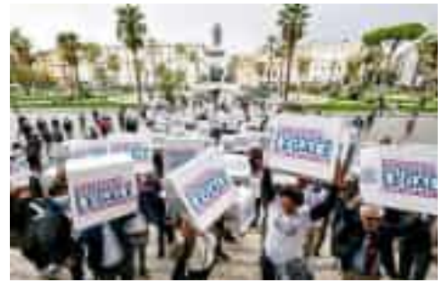
Roma, manifestanti pro-eutanasia dell'associazione Luca Coscioni

La proposta è stata rinviata in commissione in Emilia-Romagna, Veneto, Piemonte, Abruzzo, Lombardia, Friuli-Venezia Giulia, Alto Adige e Valle d'Aosta. Proposte similari nelle Marche e in Calabria, mentre in Basilicata dovrà essere nuovamente depositata. —