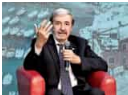
Il presidente della Regione Marco Bucci

Un tentativo di riunire le cinque Asl liguri in un'unica struttura, in qualche modo, era già stato pensato in quota Lega ai tempi del-