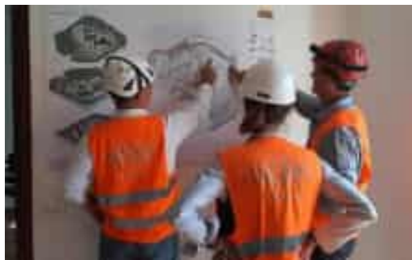
I tecnici di Sacaim, azienda che si occuperà della costruzione del fabbricato