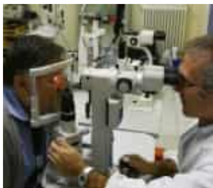
A sinistra, accertamenti medici con visita oculistica (foto di repertorio). A destra, un autobus di linea Atc viaggia lungo viale San Bartolomeo in direzione Lerici

Il 'Dm 88' altro non è che il decreto ministeriale 88 del febbraio 1999, un regolamento che ha introdotto l'obbligo di accertamenti sanitari periodici sull'idoneità psicofisica del personale addetto ai servizi di trasporto pubblico. Sono soggetti al 'Dm 88', per intenderci, ferrovieri e autisti di autobus urbani ed extraurbani, sia che lavorino alle dipendenze dirette delle aziende pubbliche o private incaricate dei servizi di trasporto di linea sia che operino in appalto per conto di cooperative. Ovviamente, i tempi di rinnovo variano a seconda dell'età, ma per i 70 dipendenti Atc in questione non ci sono dubbi: i loro certificati medici sono scaduti e non sono state ancora avviate le pratiche per il rinnovo. La notizia trapela attraverso uno stretto muro di riserbo, ma negli uffici di via Leopardi e in quelli di piazza Chiodo ha già iniziato a circolare e ieri mattina dalle segreterie Rsa è partita una lettera con formali richieste di chiarimento indirizzata al presidente di Atc Esercizio Franco Pomo, al direttore generale Massimo Bellavigna e al direttore tecnico Fabrizio Fantechi. A quanto pare alcu-