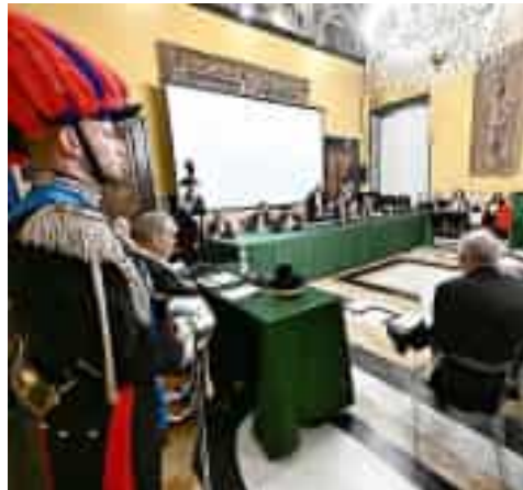
L'inaugurazione dell'anno giudiziario della Corte dei Conti