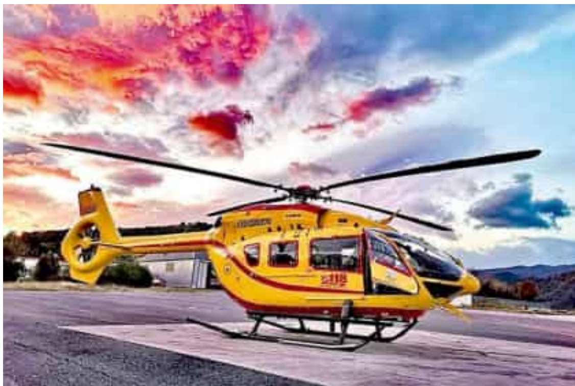
Un elicottero del soccorso pronto a decollare