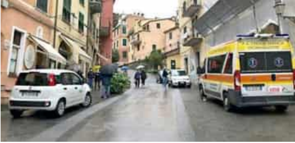
I mezzi della Croce Bianca davanti alla sede di via Colombo