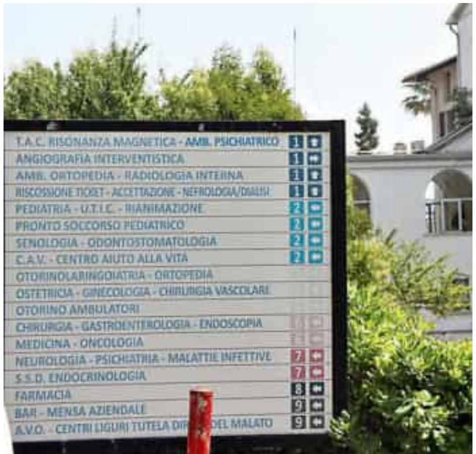
L'elenco dei padiglioni dell'ospedale Sant'Andrea

I professionisti saranno impegnati in circa 140 ore di lavoro aggiuntive fino a dicembre 2025, compatibilmente con i turni di lavoro previsti, per far fronte sia all'aumento della platea dei pazienti sia alla carenza di medici nel reparto di Senologia. La mi-