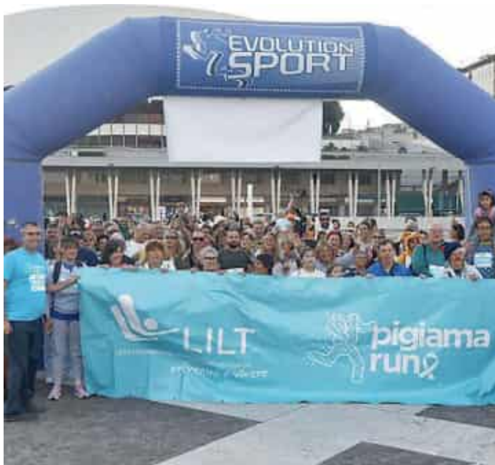
La partenza in piazza Europa della Pigiama Run