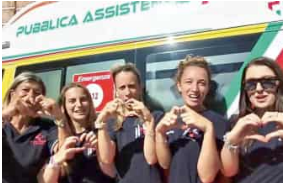
Alcune volontarie della Pubblica assistenza per la Giornata del cuore

Le malattie cardiovascolari rappresentano la prima causa di ospedalizzazione e di morte, nel mondo occidentale. Rappresentano quasi il 35%, una percentuale che supera quella dei tumori. Conoscere i fattori di rischio e mitigarli at-