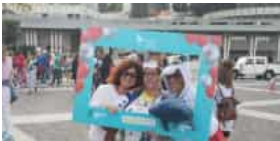
Le immagine della scorsa edizione della rassegna

Il conto alla rovescia è ormai nel vivo: l'allegria 'invasione' dei partecipanti è pronta a partire da piazza Europa. Torna con per la seconda volta alla Spezia la Pigiama Run, la corsa non competitiva che la Lilt, la Lega italiana per la lotta contro i tumori organizza venerdì 26 settembre in contemporanea in oltre 30 città per sostenere con una grande raccolta fondi piccoli malati oncologici. Basta iscriversi sul sito www.pigiamarun.it per essere solidali, vestiti in pigiama come i bambini ricoverati in corsia che stanno lottando contro il tumore. Nel 2024 la manifestazione ha fatto il suo debutto alla Spezia, con numeri da record: 400 partecipanti e 6mila euro raccolti, devoluti alla Fondazione Gaslini Insieme per un progetto di accoglienza di famiglie e bambini; quest'anno, invece, il ricavato andrà al progetto «Mi prendo cura» per il supporto psicologico ai piccoli malati e ai fa-