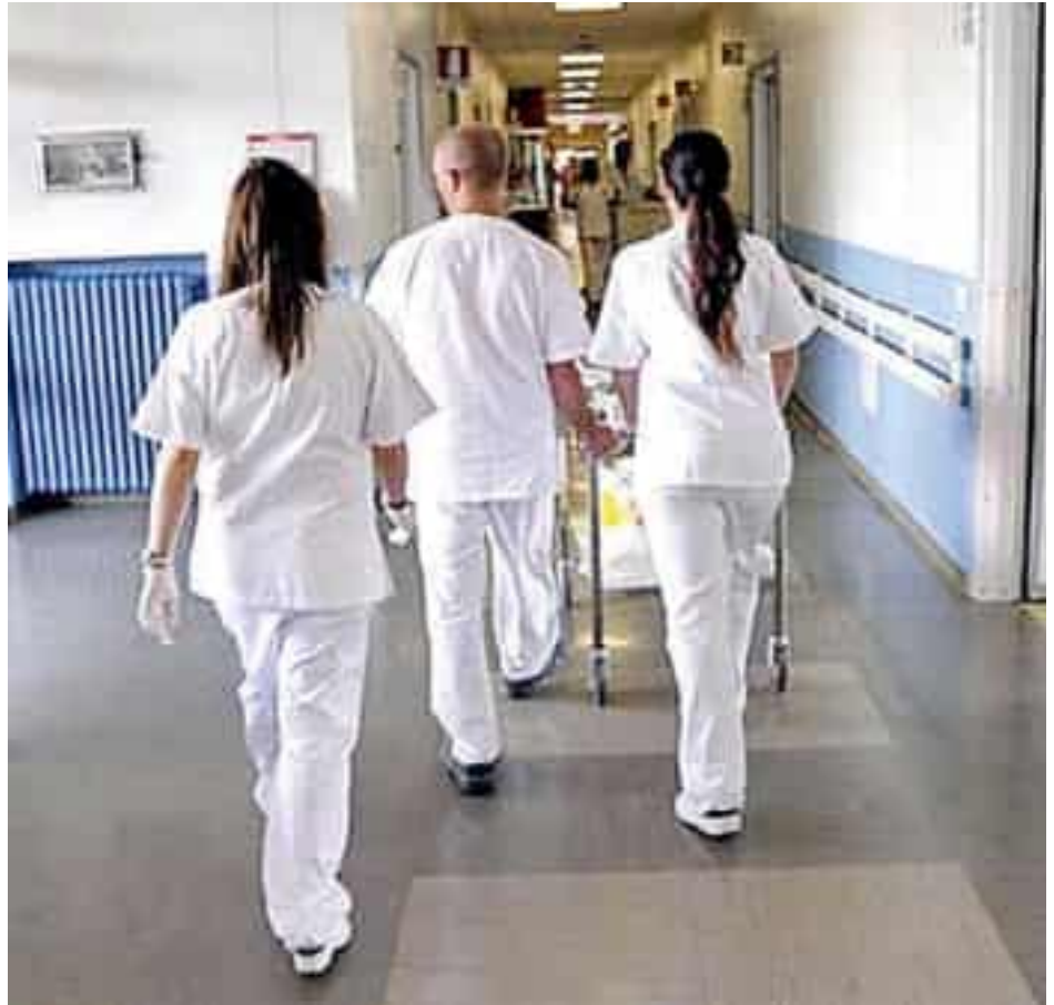
Operatori sanitari in una corsia d'ospedale

«Il primo punto è evitare che tutto ciò si traduca in un taglio di servizi, realizzando un risparmio sulla pelle dei lavoratori e dei cittadi-