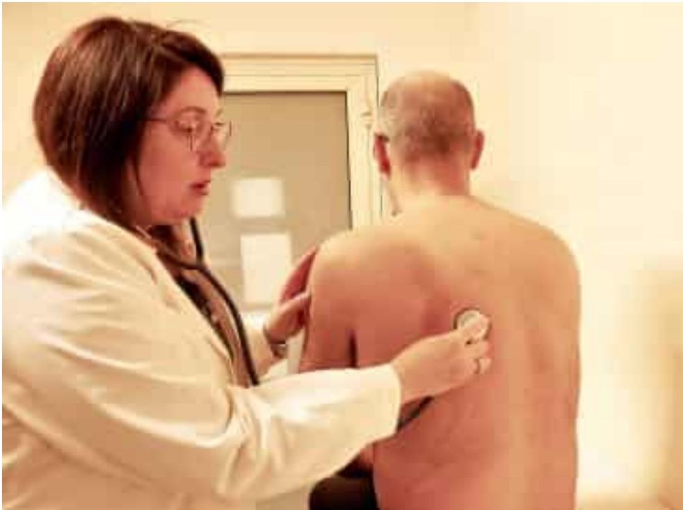
Un medico di famiglia mentre sta auscultando l'apparato polmonare di un paziente attraverso lo stetoscopio

Dietro la complessa terminologia amministrativa si nasconde un problema molto concreto: la difficoltà di reclutare nuovi medici di base, soprattutto nelle aree periferiche e nei centri più pic-