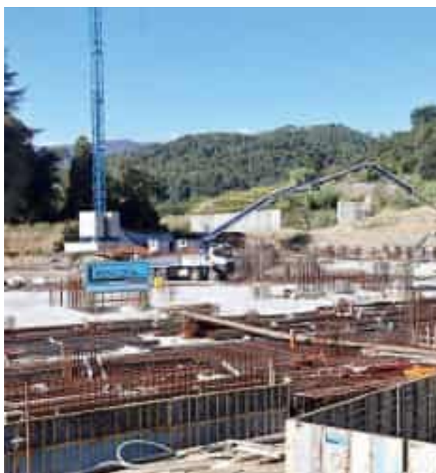
Le fondamenta dell'ospedale prendono forma e le gru sono al lavoro. Ieri il sopralluogo al cantiere del presidente della Regione Marco Bucci

Entro fine anno, il programma prevede il comple-