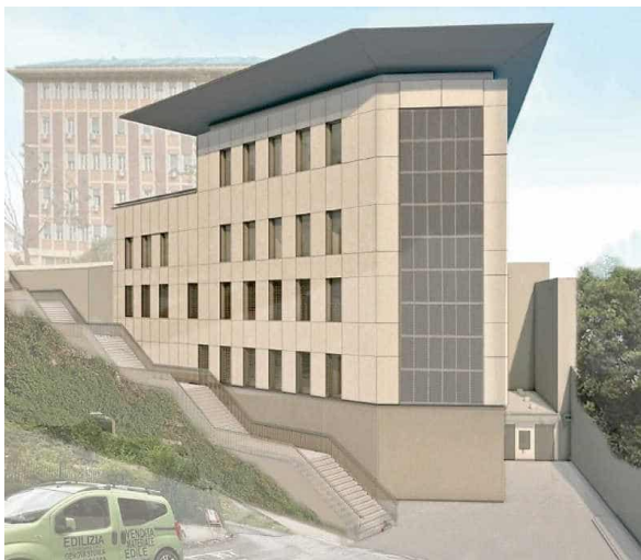
Un rendering della struttura che dovrebbe sorgere in via Bainsizza

Un nuovo operatore privato nel campo della sanità è pronto a sbarcare a Genova. Si tratta del colosso europeo Amethyst , che si occupa di radioterapia oncologica in sei nazioni del continente: Francia, Austria, Regno Unito, Polonia, Romania e Italia. In Italia Amethyst ha iniziato la sua attività nel 2017 all'ospedale Fatebenefratelli di Roma, per poi allargarsi nel 2022 all'ospedale San Carlo di Potenza, dopo aver chiuso il presidio nella Capitale. A Genova, su progetto dello studio di ingegneria Mcm e con un investimento da oltre sei milioni di euro, il gruppo internazionale della sanità privata è pronto a costruire una palazzina di cinque piani in via Bainsizza, nel quartiere di Sturla, proprio di fronte all'attuale sede dell'Asl 3, sfruttando un terreno un tempo di proprietà di Arte , l'agenzia territoriale per l'edilizia di Genova e provincia. A supportare la sanità pubblica, quindi, ecco un altro operatore che ha deciso di investire nella città. Amethyst opera normalmente in regime di outsourcing, ovvero esternalizzazione da parte delle aziende sanitarie pubbliche che, in questo modo, cercano di ottimizzare il servizio. La palazzina