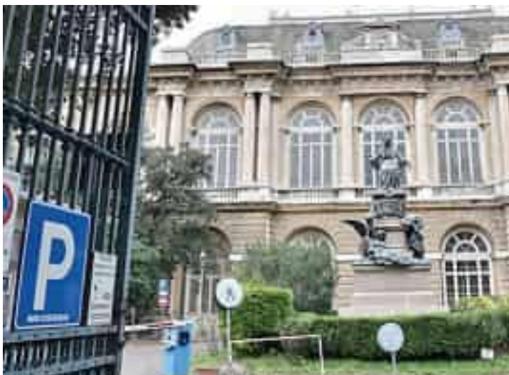
L'ospedale Galliera potrebbe perdere l'autonomia. Al centro la statua della Duchessa

Durante la riunione è stata rimarcata la necessità di difendere, senza perdere tempo, il nome e la storia del Galliera, oltre ad assicu-