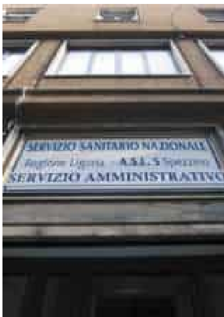
La sede della direzione di Asl5

L'Asl 5 cerca un giornalista: l'azienda sanitaria ha lanciato un concorso pubblico per assumere a tempo determinato un addetto stampa che affianchi il dirigente dell'ufficio comunicazione e stampa. La figura selezionata dovrà supportare le attività informative dell'ente, contribuendo alla diffusione delle notizie verso l'esterno e alla gestione dei rapporti con l'utenza e i media, oltre che al coordinamento interno dei