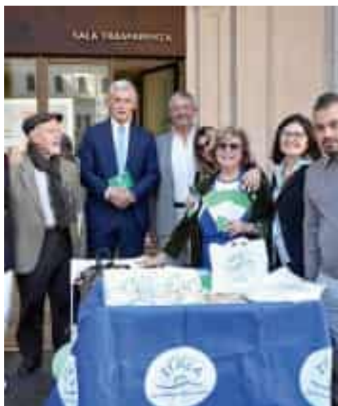
Un banchetto del progetto "Itaca" per la salute mentale

del benessere di ogni persona: prendersene cura significa prendersi cura dell'intera comunità». L'annuncio arriva in occasione della Giornata mondiale della Salute mentale. «Grazie all'impegno economico assunto dalla Regione e alla sinergia con l'Ordine degli psicologi, entro la fine del 2025 prenderà il via la sperimentazione in tutte le Asl del territorio, un servizio atteso che ci permetterà di rispondere in modo più accessibile e tempestivo ai crescenti bisogni psicologici della popolazione, aggravati negli ultimi anni dagli effetti della pandemia. Il servizio sarà complementare con l'attività dei medici di medicina generale che si potranno così avvalere della competenza dello psicolo-