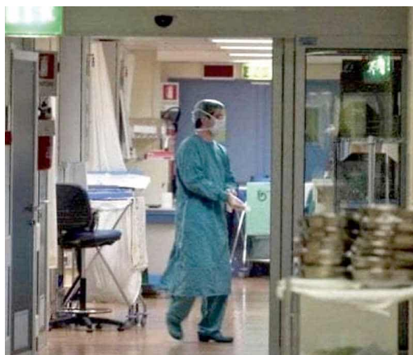
Un reparto di degenza di un ospedale pubblico ligure

«Io non ci voglio andare nel privato, perché mi fido degli ottimi specialisti della nostra sanità pubblica, che contribuisco a pagare, e perché le strutture pubbliche hanno tutti quei reparti, come la terapia intensiva, che se qualcosa dovesse andare storto possono salvarmi la vita - scandisce - e non voglio neanche andare ad intasare il pronto soccorso, solo per risolvere il mio problema che potrebbe essere gestito fuori da quel reparto». Il paziente savonese ha anche scritto, a inizio settembre, una mail alla Asl2: «Ho scritto all'Urp, non ho ricevuto neppure una risposta». A notare un peggioramento delle sue condizioni, oltre ai sintomi registrati dal paziente, sono anche i sanitari che gli firmano i referti delle sue donazioni di sangue: «L'ul-