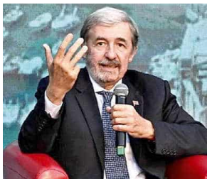
Il presidente della Regione Liguria Marco Bucci. In alto, a destra, medici in un ospedale (foto d'archivio)

Il governatore assicura che entro la settimana consegnerà la bozza. Intanto oggi incontra i direttori delle Asl