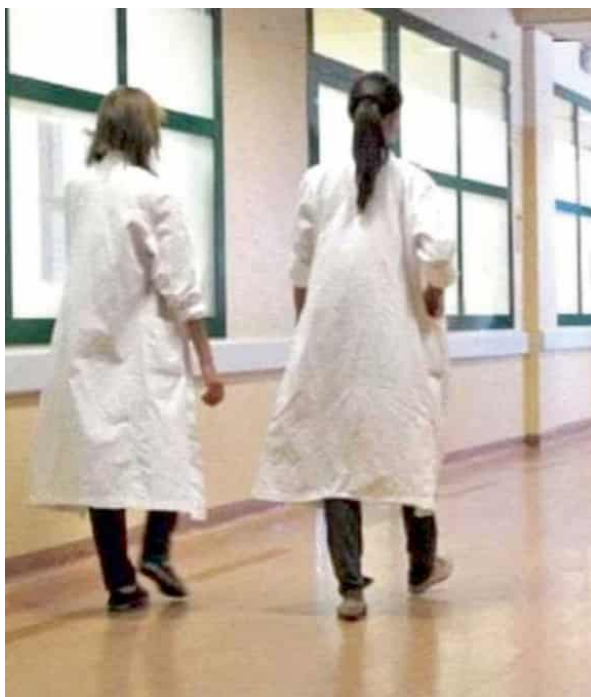
➔ C'è fermento nel mondo sanitario per la riforma voluta da Bucci

L'ipotesi su cui i vertici della Sanità regionale starebbero lavorando sarebbe la stesura di una legge regionale, per fondare la Asl unica, così come accaduto con la realizzazione di Liguria Salute che ha sostituito Alisa. E quindi la norma, che potrebbe effettivamente essere pronta per gennaio, sarebbe approvata prima