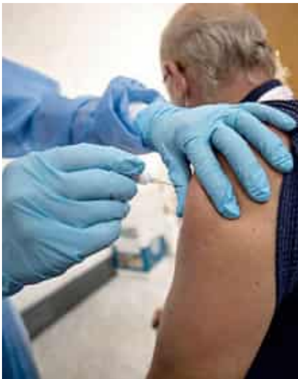
La somministrazione di un vaccino anti Covid a un paziente

Ha semplicemente sospeso il dipendente senza nemmeno chiedersi se potesse essere ricollocato in un ufficio isolato, in smart working, o in mansioni che non prevedessero contatti con pazienti o colleghi. I