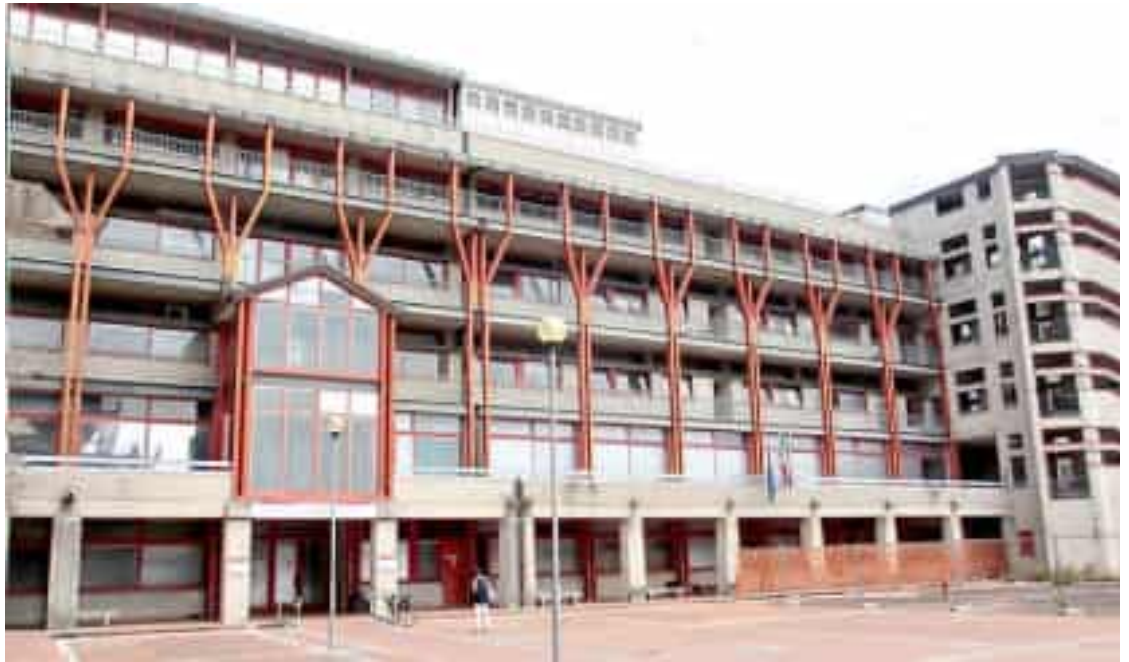
L'ingresso dell'ospedale San Bartolomeo di Sarzana

La giovane donna, che abitava in un comune della Val di Magra, era stata ricoverata per una miocardite per la quale era stata già sottoposta a cure