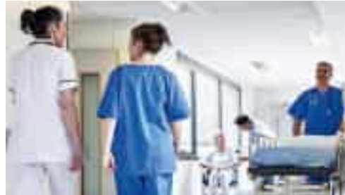
Operatori sanitari nella corsia di una struttura

La commissione era stata richiesta dalla stessa esponente renziana per avere il quadro sull'organico del centro sanitario per anziani per cui si erano ravvisate criticità sul fronte del numero