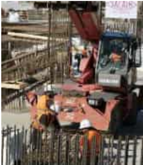
Le opere in corso