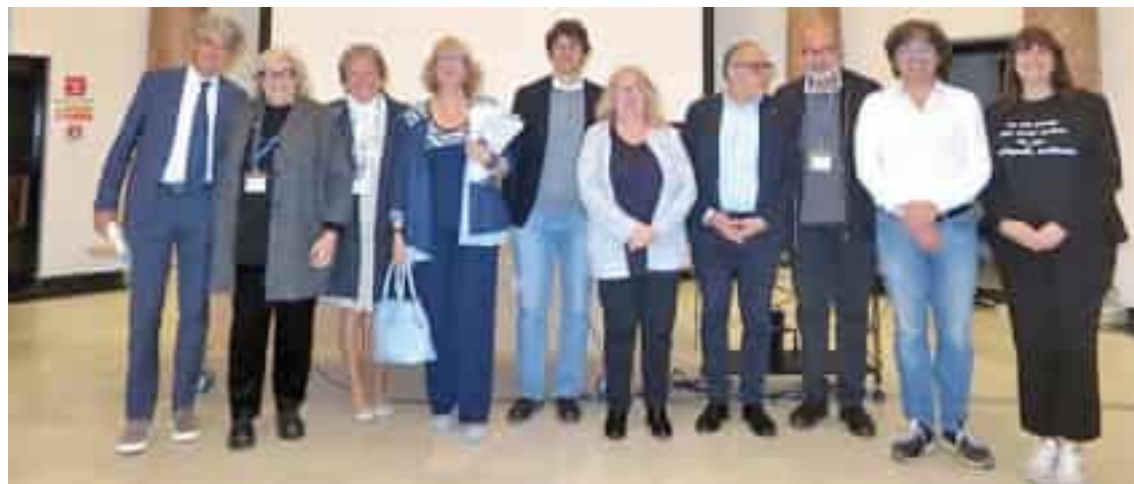
I componenti del comitato esecutivo dell'associazione Braccialetti bianchi

Il progetto promosso dall'associazione di volontari Braccialetti bianchi La novità è rivolta alle pazienti ricoverate in Oncologia al San Martino