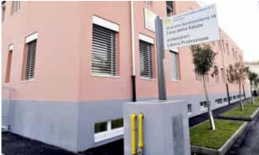
La Casa della Salute dell'Asl5 a Bragarina

Il disagio però tocca da vicino anche lo stesso personale