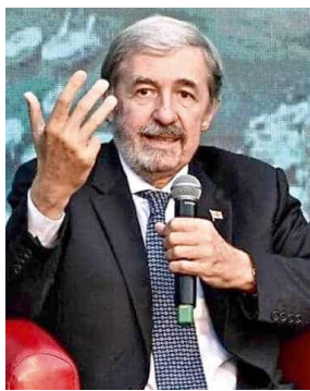
Il governatore Marco Bucci

Al progetto starebbe lavorando il direttore generale Paolo Bordon che avrebbe già sondato il percorso con diversi interlocutori