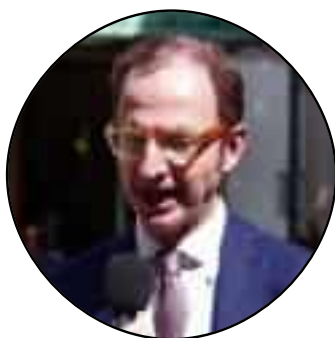
Massimo Nicolò Assessore regionale

«L'obiettivo della campagna antinfluenzale è raggiungere il numero più ampio di persone, in particolare gli anziani e fragili che sono più a rischio per le complicanze legate al virus. Dobbiamo tutti comprendere l'importanza del vaccino e metterci in sicurezza. Avere una ampia adesione ci consentirà non solo di tutelare la salute dei cittadini, ma anche di evitare il sovraffollamento dei pronto soccorso»