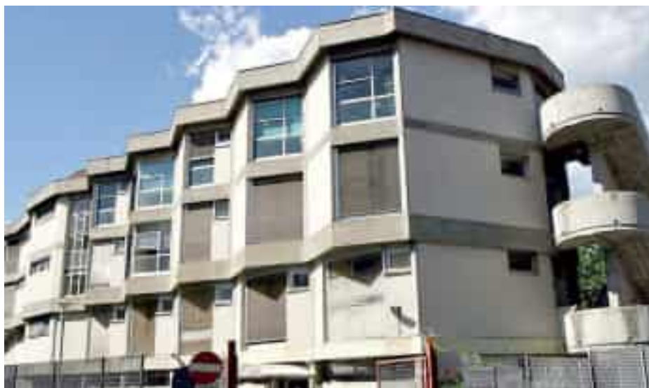
La Residenza Sanitaria Anziani Mazzini della Spezia

E ora le persone che hanno necessità di ricovero in una residenza assistita devono