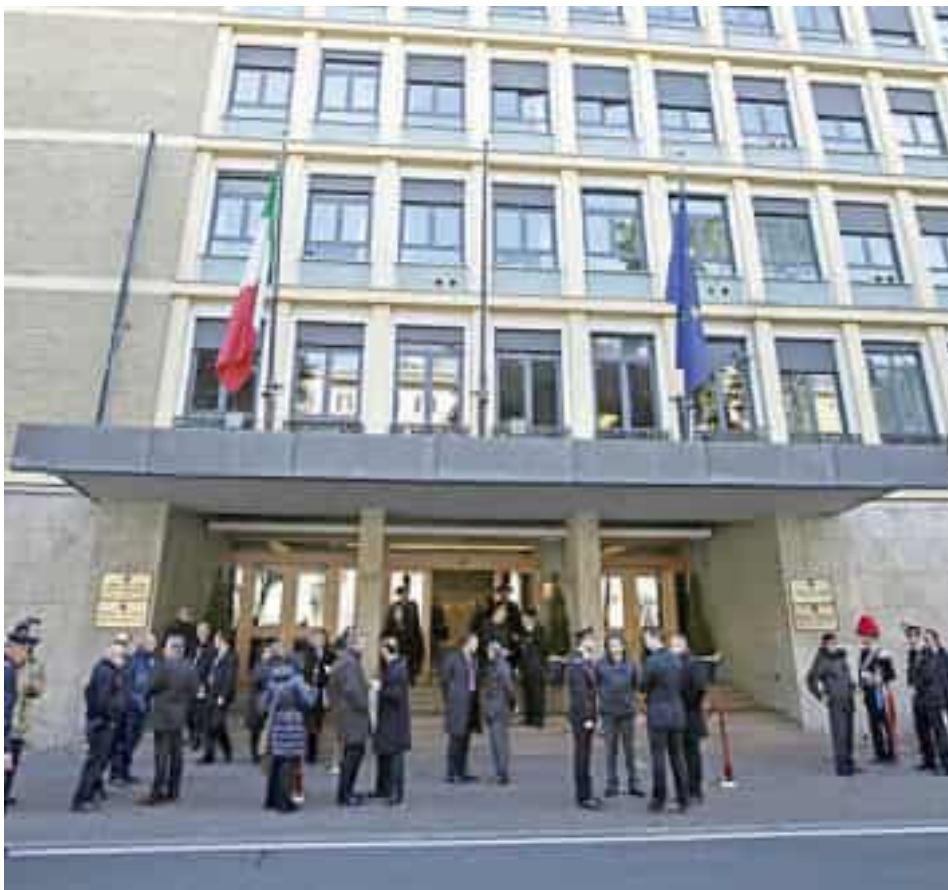
La sede della Corte dei Conti a Roma

Dal 2017, si è arrivati ora dinanzi alla Corte dei Conti, che non ha accolto la richiesta del beneficio pensionistico ma ha accordato un significativo indennizzo. Il sotto capo ha depositato una consulenza di parte che contesta il rigetto ed ha chiesto di poter ricevere la pensione partendo dai ratei arretrati, negati otto anni fa, quando aveva chiesto il riconoscimento