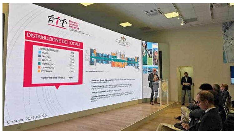
La conferenza stampa nella Sala Trasparenza della Regione

Stelle di Natale e uova di Pasqua che si trasformano in mattoni, letti e attrezzature all'avanguardia per costruire ed allestire un Centro Trapianti tutto nuovo, all'interno del Policlinico San Martino di Genova, che una volta ultimato, la piena operatività è prevista a marzo 2026, permetterà di creare una vera e propria “cittadella dell'ematologia”. È il “miracolo” dell’Ail, l’Associazione Italiana contro le Leucemie, che mettendo da parte i ricavi di anni di volontariato per le strade di Genova, e grazie anche a una donazione consistente di una benefattrice, è riuscita a raccogliere due milioni di euro con i quali ha realizzato il centro, non solo con l’acqui-