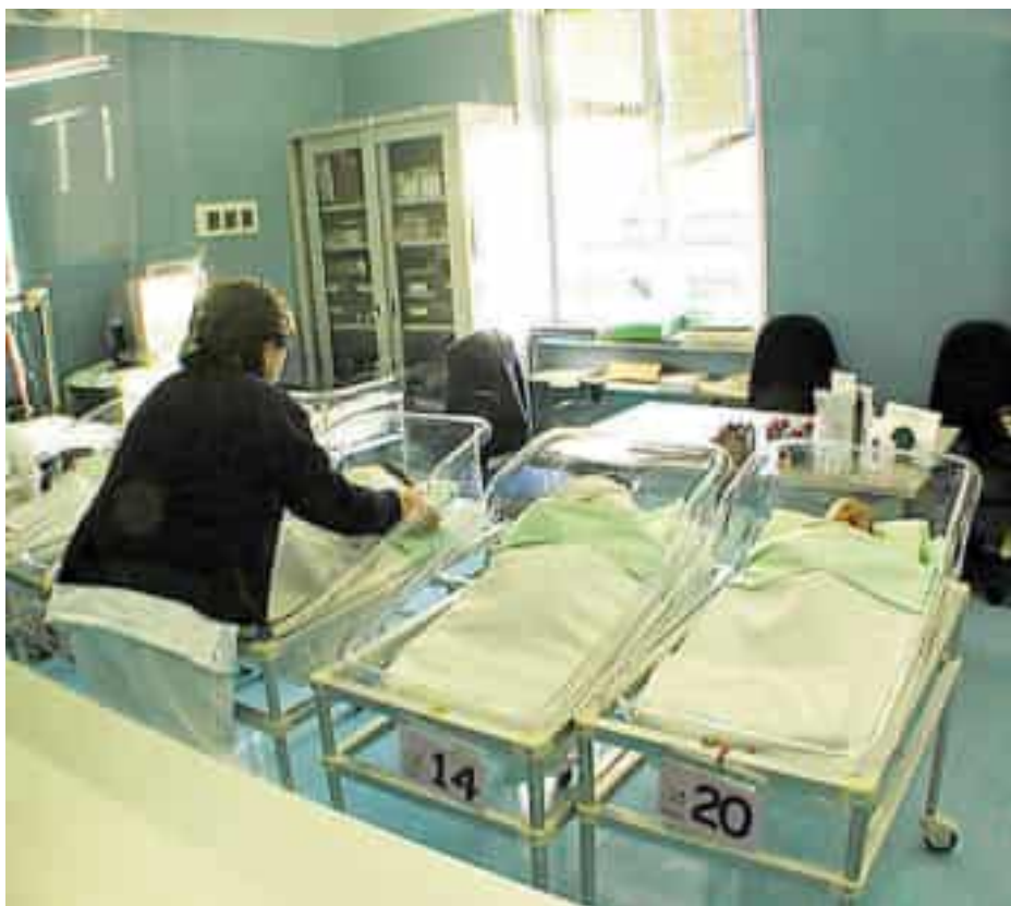
Il nido della Ginecologia

Una situazione che riflette una difficoltà ormai cronica: quella di reperire medici qualificati in numerose branche della sanità, dalle urgenze ospedaliere alla medicina territoriale, in un contesto nazionale segnato da pensionamenti, concorsi deserti e tempi lunghi per le nuove assunzioni. Anche alla Spezia la carenza di professionisti di ginecologia e ostetricia ha reso necessario accelerare le procedure di reclutamento per evitare ripercussioni sui servizi e sulle turnazioni nei reparti. L'Asl 5 ha quindi deciso di procedere direttamente con l'indizione del concorso, avvalendosi della possibilità