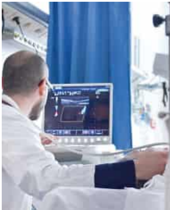
Un medico che sta eseguendo un'ecografia

Lo testimonia il budget che l'azienda sanitaria ha destinato alle strutture convenzionate per esami di diagnostica strumentale e visite specialistiche: con un incremento di circa 285 mila euro, il fondo complessivo per il 2025 è arrivato a superare 1,6 milioni di euro. La novità riguarda strutture come l'Istituto radiologico Beretta di via Persio, lo studio D'Amato di viale Nazario Sauro, il Centro diagnostico e terapeutico spezzino di via Ricciardi, il Labortest di Arcola, lo studio di radiologia Mox di Ceparana, il centro radiologico Eco X di Sarzana, il Centro medico lunense di Sarzana e il Centro medico diagnostico con sedi a Santo Stefano e alla Spezia. Tra i centri privati a