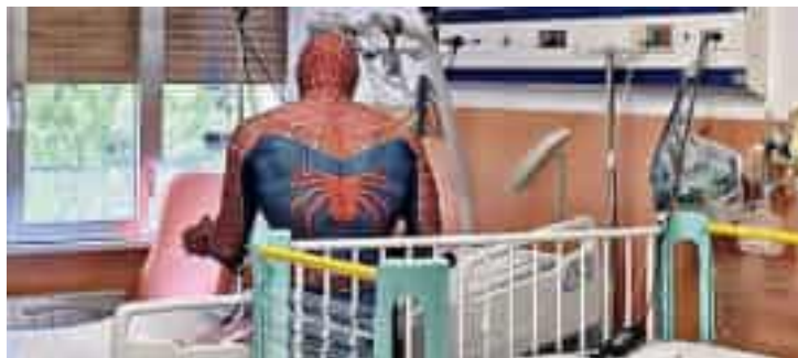
Spiderman nella corsia del reparto pediatrico del Sant’Andrea

Il supereroe ha portato sorrisi, abbracci e piccoli doni ai bambini ricoverati regalando momenti di allegria a loro, alle famiglie e al persona-