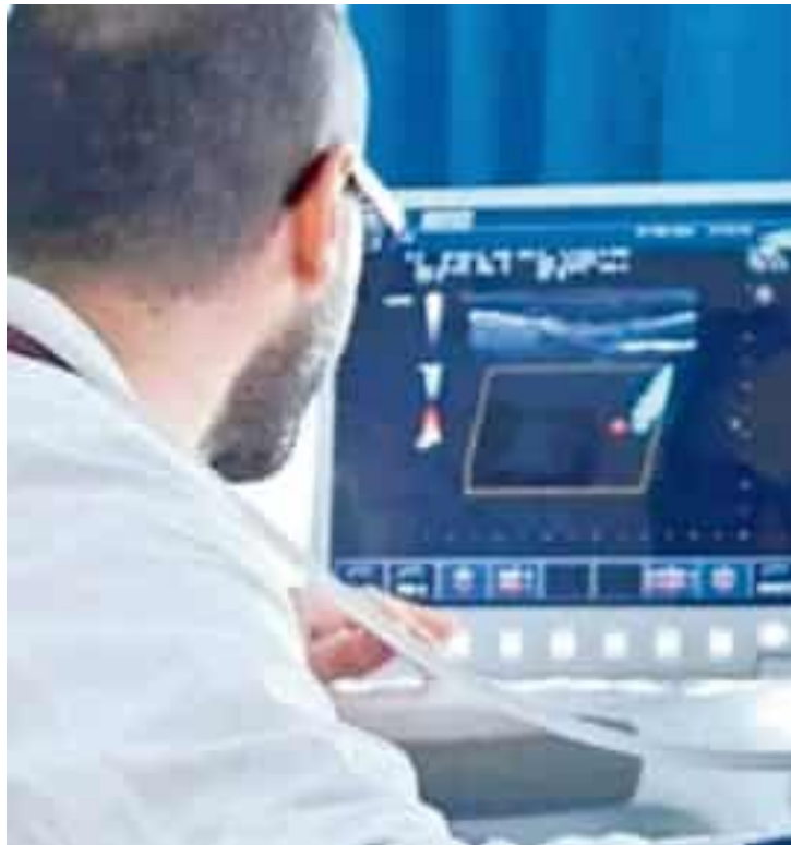
Un esame diagnostico al Centro ictus dell'ospedale San Martino

“ T ime is brain”. Il tempo è cervello. Quando non arriva sangue ai neuroni, ovvero le cellule nervose, questi muoiono. Quindi è basilare arrivare prima possibile in ospedale perché, come dice il messaggio della Giornata mondiale dell'ictus, in programma il 29 ottobre, “ogni minuto conta” ed agire entro 4-5 ore dall'inizio dei sintomi fa la differenza. A Genova le stime parlano di circa 7-8 nuovi casi di ictus al giorno, circa 2.500 l'anno. Spesso sono coinvolti anche gli occhi. E proprio sui sintomi oculari si concentra un'originale ricerca genovese che mette assieme il Centro ictus del San Martino con l'Istituto David Chiossone. Sotto la lente d'ingrandimento c'è l'emianopsia, ovvero l'impossibilità alla visione di una metà del campo visivo dei due occhi. «In pratica, se la persona ha una emianopsia destra con coinvolgimento di entrambi gli occhi, chiudendo l'occhio destro non vedrà gli oggetti