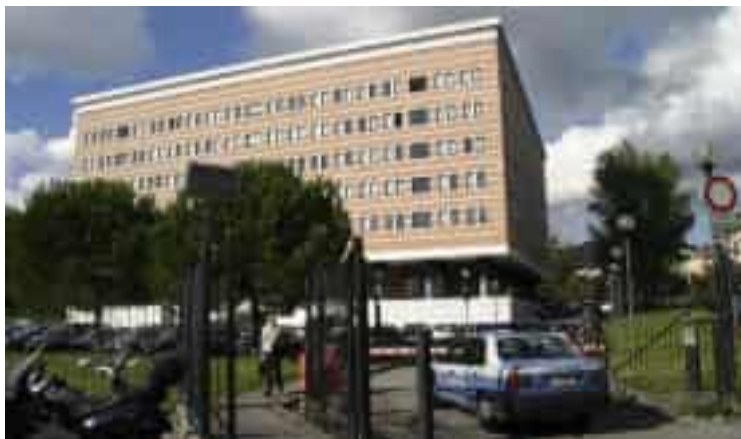
Il palazzo di giustizia della Spezia. Le indagini sono partite a seguito della denuncia presentata da una giovane studentessa

Una vicenda ancora tutta da acclarare, ma che ha già portato a un primo rilevante intervento dell'autorità giudiziaria: l'interdizione temporanea dall'esercizio per sei mesi, emessa pochi giorni fa dal giudice per le indagini preliminari Tiziana Lottini. Un infermiere di Asl5 risulta indagato a piede libero: il reato ipotizzato dalla procura spezzina è quello di violenza sessuale. Nel mirino della magistratura è finito un professionista che da lungo tempo opera nell'azienda spezzina, e che, secondo una prima ricostruzione della Procura, avrebbe (il condizionale è d'obbligo) allungato le mani su un'infermiera tirocinante. Il fatto si sarebbe verificato la scorsa estate in un reparto dell'ospedale Sant'Andrea della Spezia. A presentare la denuncia, lo scorso settembre alla squadra mobile della Questura della Spezia, sarebbe stata proprio la giovane studentessa, che, scioccata per quanto accaduto, avrebbe messo tutto nero su bianco in una denuncia, portando gli inve-