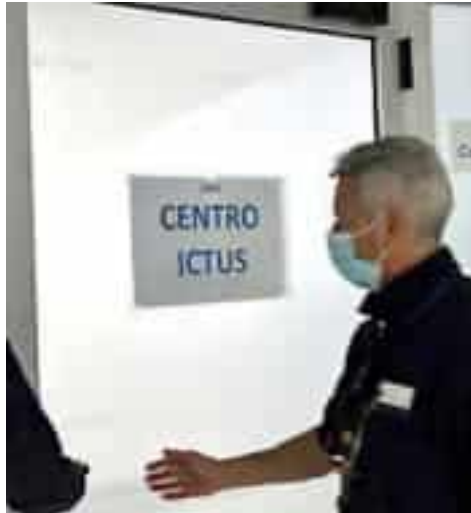
Il Centro Ictus di un ospedale

È qui che ogni giorno si combatte una corsa contro il tempo: intervenire entro quattro o cinque ore dall'inizio dei sintomi può fare la differenza tra un recupero completo o una disabilità permanente. Eppure, troppo spesso, le persone arrivano in ospedale quando è ormai tardi, perché i segnali non vengono riconosciuti o perché si tende ad aspettare. Seconda causa di morte in Italia e prima di invalidità, l'ictus colpisce soprattutto gli over 60, ma non risparmia nemmeno i più giovani. Nell'85 per cento dei casi si tratta di un'occlusione di un vaso sanguigno