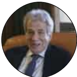
Andrea Cantadori Prefetto

«L'obiettivo del protocollo è eliminare i tempi morti per permettere a un'opera molto attesa di non subire ritardi»