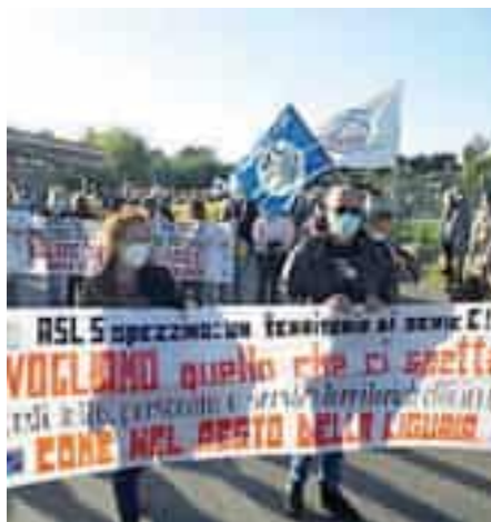
La manifestazione del 2021

La domanda circola ormai da oltre 15 anni, quando nella primavera 2010 il Comune a guida centrosinistra avallò la decisione della Regione sempre della stessa parte politica di chiudere il reparto maternità. Una domanda risuonata con insistenza fino a oggi, anche dopo la manifestazione del 9 ottobre 2021, a cui parteciparono oltre 4 mila persone. L'evento di domani punta a riempire la sala e a coinvolgere quante più persone possibili in un confronto diretto tra istituzioni, politica e comitati civici, per fare luce sulle prospettive reali dell'assistenza sanitaria nella provincia spezzina. Al centro del dibattito: il destino del San Bartolomeo, le incognite legate all'ipotesi di una grande Asl regionale unica e la possibilità di concentrare