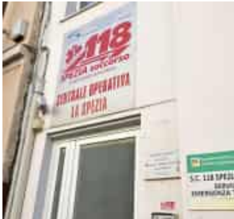
La centrale operativa del 118

«una grave situazione di carenza di organico», con sei posti vacanti che al momento non sono ancora stati coperti da nuove assunzioni. Lo stesso problema si ripete anche al pronto soccorso della Spezia e al punto di primo intervento di Levante: «Per il persistere della nota carenza di organico, si rende indispensabile la copertura della turnazione mancante», si legge nel piano dell'Asl che programma i turni aggiuntivi negli ultimi tre mesi dell'anno. Una situazione di crisi che «si protrarrà verosimilmente per tutto il 2025 e sino all'adeguata integrazione dell'organico». Sul fronte del servizio dell'emergenza-urgenza, invece, la centrale del 118 attualmente deve fare i conti con un deficit di quattro medici «associato a una malattia lunga e al piano di smaltimento ferie accumulato negli anni». Una quota di personale mancante che dovrebbe essere impegnato sia nella centrale operativa di via Mario Asso sia a bordo delle tre automedi-