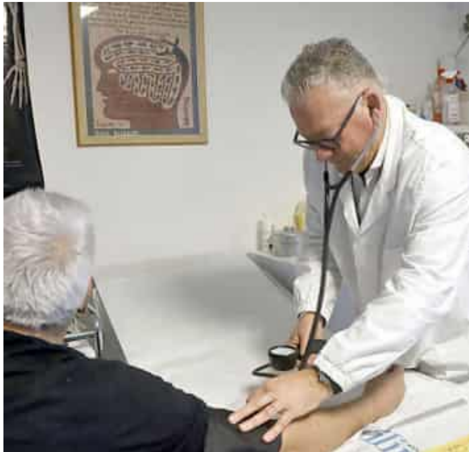
Un medico di famiglia misura la pressione arteriosa a un paziente

Secondo Crovara, la carenza «non è stata presa in considerazione: già da inizio anno si parlava di pensionamenti imminenti e di futuri pensionamenti, è evidente che c'è stata una mancata programmazione da parte della Regione Liguria e del direttore di Asl 5». La questione riguarda anche i piccoli comuni, dove la popolazione più anziana rischia di rimanere senza assistenza sul territorio: «Abbia-