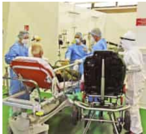
Medici e infermieri durante un trasporto in corsia (foto di archivio)