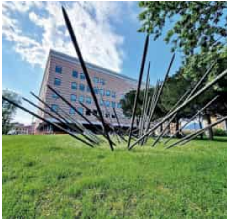
La sentenza è stata letta ieri pomeriggio in tribunale dopo oltre tre ore di camera di consiglio

L'inchiesta, condotta da squadra mobile e guardia di finanza, prese avvio sulle commissioni istituite in Asl 5 e in particolare quella per l'aggiornamento e la formazione dei medici di Medicina generale. Secondo l'accusa sostenuta dalla pm Loris, la commissione avrebbe scelto discrezionalmente un provider, l'associazione Ecm che avrebbe dovuto organizzare i corsi di formazione ricevendo in cambio, mediante un sistema corruttivo, indebite utilità. Il provider sarebbe stato indotto a svolgere gli eventi formativi affittando un locale in via Lunigiana di proprietà della società "Facile Srl", le cui quote erano direttamente o indirettamente riconducibili sempre agli stessi medici membri della commissione. Episodi che sarebbero avvenuti tra il gennaio 2017 e il luglio 2019. Le motivazioni della sentenza si conosceranno tra novanta giorni. —