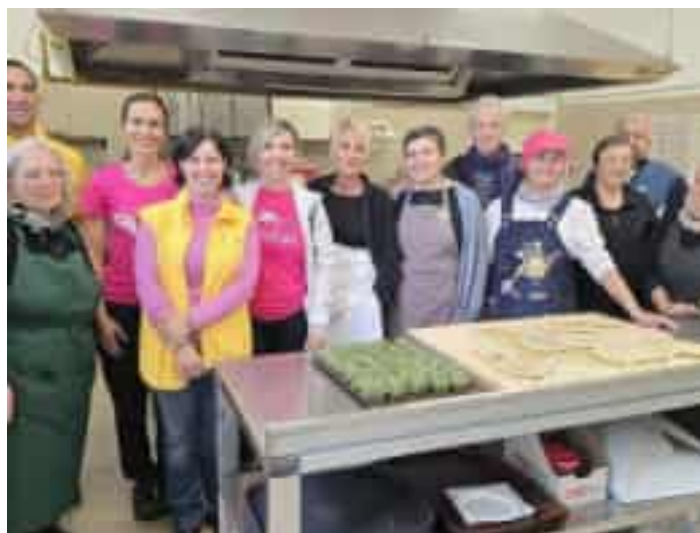
L'incontro nel laboratorio della Scherpada

La salute dipende anche dalla costante attività fisica e dalla corretta alimentazione