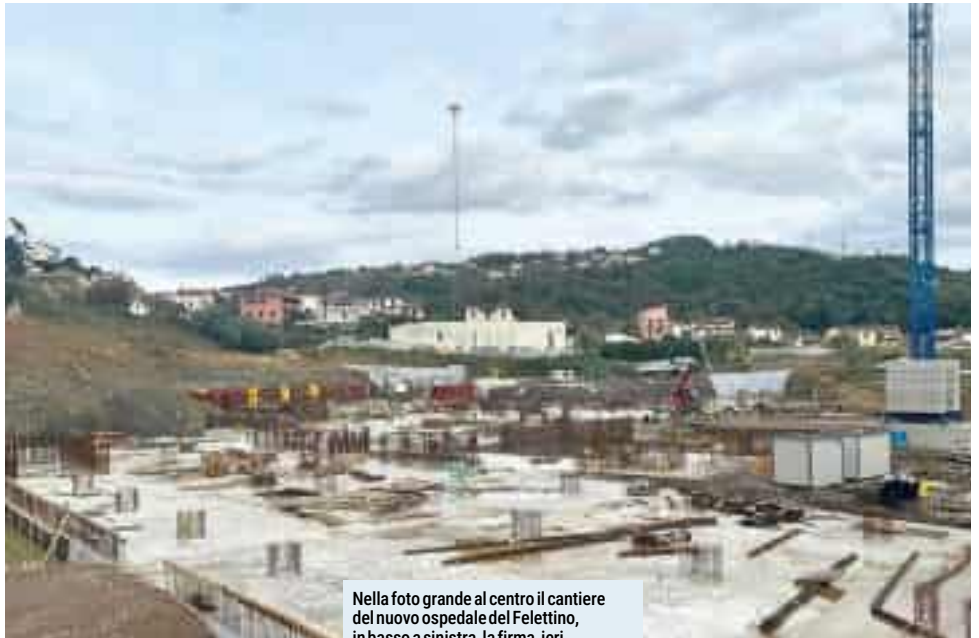
Nella foto grande al centro il cantiere del nuovo ospedale del Felettino, in basso a sinistra, la firma, ieri, del protocollo di legalità in Prefettura, e a destra, addetti al lavoro