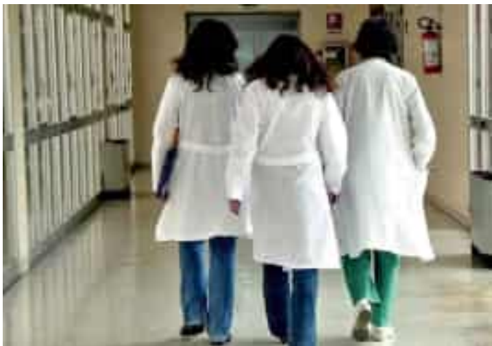
I sindacati dei medici hanno contestato il blocco delle assunzioni e delle nomine voluto dalla Regione

delle carriere che coinvolgerebbe anche posizioni già messe a concorso e deliberate dalle aziende - denunciano i sindacati medici - rappresenta un gravissimo danno alla funzionalità delle strutture sanitarie sia dal punto di vista medico sani-