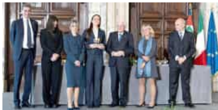
Il presidente Mattarella al centro con i rappresentanti dell'istituto scolastico Deledda di Genova