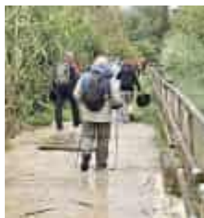
Alcuni momenti della camminata “Insieme per la prevenzione”

panti, come vere massaie di un tempo, hanno impastato e preparato erbe e verdure autunnali per realizzare la tradizionale torta di verdura con ingredienti semplici e genuini.