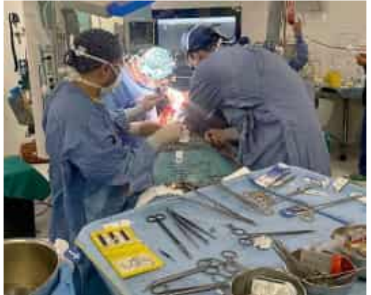
L'équipe del San Martino durante un intervento di trapianto