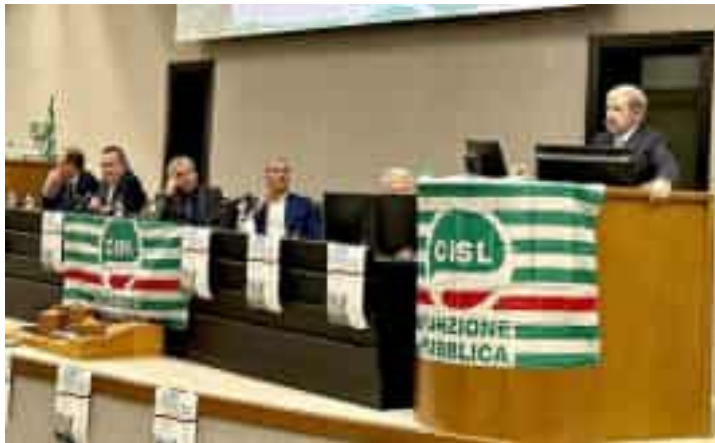
L'intervento del presidente Marco Bucci al convegno organizzato dalla Cisl Funzione pubblica

Bucci ribatte al sindaco di Imperia Claudio Scajola che invia un lungo messaggio, oltre ai saluti, e non è tenero nei confronti della riforma: «Voglio considerare questo testo come una proposta aperta, perché ritengo che vi siano ancora molte modifiche da apportare. In primo luogo come sindaco della mia città, esprimo preoccupazione che questa riforma possa rendere ancora più marginale la responsabilità dei sindaci. Mi sembra di cogliere, dalle di-