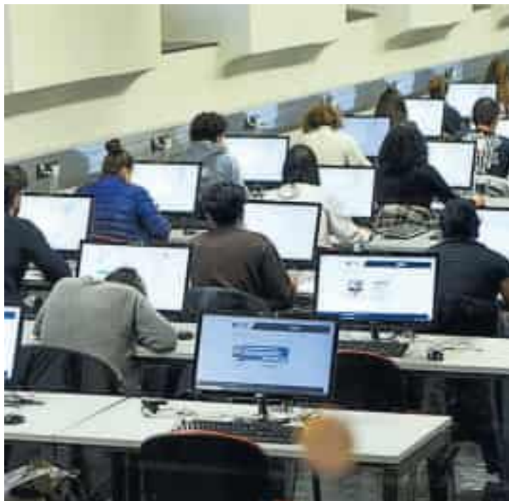
Cambiate le modalità per accedere al corso universitario di Medicina

Buona la prima: a Genova fila liscio, almeno a livello organizzativo, il primo appello del cosiddetto semestre aperto di Medicina e Odontoiatria. Sono 835 le studentesse e gli studenti che, ieri mattina, al padiglione Jean Nouvel, hanno sostenuto gli esami. Una delle specificità dell'Università di Genova è che tutte le studentesse e gli studenti che hanno affrontato questo primo appello si sono presentati per tutti e tre gli esami previsti: Chimica e propedeutica biochimica, Fisica e Biologia. È il primo appello del nuovo corso di Medicina: perché, per la prima volta, da questo anno accademico, è in vigore la riforma voluta dalla ministra Anna Maria Bernini con l'abolizione dei test di ingresso e una selezione solo dopo il primo semestre. Dallo scorso primo settembre tutti gli iscritti al semestre aperto hanno iniziato a seguire le lezioni di tre materie: Chimica e propedeutica biochimica,