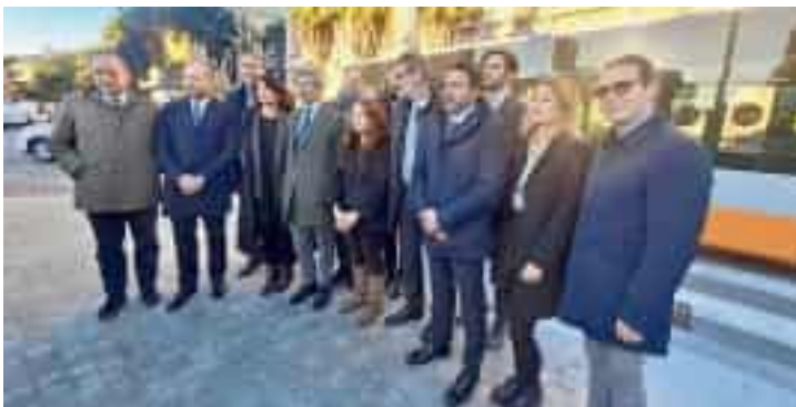
Foto di gruppo davanti all’ospedale San Martino per i consiglieri di opposizione in Regione