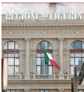
La sede della Regione