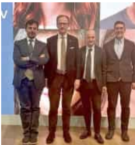
I protagonisti della presentazione per la campagna di vaccinazione

Per valorizzare e ribadire l'importanza della vaccinazione, nei prossimi giorni partirà una campagna di comunicazione per sensibilizzare la popolazione, a partire dai più giovani. La vaccinazione Hpv è offerta gratuitamente alle ragazze e ai ragazzi nel dodicesimo anno di vita (11 anni compiuti); alle ragazze fino all'inizio dello screening cervicale; ai ragazzi fino ai 18 anni di età compiuti, alle ragazze nate dal 1995 ed ai ragazzi nati dal 2004 e alle donne trattate per lesioni di tipo Cin2+ o di grado superiore, da 3 mesi prima a 3 anni dopo il trattamento della lesione. «Noi - aggiunge Nicolò - vorremmo sviluppare