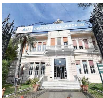
➤ L'ospedale Villa Scassi. Sopra l'incontro a Sampierdarena il primo nel quale il presidente della Regione Marco Bucci e l'assessore Massimo Nicolò hanno illustrato la riforma ai medici

dente dell'Ordine dei medici Alessandro Bonsignore - hanno potuto esporre le proprie riflessioni. Tra le preoccupazioni di chi lavora al Villa Scassi, ad esempio, la suddivisione di Asl3 in due blocchi: l'Ospedale Villa Scassi che confluirà nell'Azienda Ospedaliera Metropolitana e il resto del territorio, con le incertezze su come verranno gestiti i ruoli e i servizi che operano tra ospedale e territorio, il destino di presidi come l'Ospedale Micone e il Gallino, che ad oggi non rientrano nell'Azienda Ospedaliera Metropolitana, così come il futuro dei laboratori con “attività ibrida” rivolta sia all'utenza ospedaliera che a quella pubblica, fino a temi come la disparità di risorse umane nel pronto soccorso, 8 dirigenti medici al Villa Scassi contro i 50 del San Martino, ma anche i rischi legati alle