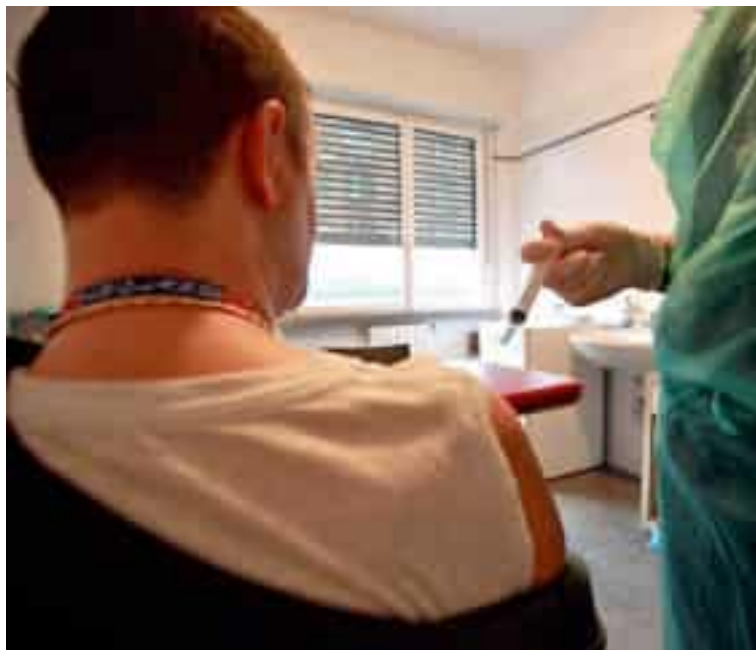
Open day a Levanto sulle vaccinazioni

L'iniziativa, che amplia l'offerta di prossimità sul territorio della Riviera, è pensata per facilitare l'accesso alla vaccinazione in un periodo in cui le patologie respiratorie tornano a circolare con maggiore intensità. Per partecipare all'open day straordinario non serviranno né prenotazione né prescrizione del medico di famiglia: basterà presentarsi con un documento d'identità ed eventualmente l'elenco dei farmaci assunti abitualmente. In caso di importanti allergie o dubbi sulla propria situazione clinica, l'Asl raccomanda di confrontarsi preventivamente con il proprio medico di famiglia. Le altre condizioni saranno valutate sul posto tramite la scheda anamnestica e il colloquio con il personale sanitario. Come di consueto, dopo la vaccinazione sarà richiesto un pe-