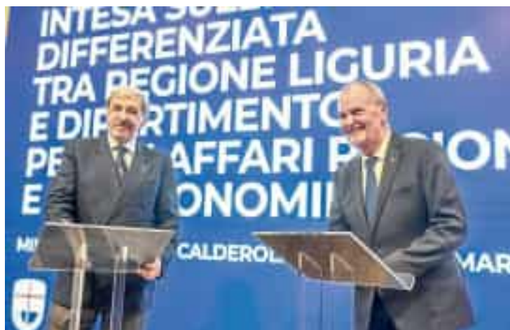
Il presidente della Regione Liguria Marco Bucci e il ministro per gli Affari regionali Roberto Calderoli

«Potremo integrare il fondo sanitario nazionale con uno regionale, per esempio per l'edilizia ospedaliera o per incentivare medici e infermieri. Penso che potremo mobilitare sino al 4-5% in più rispetto al fondo nazionale per la Liguria». Marco Bucci riflette ad alta voce, dopo la firma della pre-intesa sull'Autonomia differenziata. Il governatore ligure è convinto che la mossa del ministro Roberto Calderoli non sia né "fuffa" né un rischio, per una regione piccola e con i conti in bilico sulla sanità come la Liguria. Certo, siamo lontani da quella che fu la richiesta di autonomia di Toti e Sonia Viale nel 2019: non si parla né di infrastrutture né di porti né di politiche ambientali, «ma non ci tiriamo indietro - osserva il presidente - questo è un primo passo: siamo nelle regioni di testa e ci saremo quando il percorso andrà