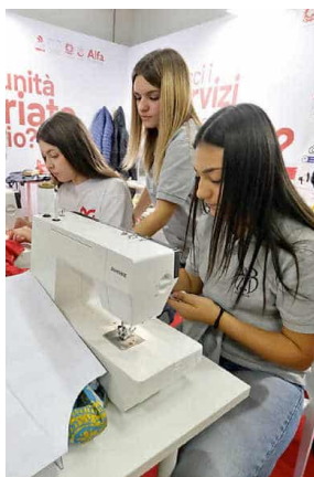
di ragazze e ragazzi tra gli stand del festival Orientamenti