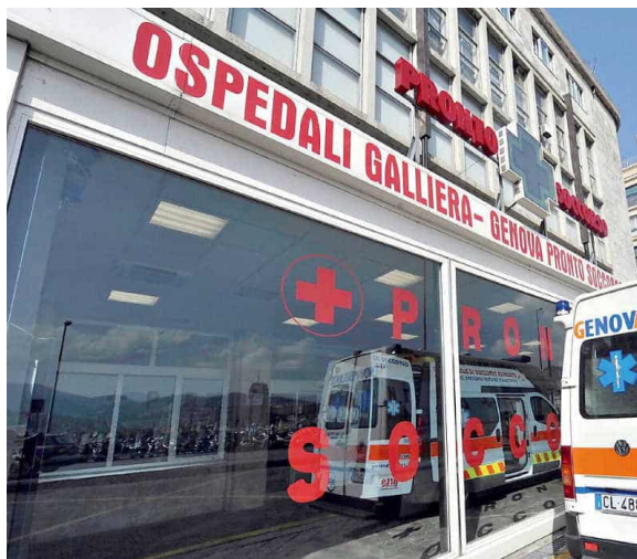
Il Galliera e a destra l'opposizione a San Martino BUSSALINO

Il punto di partenza è netto: «Il sistema è evidentemente anacronistico – ha chiarito Orlando – ha urgentemente bisogno di una riforma», ma quella presentata dal presidente