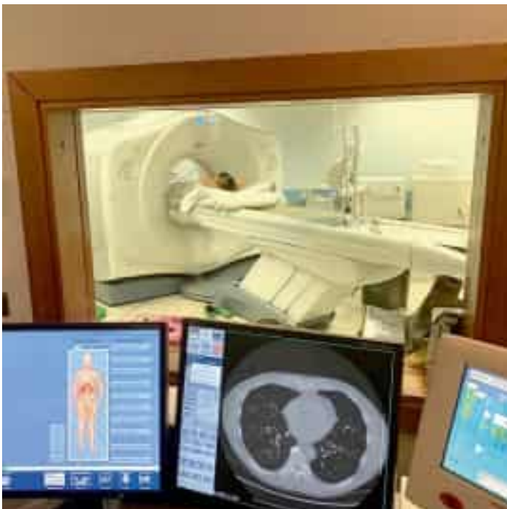
Un esame radiografico

Quello della Radiologia non è un caso isolato. La carenza di personale, infatti, riguarda diversi settori dell'Asl 5 e costringe i reparti a ricorrere alle ore extra del personale in servizio per assicurare i livelli essenziali di assistenza. Una situazione che negli ultimi mesi si è ripetuta anche in altri ambiti: dal pronto soccorso, dove i turni aggiuntivi sono diventati uno strumento ormai strutturale, alla specialistica ospedaliera, dove i vuoti di organico hanno costretto l'azienda sanitaria a potenziare l'apporto delle strutture private convenzionate dello Spezzino. L'Asl si muove così su un doppio fronte: da una parte le nuove pro-