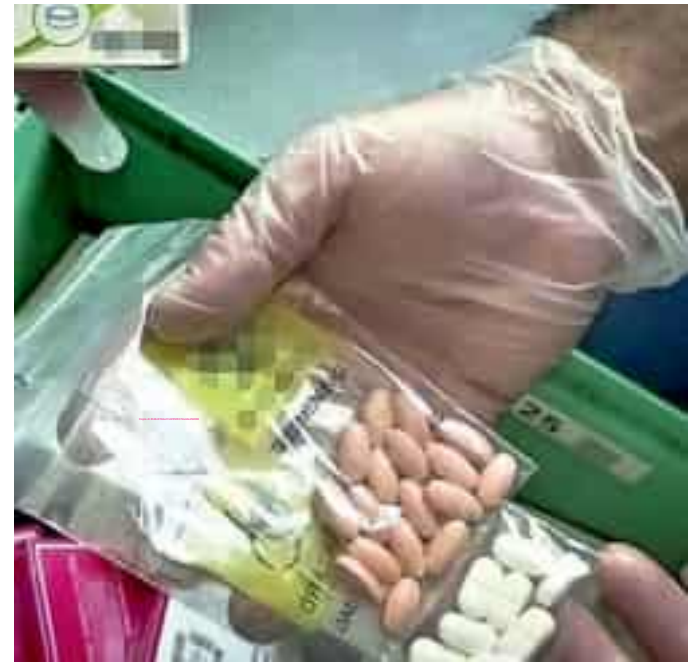
Allarme del Consorzio Cometa per le nuove sostanze

«Il consumo di eroina al momento è quasi scomparso – spiega ancora Morra – mentre a preoccupare di più è la cocaina o l'uso di nuove sostanze psicoattive. Si tratta