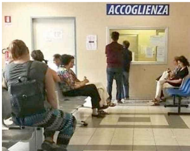
↑ Pazienti in attesa

Il piano oncologico regionale, ultimo redatto, registra più di 100.000 casi di persone affette da malattie oncologiche, con un aumento progressivo di 12.000 casi all'anno. Almeno 40.000 persone hanno rinunciato a curarsi per motivi economici, e ne nessuno ne chiede il perché, 14.000 sono affette da disturbi alimentari (anoressia, bulimia) senza avere un punto di riferimento per curarsi, e quasi tutti dopo anni di attesa, riescono a trovare un posto fuori regione. Questa situazione che, ripeto, genera uno stato