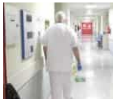
Il San Bartolomeo di Sarzana

«Ho apprezzato molto la convergenza che si è trovata per una materia tanto importante per ciascuno di noi»