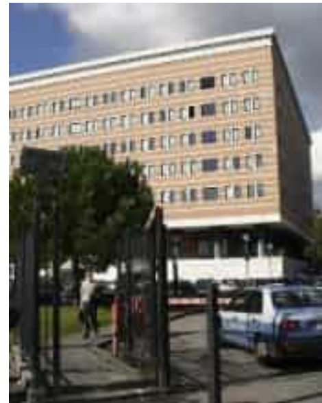
Il Palazzo di giustizia della Spezia. Asl5 è stata condannata a risarcire oltre 250mila euro

fettuali fosse stata correttamente evidenziata una macrosomia fetale, ovvero una crescita del feto superiore alla media. Una mancata diagnosi che «ha condizionato negativamente la condotta ostetrica», in quanto le manovre eseguite in emergenza dai sanitari del Sant'Andrea, necessarie per l'espletamento del parto e per risolvere la distocia di spalla, avevano provocato lo stiramento del plesso brachiale con conseguente 'paralisi ostetrica' del braccio destro del neonato. I periti nominati dal giudice Romano hanno evidenziato che «se i sanitari avessero interpretato correttamente i dati biometrici disponibili dai referti ecografici e se avessero attuato indagini ecografiche mirate anche alla valutazione del peso fetale nei vari accessi della donna alla struttura, sarebbero giunti alla diagnosi che avrebbe comportato certamente, al manifestarsi dei segnali di pericolo nella fa-