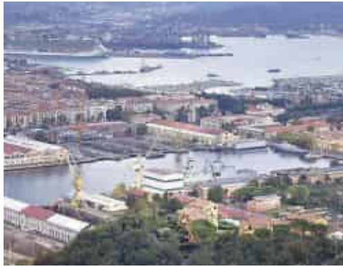
Una veduta aerea dell'Arsenale

E pur avendo uno stato di servizio impegnativo, con missioni estere in zone di guerra, si è visto respingere la richiesta di risarcimento, perché la Corte non ha ritenuto certo il nesso di causa fra lavoro e malattia. A dire "no" all'ex sottufficiale, primo luogotenente della Marina Militare, è stato il Tar della Campania, secondo il quale «non vi sono ad oggi evidenze scientifiche sufficienti a sostenere l'ipotesi della correlazione, nemmeno probabilistica, fra l'esposizione ad amianto, uranio impoverito, vernici, solventi e fumi». È probabile che l'ex maresciallo spezzino, assistito dall'avvocato Ezio Bonan-