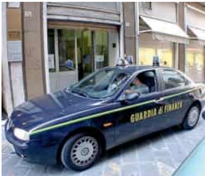
La Finanza ha svolto le indagini sulla circonvenzione d'incapace

L'inchiesta, in cui già fin dall'inizio si è ipotizzato il reato di circonvenzione d'in-