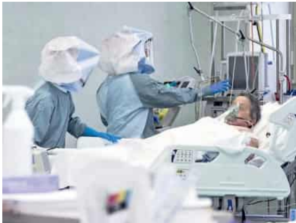
Sanitari al lavoro nel reparto Rianimazione