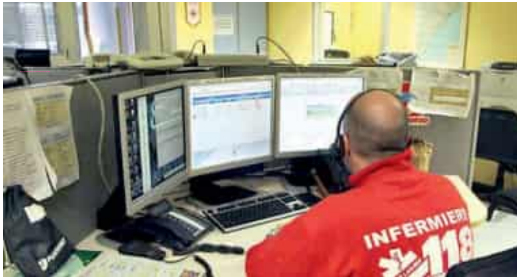
Un operatore della centrale del 118 di Genova che ha sede all'interno dell'ospedale San Martino

Questa volta "canta" sull'emergenza, denuncia possibili irregolarità e prevede il vincitore del concorso per la direzione regionale del 118 che si terrà venerdì a Genova con la prima prova dei candidati davanti alla commissione. Una poltrona ambita: il vincitore avrà la responsabilità della centrale ligure che, secondo i piani della Regione, dovrebbe nascere entro la fine del 2026, forse già a fine estate: fino a ottobre quando è stata chiusa Lavagna, le basi erano cinque, ora sono quattro (Genova, Levante, Savona e Imperia), ma quella dell'estremo ponente verrà accorpata a Genova ad