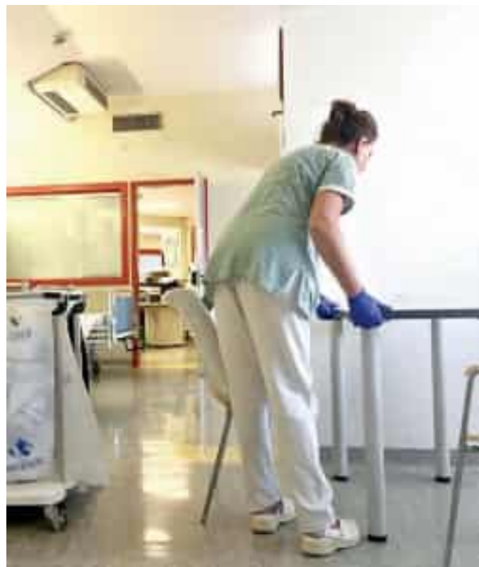
Un'operatrice sociosanitaria al lavoro in ospedale

Anche nello Spezzino la rete è articolata fra hub e spoke: i presidi principali sono alla Spezia in via XXIV Maggio, a Ceparana e a Sarzana; quelli spoke invece a Bragarina e a Luni. Le strutture hub sono pensate per garantire un servizio continuativo, con attività sanitaria attiva 24 ore su 24, mentre gli spoke hanno un orario di apertura più limitato. Gli hub hanno una dotazione più ampia e una copertura