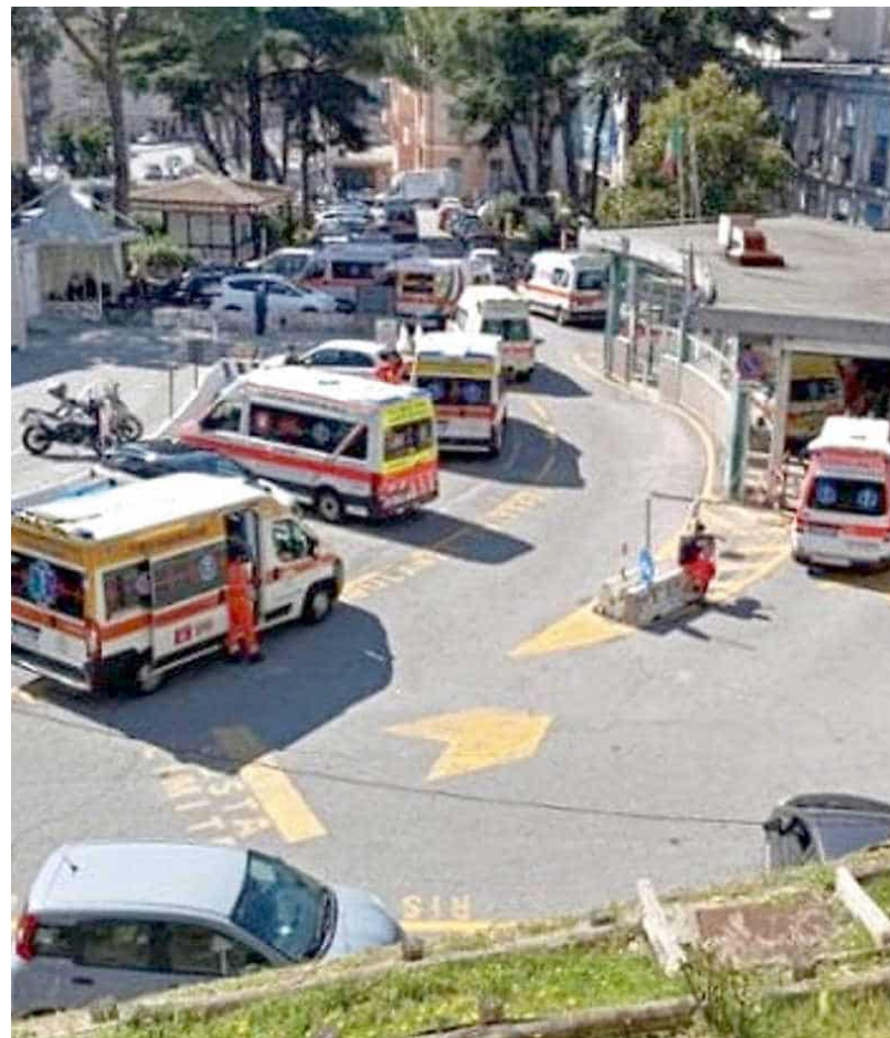
➔ Ambulanze in coda al pronto soccorso del San Martino

Le disposizioni “finalizzate alla riduzione del boarding nei pronto soccorso”, di cui parlano i lavoratori, sono contenute in un decreto di dicembre diramato dal direttore generale del Dipartimento Salute, Paolo Bordon. Si tratta di uno strumento strategico pensato proprio per drenare pazienti dai pronto soccorso nelle settimane di picco influenzale e nei periodi festivi. E Bordon ha previsto azioni semplici, ma decisive, diramate a tutti gli ospedali: si stabilisce il limite massimo di 15 pazienti in boarding , e la durata massima consentita di esso, 8 ore. Oltre quell'attesa, va attivata una “ holding area ”, con 8 posti letto. Vanno incrementate le dimissioni nel fine setti-