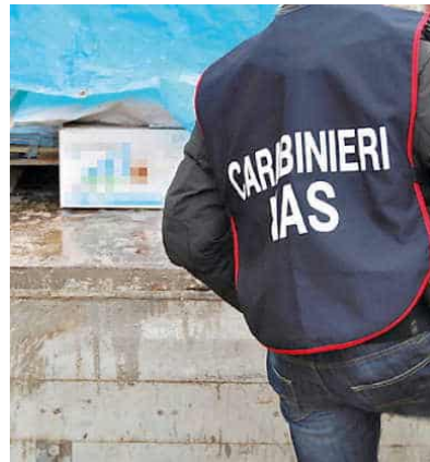
📍 I carabinieri dei Nas hanno eseguito l'indagine che ha portato al sequestro dello studio medico

Il medico era stato denunciato per esercizio abusivo della professione, sempre su segnalazione dei Nas, per aver continuato a lavorare anche durante il periodo in cui era stato radiato. Secondo il suo legale «buona parte di queste segnalazioni è decaduta perché riguarda il periodo tra la pronuncia del-