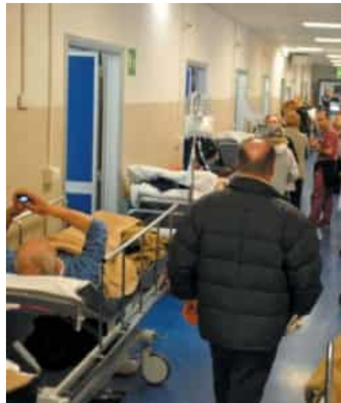
Il pronto soccorso dell'ospedale San Martino

Le principali contestazioni riguardano proprio le situazioni operative: «Si ribadisce con fermezza che la risposta alle criticità del sistema non può consistere nell'aumento indiscriminato dei carichi di lavoro», scrivono i sindacati medici: «L'aggiunta di prestazioni in assenza di spazi organizzativi adeguati, in contrasto con i tempi definiti dalle società scientifiche, compromette la qualità delle cure e la sicurezza dei pazienti, nonché degli operatori tutti. La sanità non si occupa di numeri, ma di persone. Il diritto alla cura, sancito dalla Costituzione, non può essere subordinato a logiche meramente economiche o organizzative improvvisate».