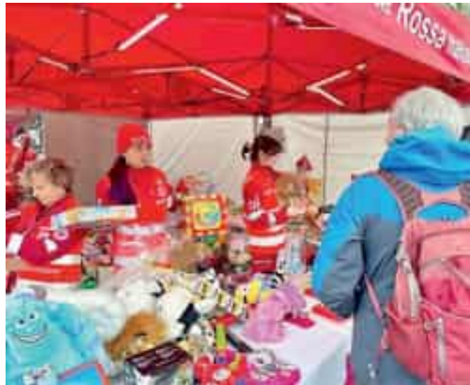
Un banchetto della Croce Rossa

Nel primo caso i volontari affiancheranno operatori e volontari della Croce Rossa della Spezia nelle attività legate alla tutela della salute e all'accesso ai servizi sociosanitari, collaborando ad esempio nei servizi di trasporto sanitario e assistenziale, nell'orientamento ai servizi del territorio e nelle iniziative di informazione e promozione della salute. Nel secondo progetto, invece, i giovani saranno coinvolti in attività di sostegno alle fasce più vulnerabili della popolazione, tra cui