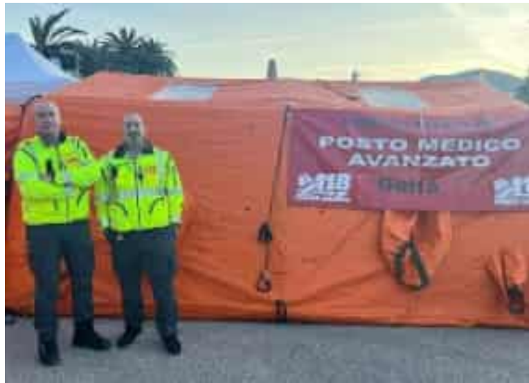
Il posto medico del 118 attivato alla Fiera, in alto lo stand della Croce Rossa

Oltre 600 bancarelle per un appuntamento della tradizione spezzina che si tramanda dal lontano 1654. La Fiera di San Giuseppe torna ad animare le strade della Spezia: l'appuntamento, tra i più attesi dell'anno, prende il via oggi per proseguire fino al 20 marzo nel cuore della città, tra banchi, tradizioni e specialità. In occasione dell'ultima giornata la città accoglierà la prima tappa di 'Velaria - Scalo alla Spezia', il Festival marittimo internazionale che porterà sul Molo Italia i grandi velieri storici e l'atmosfera unica della Via Mediterranea. In occasione della fiera il Comune di Spezia ha predisposto un piano straordinario di viabilità, parcheggi e servizi per garantire lo svolgimento in sicurezza e facilitare gli spostamenti di residenti, visitatori e operatori. Nel dettaglio, sono previste agevolazioni per la sosta: da oggi fino alla mezzanotte del 21 marzo, i residenti con pass delle zone B, C e D potranno