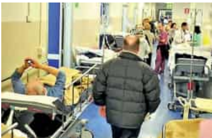
Il pronto soccorso del San Martino in una foto d'archivio