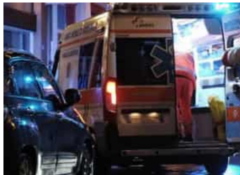
Due attività dei volontari della Pubblica Assistenza di Sarzana

contro mano l'autostrada, per intervenire in un grave incidente che aveva visto coinvolte 11 auto, con un bilancio tragico: undici feriti e un decesso.