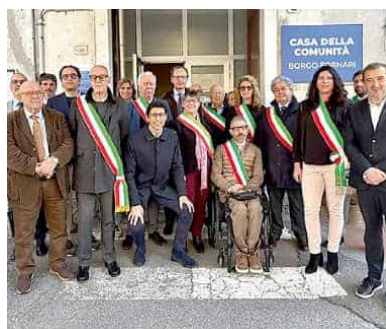
La cerimonia di inaugurazione a Borgo Fornari

È stata inaugurata, anche se è già in funzione da alcune settimane, la nuova Casa di Comunità di Borgo Fornari. A tagliare il nastro, l'assessore regionale alla Sanità Massimo Nicolò e il direttore sociosanitario di Ats Liguria, Pierluigi Vinai. La struttura, cosiddetta “spoke”, è aperta dal lunedì al sabato dalle ore 8 alle ore 20. «Aggiungiamo un presidio concreto per i cittadini della Val Polcevera e della Valle Scrivia e rafforziamo la sanità territoriale - ha detto Nicolò - le Case