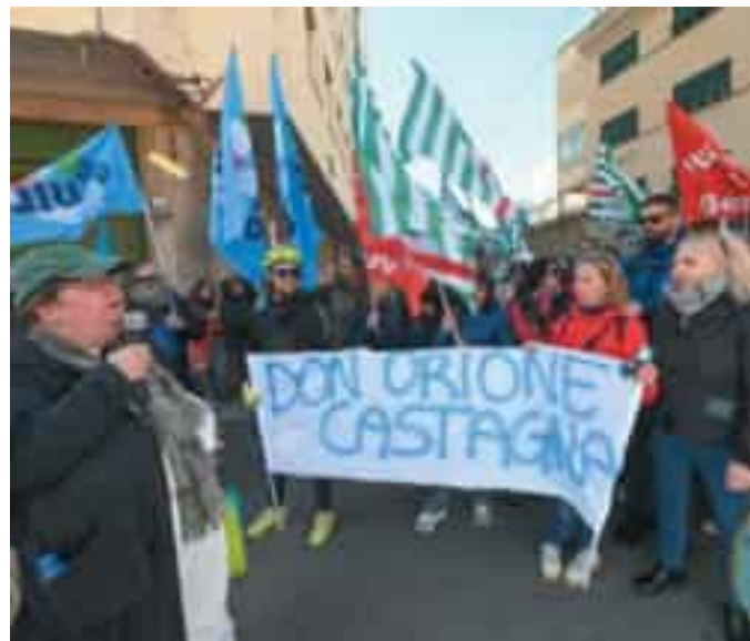
Il sit-in degli operatori della sanità privata