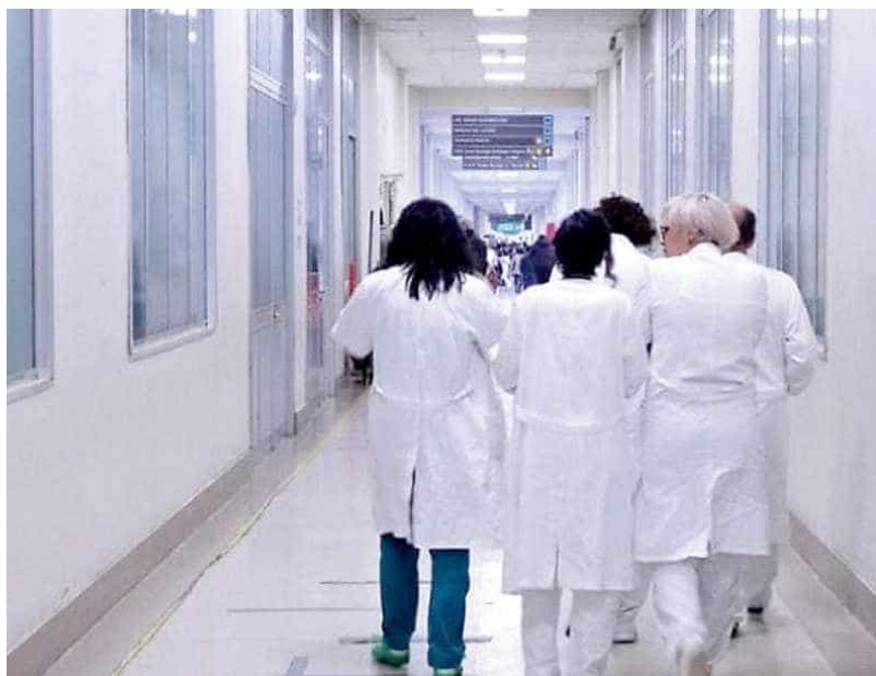
Medici in una corsia di ospedale

Il nuovo direttore socio-sanitario di Ats “Abbiamo bisogno di un patto serio con i sindacati. Dobbiamo lavorare insieme”