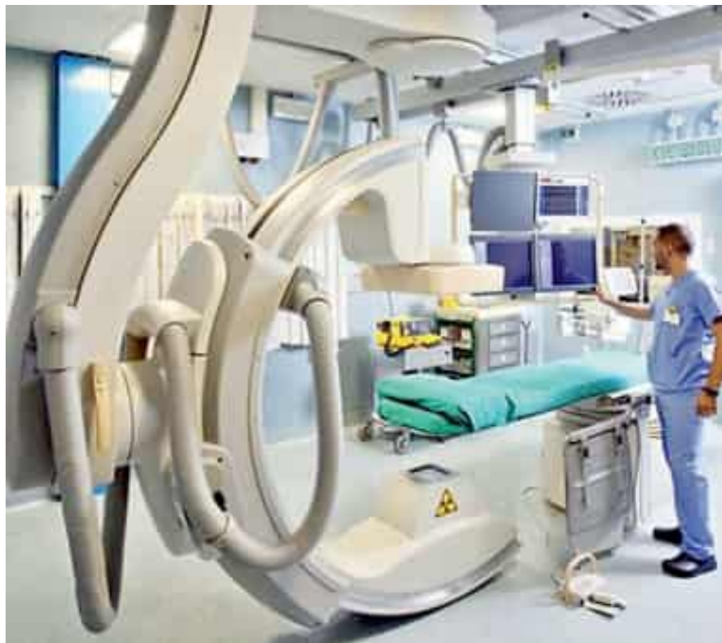
Un esame nel reparto di Radiologia

Radiologia non è un reparto come gli altri. È uno snodo decisivo per l'intero sistema ospedaliero: dal pronto soccorso alla sala operatoria, fino ai percorsi oncologici e alle prestazioni per i pazienti esterni. È qui che passano diagnosi, urgenze e interventi. Per questo l'indicazione dell'Asl 5 è chiara: la priorità è «salvaguardare il regolare svolgimento dei servizi essenziali», a partire dalla radiolo-