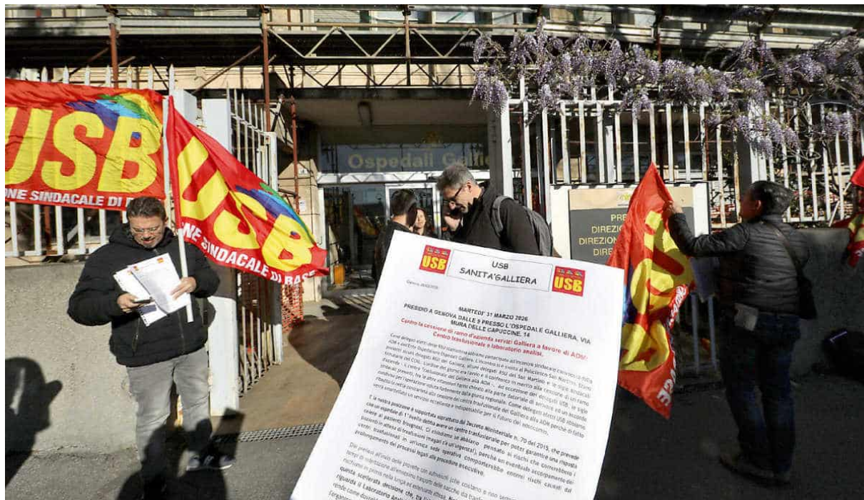
Un momento del presidio organizzato dal sindacato