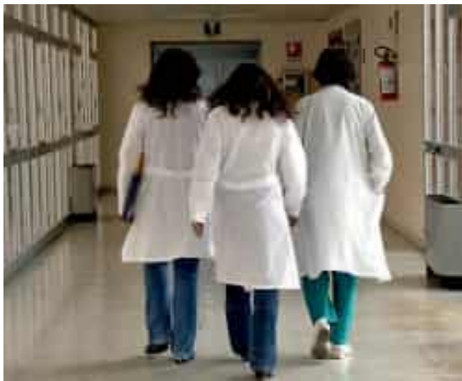
Medici in servizio in una struttura sanitaria

«Sono bandi che servono a colmare le lacune», conferma Ferrara. Il tema si intreccia con la fase di transizione verso il ruolo unico, il nuovo modello organizzativo che coinvolge i medici di famiglia anche nelle attività delle case di comunità. «I medici del ruolo unico nella nostra provincia so-