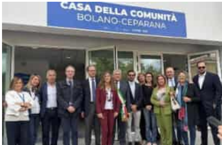
Taglio del nastro per la nuova Casa di Comunità di Ceparana, dove troveranno posto anche la Guardia medica e l'ambulatorio col medico di medicina generale