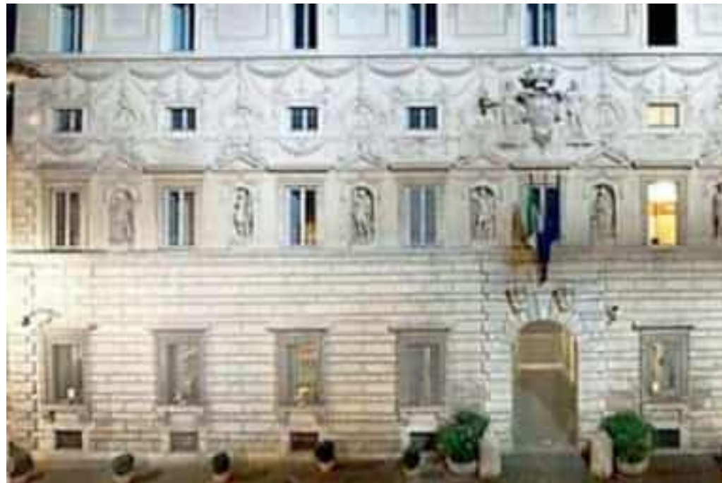
Palazzo Spada, a Roma. Sede del Consiglio di Stato

I giudici, non essendo medici, scrivono che una decisione su questi temi «non può sconfi-