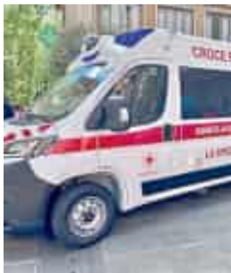
La nuova ambulanza