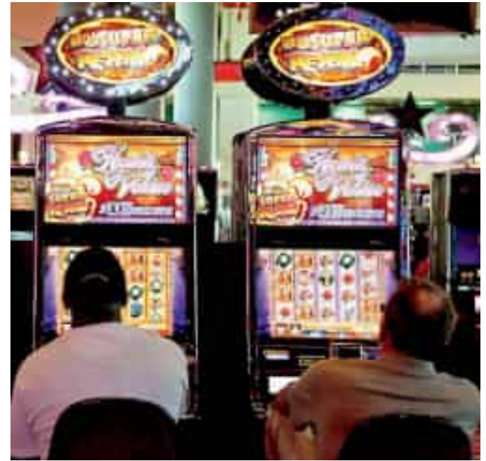
Il gioco d'azzardo è una piaga sociale

I consiglieri chiedono che la Commissione affronti diversi aspetti, dalla mappatura aggiornata degli esercizi con apparecchi da gioco e delle autorizzazioni attive, al numero dei controlli effettuati e le eventuali criticità emerse. Si