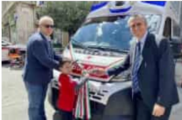
Sopra, i volontari della Cri, a sinistra l'inaugurazione dell'ambulanza e sotto una simulazione di pronto soccorso