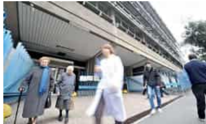
Il dipartimento di Medicina in viale Benedetto XV

traverso informazioni chiare e approfondite sui percorsi di studio, sulle prospettive professionali e sul ruolo strategico che ogni specializzazione svolge all'interno della sanità pubblica. In questo contesto, lo studio non viene presentato soltanto come un obbligo accademico, ma come vocazione, responsabilità e servizio alla collettività».