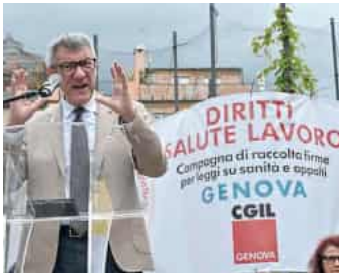
Maurizio Landini, segretario generale della Cgil, a Genova

L'assemblea generale organizzata dalla Camera del lavoro di Genova ai Giardini Luzzati è stata aperta dal segretario generale della Cgil genovese, Igor Magni. Le due proposte di legge riguardano, da un lato, la sanità e il diritto effettivo alla tutela della salute, con l'obiettivo di difendere e rafforzare il servizio sanitario nazionale e valo-