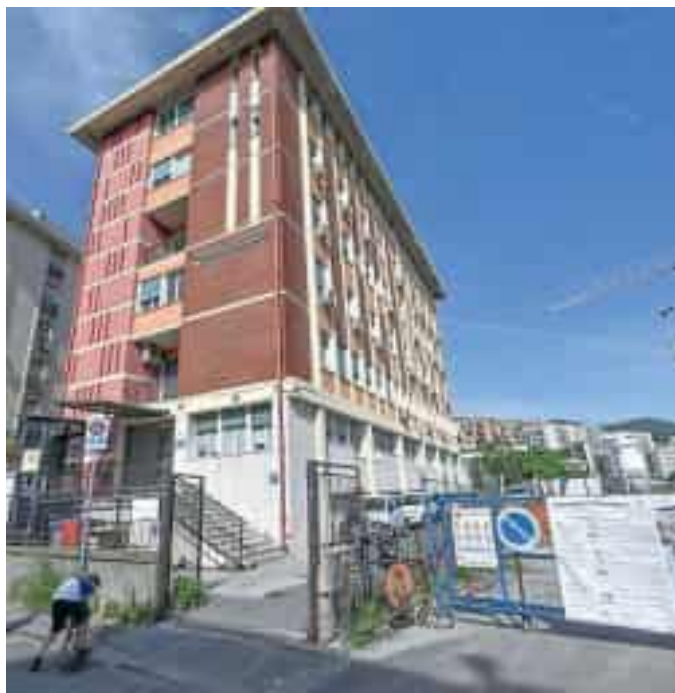
Il cartello spuntato in via Bainsizza