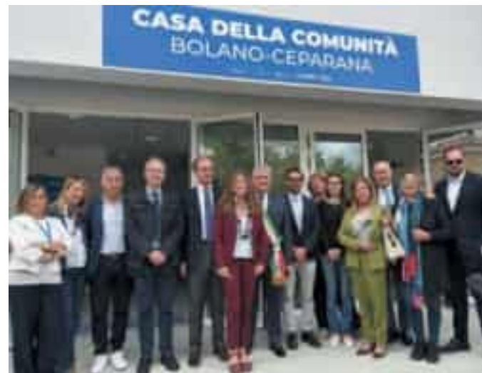
Ieri l'inaugurazione della Casa della comunità di Ceparana

Soddisfatto anche il coordinatore di Asl5 Cavagnaro, che ha definito la struttura «un tassello fondamentale della nuova rete sanitaria territoriale». «Questa sede nasce sulle ceneri di un edificio non più utilizzabile e og-