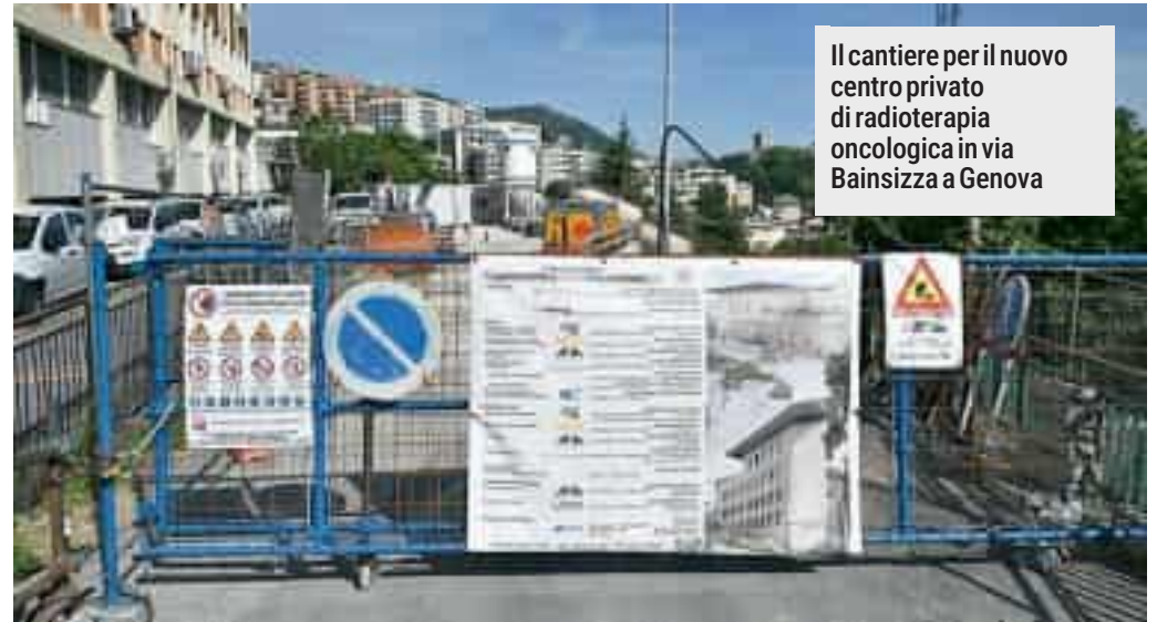
Il cantiere per il nuovo centro privato di radioterapia oncologica in via Bainsizza a Genova

L'apertura del centro è prevista entro un anno, non di più, guarda caso quando due dei quattro acceleratori del San Martino - al piano fondi dell'ex Ist - avranno 17 e 12 anni e potrebbero aver bisogno di essere sostituiti. A pen-