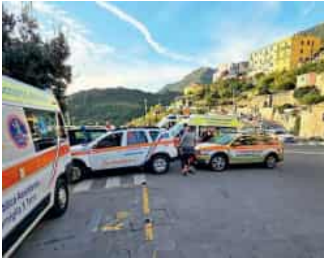
I mezzi della pubblica assistenza di Corniglia