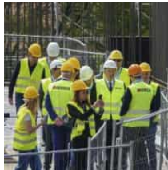
Un sopralluogo degli amministratori regionali e locali al cantiere dell'ospedale Felettino (foto d'archivio)

«Il closing finanziario - ha spiegato Giacomo Raul Giampedrone assessore regionale all'edilizia ospedaliera - è una delle due chiavi del partenariato pubblico-privato a garanzia della realizzazione dell'opera insieme all'avanzamento lavori in cantiere. E' stata accertata l'erogabilità delle somme finanziate e la disponibilità immediata dei fondi che sommati ai mezzi propri già immessi della Guerrato spa e al contributo pubblico coprono tutto il fabbisogno necessario per la realizzazione del Felettino».