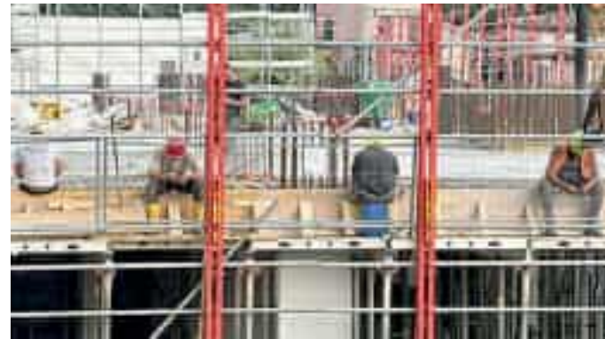
Alcuni operai durante una pausa nel cantiere del nuovo ospedale

rativo della Regione, ad operare come stazione appaltante. E dal capoluogo ligure è il commissario Fabrizio Cardone, a effettuare monitoraggi periodici. La parte dei lavori esterni vedrà come data di inizio il mese di gennaio del 2027. È quanto prevede il crono programma aggiornato. Partiranno le opere di scavo del parcheggio interrato,