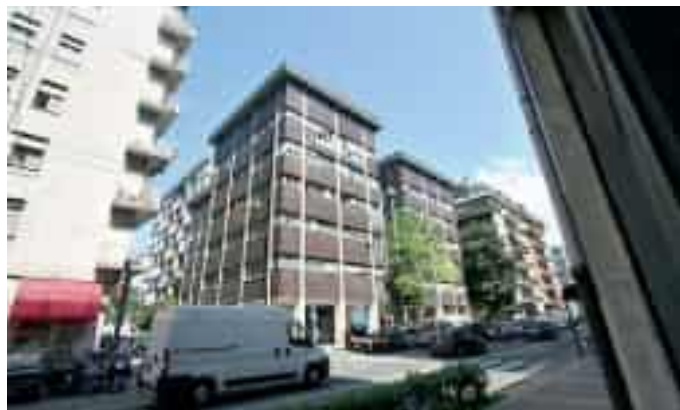
La sede di Asl 5 in via XXIV Maggio