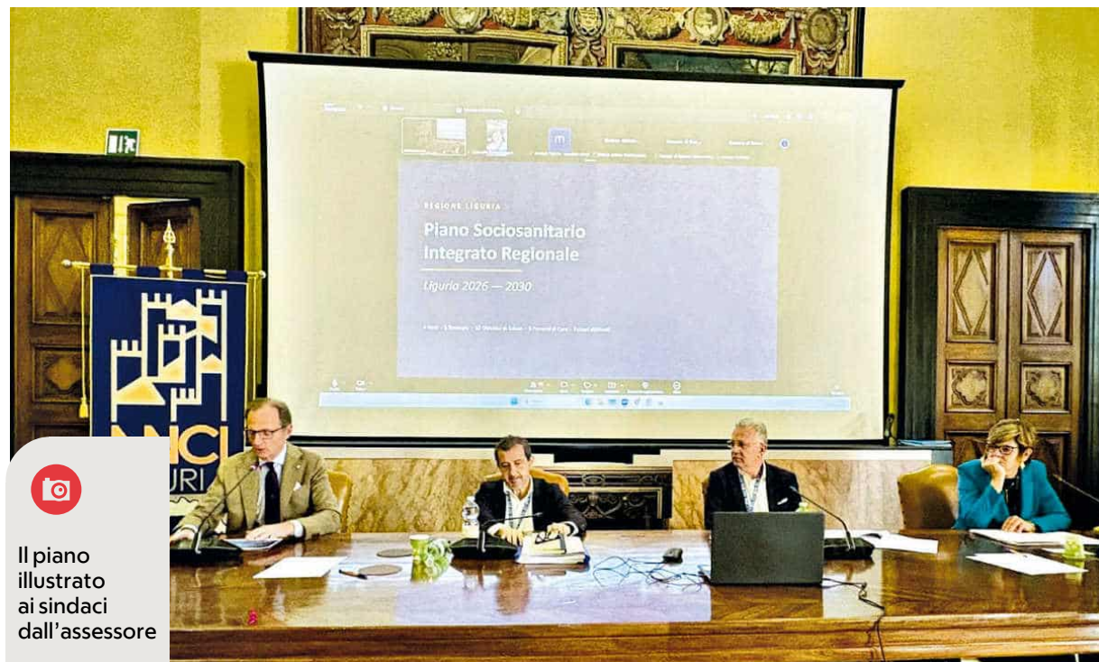
Il piano illustrato ai sindaci dall'assessore

Ma a destare le maggiori perplessità, soprattutto da parte dei comuni più piccoli, alcuni punti, come quelli relativi all'ipotesi di accorpamento dei Di-