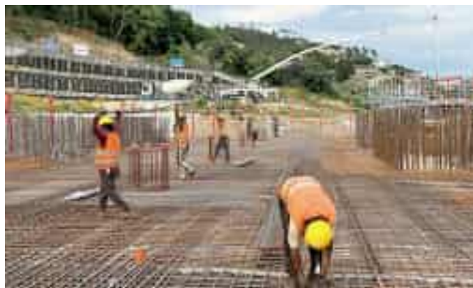
Operai al lavoro nel cantiere del nuovo ospedale Felettino

ospedaliero alla sanità, chiamata a gestire la presa in consegna e ad organizzare la messa in funzione del nuovo ospedale. Utilizza un termine inglese, «closing», la Regione, per indicare la chiusura della procedura di verifica da parte della banca: «Ora che abbiamo questa solida garanzia finanziaria - affer-