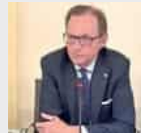
MASSIMO NICOLÒ ASSESSORE ALLA SALUTE REGIONE LIGURIA

Assicuriamo la massima attenzione nei confronti delle persone anziane, fragili e più esposte