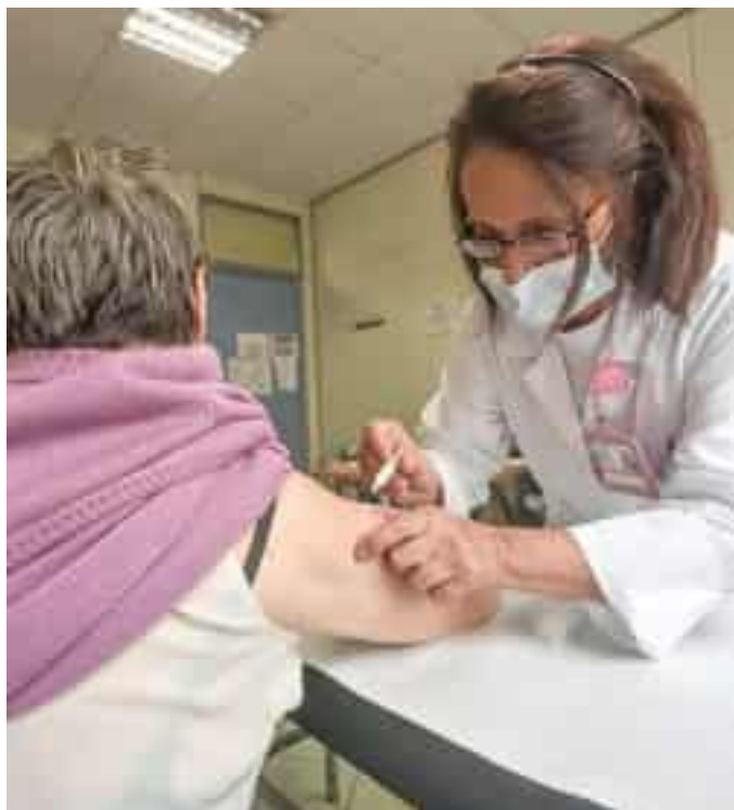
Vaccinazione anti-influenzale in un ambulatorio della Asl3