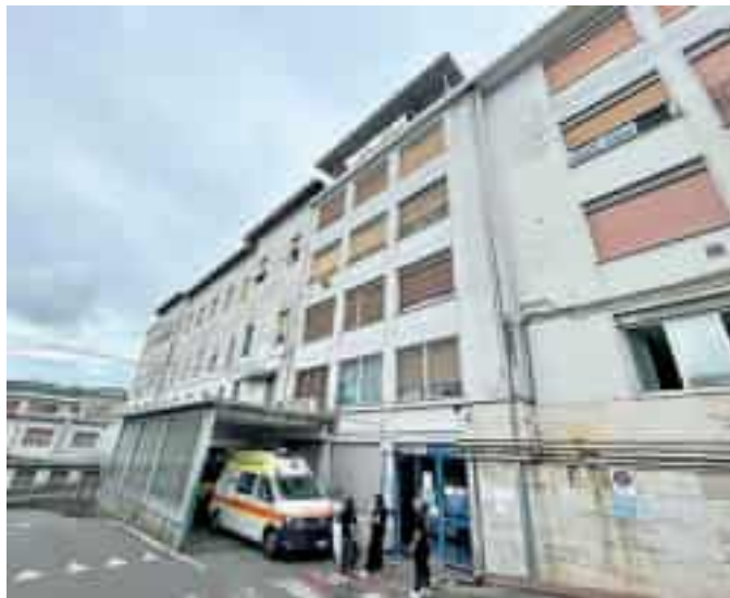
Il padiglione del pronto soccorso dell'ospedale Sant'Andrea

La situazione viene descritta senza giri di parole nei documenti della nuova azienda sanitaria regionale, che evidenziano una carenza di otto medici complessivamente tra i due pronto soccorso. Ma soprattutto si sottolinea che «la scopertura in detto servizio potrebbe pregiudicare il regolare svolgimento delle inderogabili attività erogate dalle