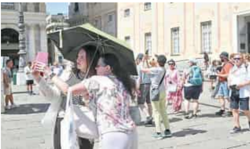
Due turiste si riparano dal caldo opprimente con un ombrello in piazza De Ferrari, nel centro di Genova

Scatterà domani l'estensione dell'orario di gratuità