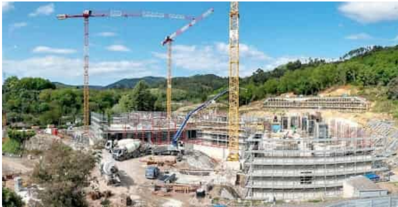
Lo stato attuale del cantiere immortalato dal fotografo spezzino Roberto Celi

Seguendo la stessa saggia, i livelli prendono pertanto forma uno sopra l'altro, senza interruzioni. L'obiettivo è quello di arrivare a chiudere i lavori nel gennaio del 2028, in termini strutturali, per affidare poi il complesso